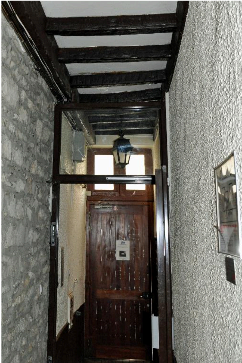
Vue intérieure, l'allée