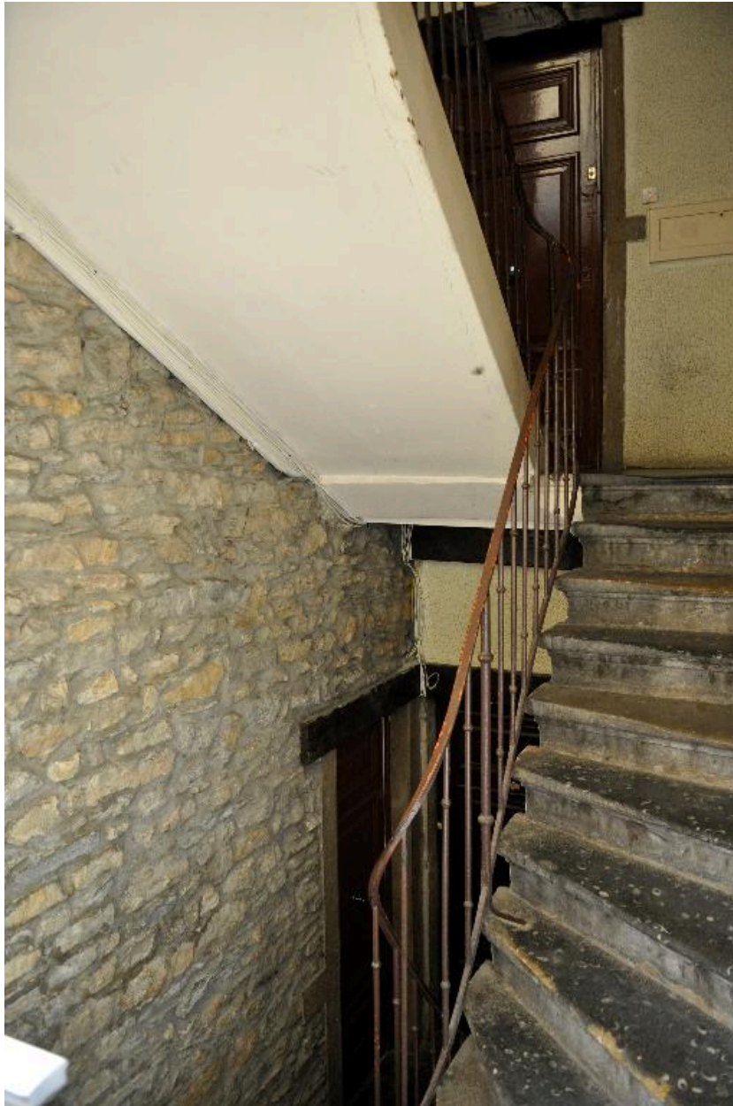
Vue intérieure, transition entre les volées d'escalier en pierre et celles en bois