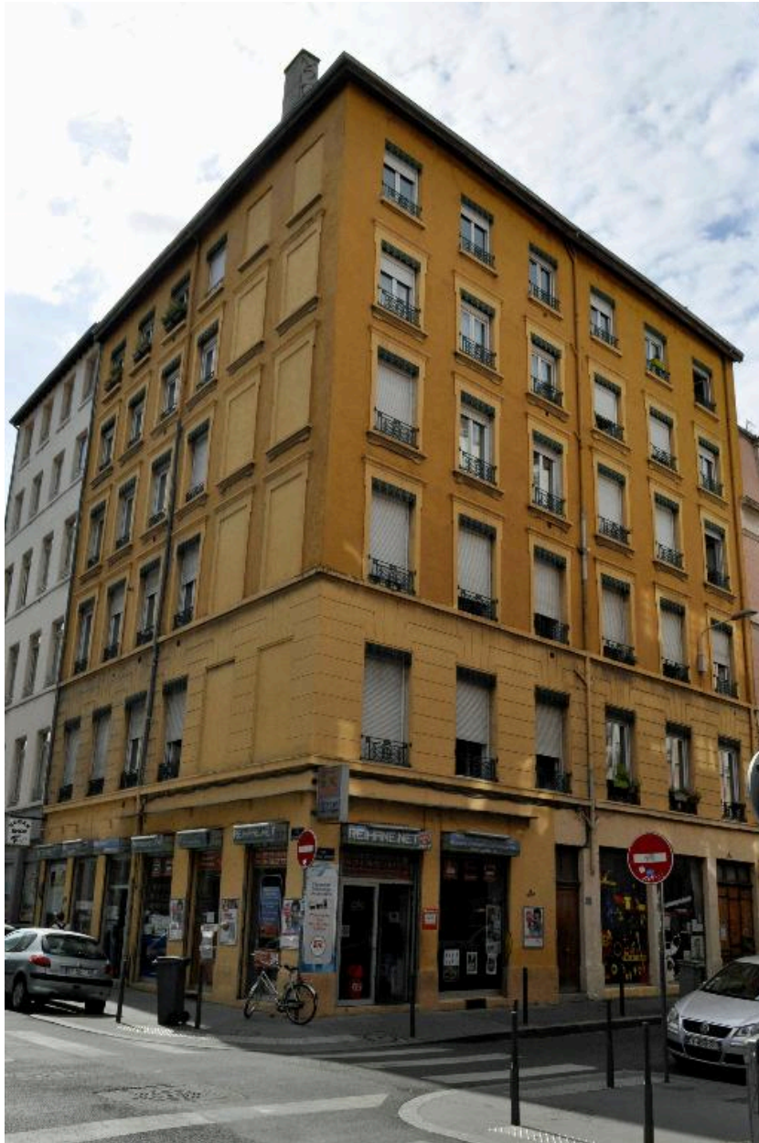
Vue d'ensemble, prise depuis le nord