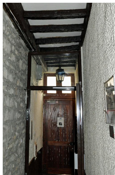
Vue intérieure, l'allée IVR84_20176901524NUCA