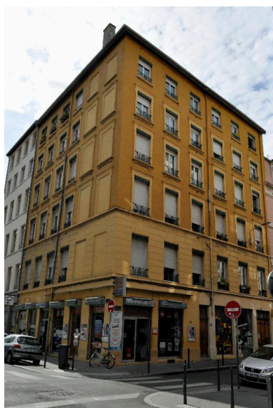
Vue d'ensemble, prise depuis le nord IVR84_20176901522NUCA