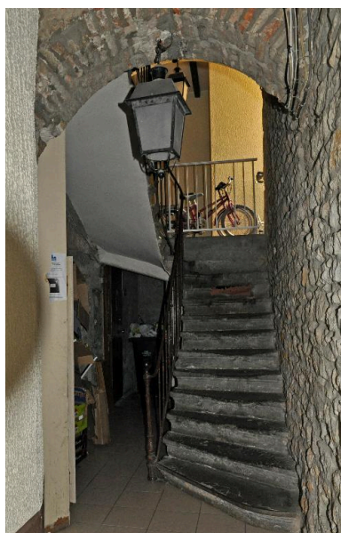
Vue intérieure, le départ de l'escalier IVR84_20176901525NUCA