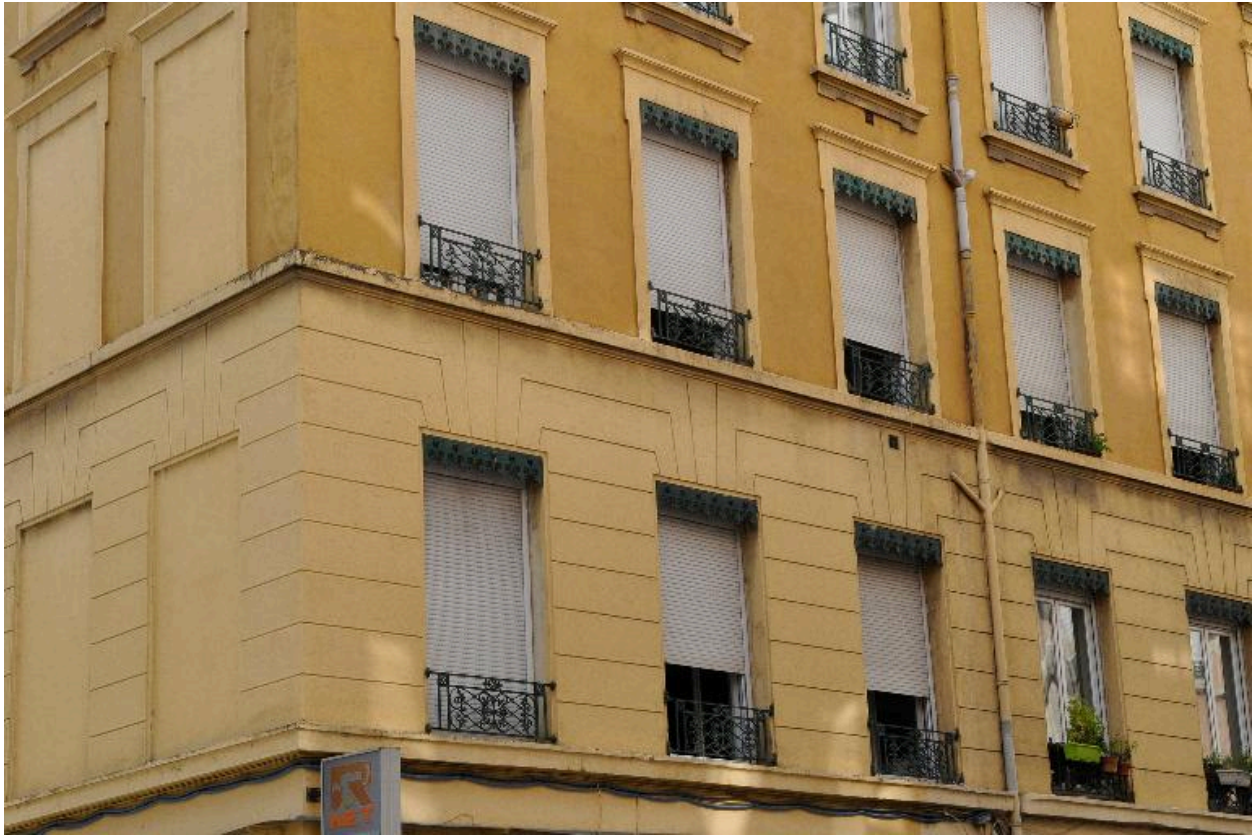
Elévation sur la rue Sébastien-Gryphe, décor de l'étage en entresol et 2e étage carré