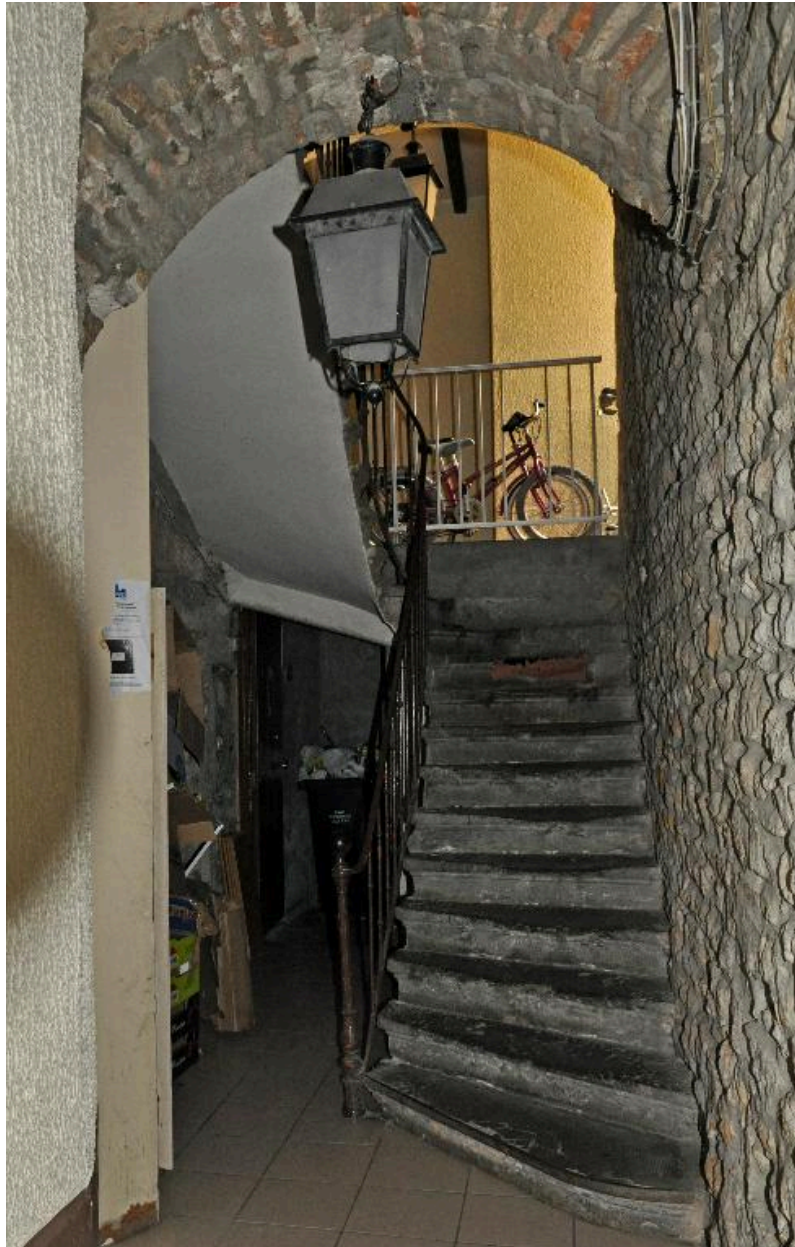
Vue intérieure, le départ de l'escalier