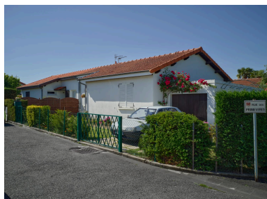
Vue partielle d'un ensemble de quatre maisons regroupées en H, rue des Primevères (construction en 1972-1973).