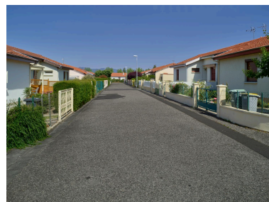
Perspective sur la rue des Primevères, en direction du nord-ouest. IVR84_20216301200NUCA