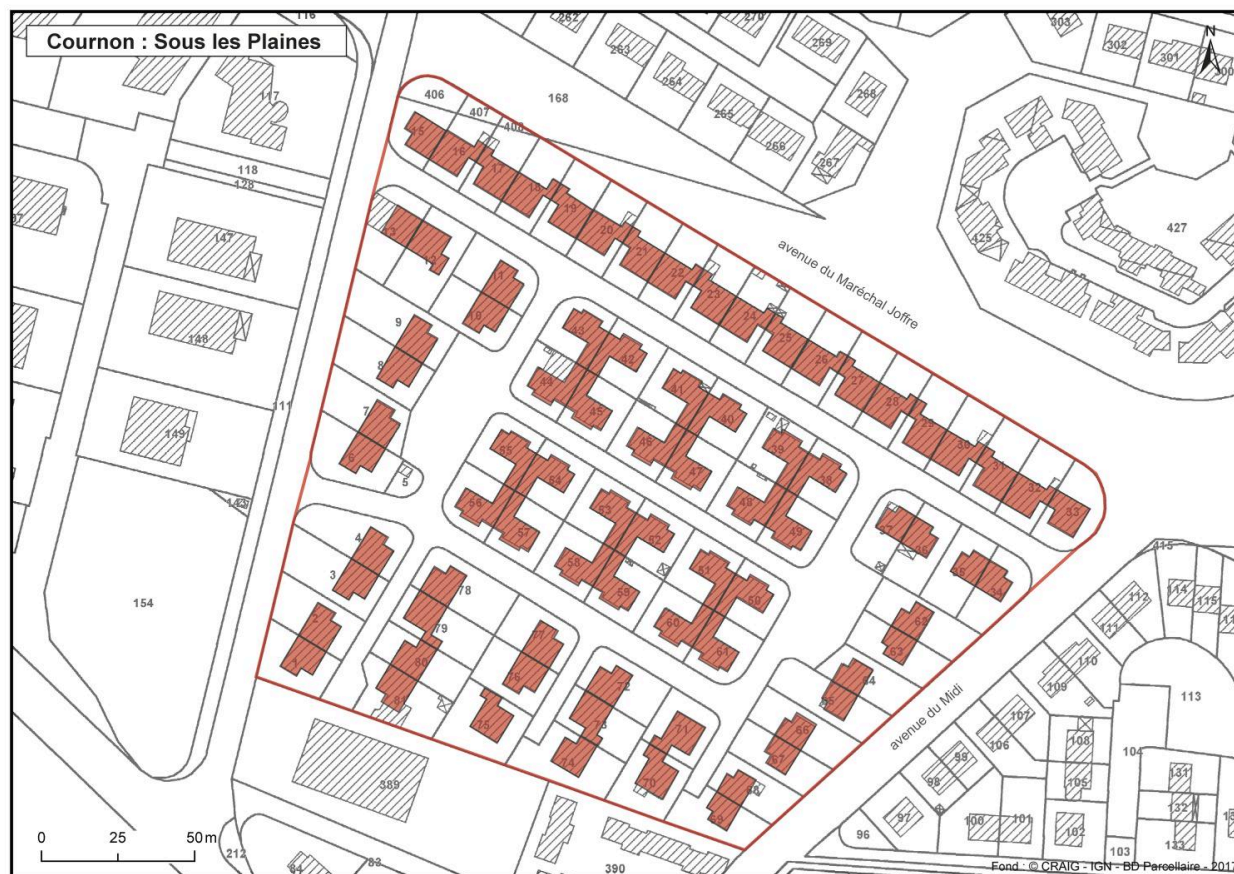
Plan des différents bâtiments d'origine de la cité.