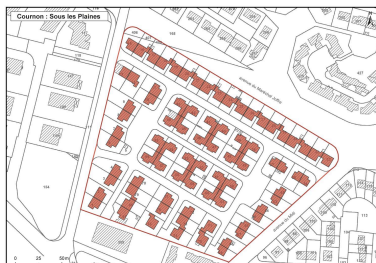
Plan des différents bâtiments d'origine de la cité. IVR84_20216301287NUDA