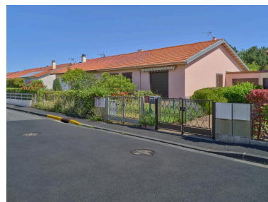
Maisons doubles en rez-de- chaussée, accolées aux voisins par l'intermédiaire de leurs garages, rue des Boutons-d'Or, au nord-est de la cité (construction en 1973).