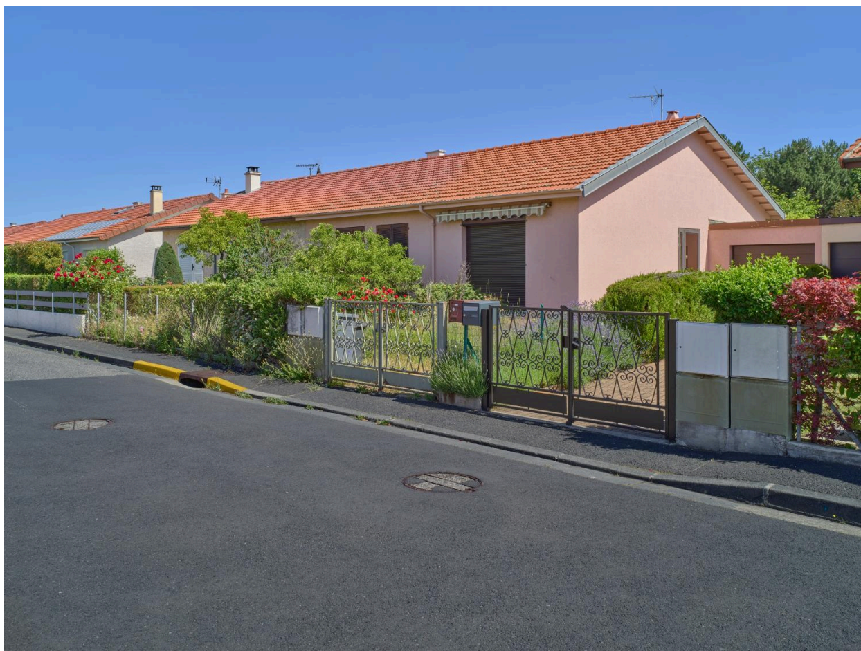
Maisons doubles en rez-de-chaussée, accolées aux voisines par l'intermédiaire de leurs garages, rue des Boutons-d'Or, au nord-est de la cité (construction en 1973).