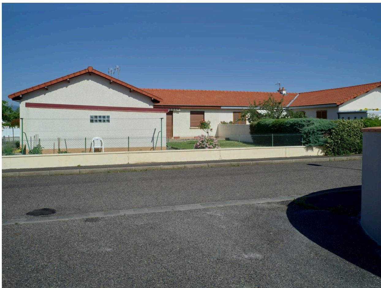
Vue latérale d'un ensemble de maisons disposées en H, rue des Coquelicots (construction en 1972-1973).