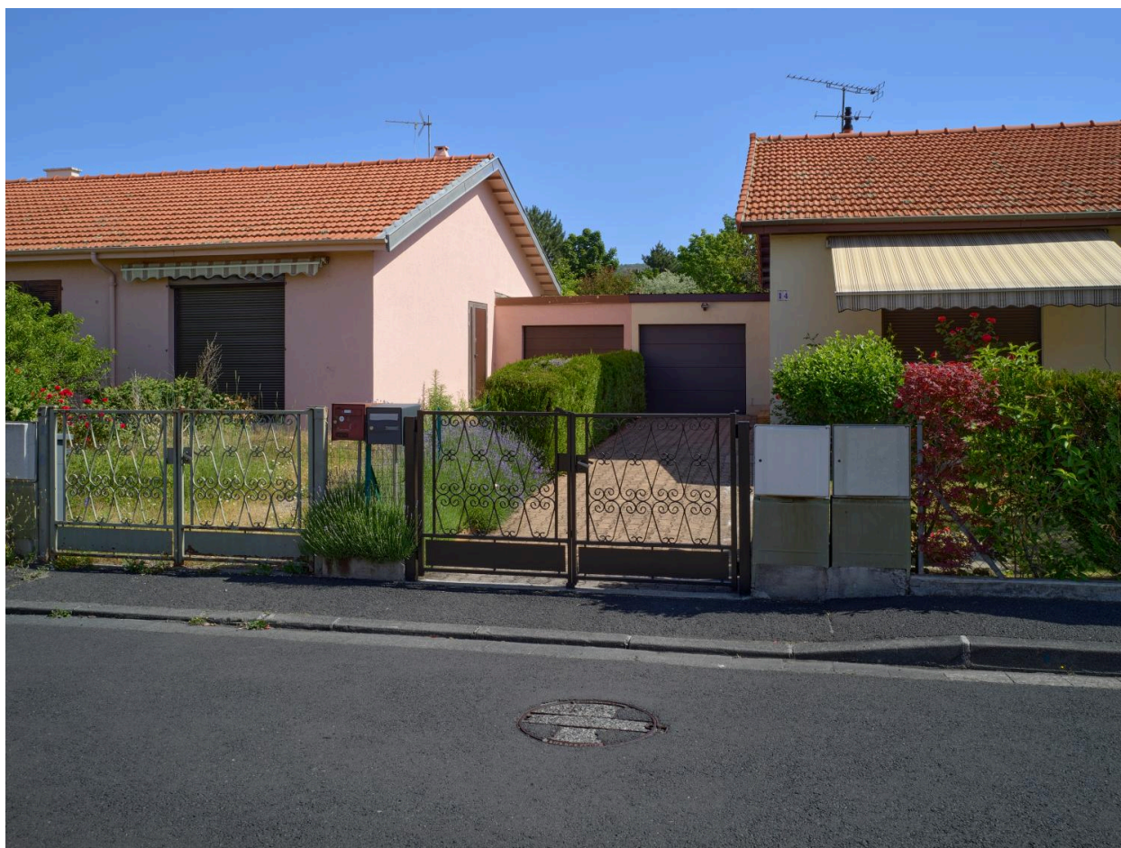
Garages de liaison entre deux maisons doubles en rez-de-chaussée, rue des Boutons-d'Or.