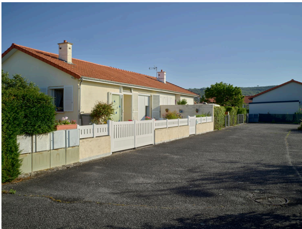
Maison double en rez-de-chaussée, rue des Myosotis (construction en 1973-1974).