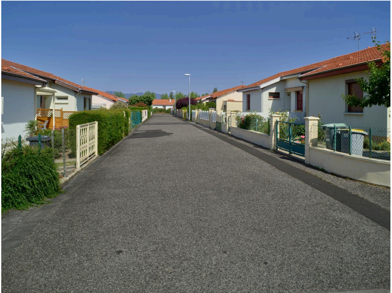
Perspective sur la rue des Primevères, en direction du nord-ouest.