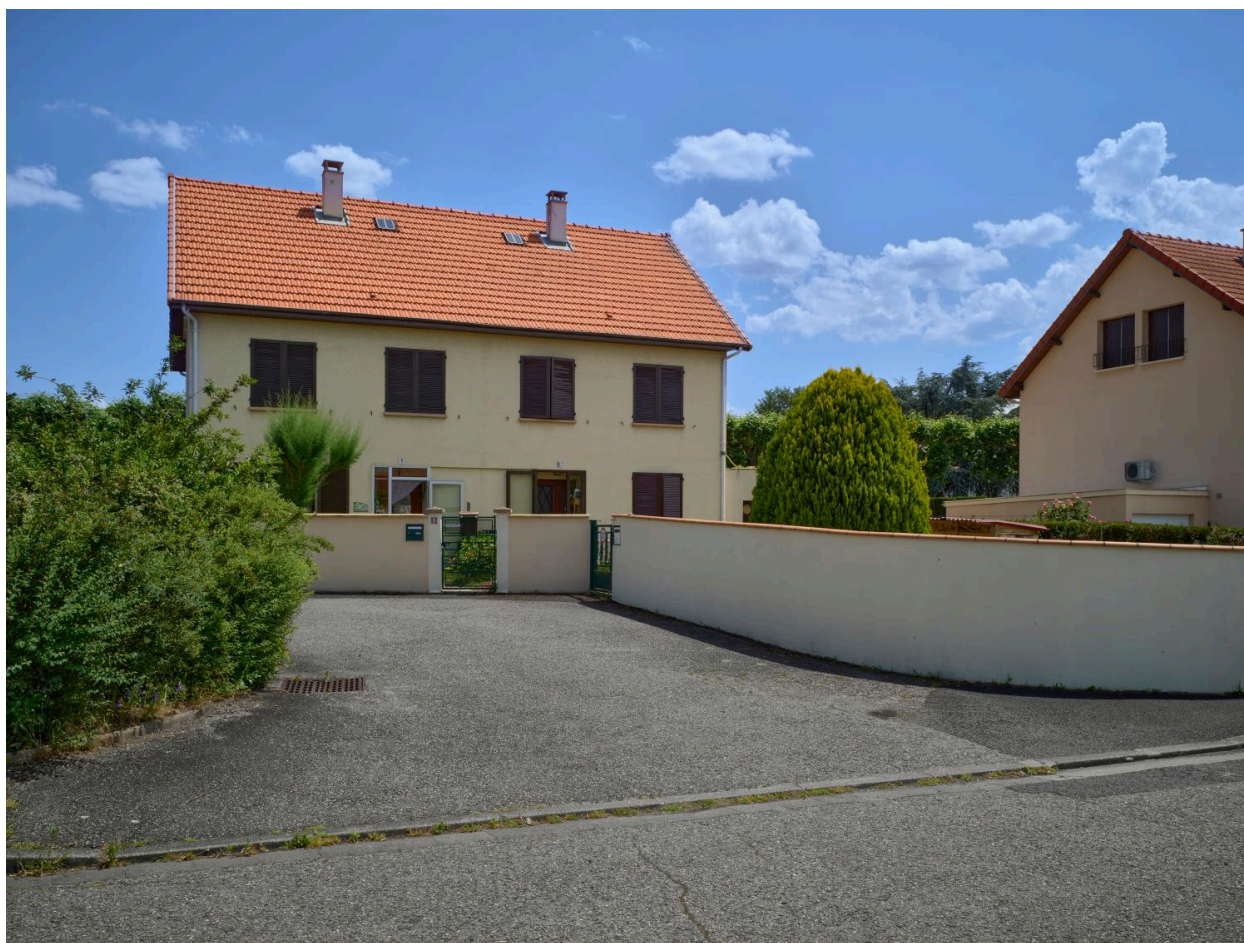
Maison double à un étage-carré, rue des Coquelicots, à l'est de la cité (construction en 1973).