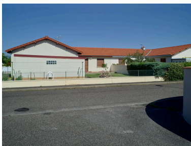
Vue latérale d'un ensemble de maisons disposées en H, rue des Coquelicots (construction en 1972-1973). IVR84_20216301199NUCA