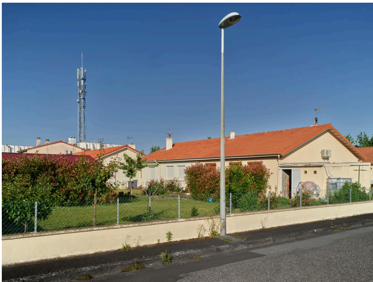
Élévation sur jardin d'une maison double de la rue des Coquelicots, côté sud-ouest de la cité (construction de 1973-1974).