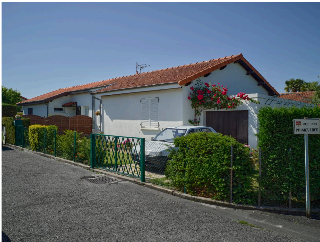
Vue partielle d'un ensemble de quatre maisons regroupées en H, rue des Primevères (construction en 1972-1973).