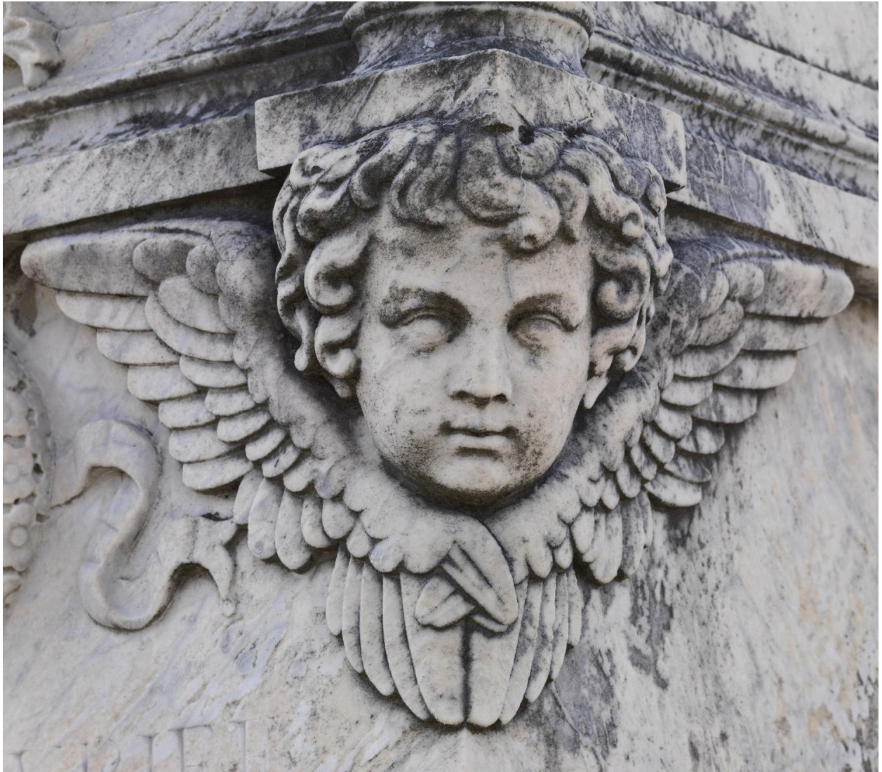
Détail de la tête de chérubin située à droite