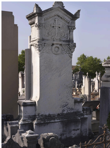
La stèle