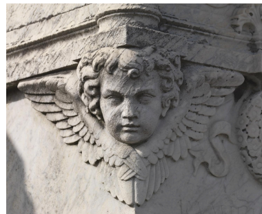
Détail de la tête de chérubin située à gauche IVR82_20086902515NUCA