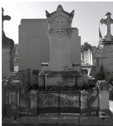
Vue générale IVR82_20086902514NUCA