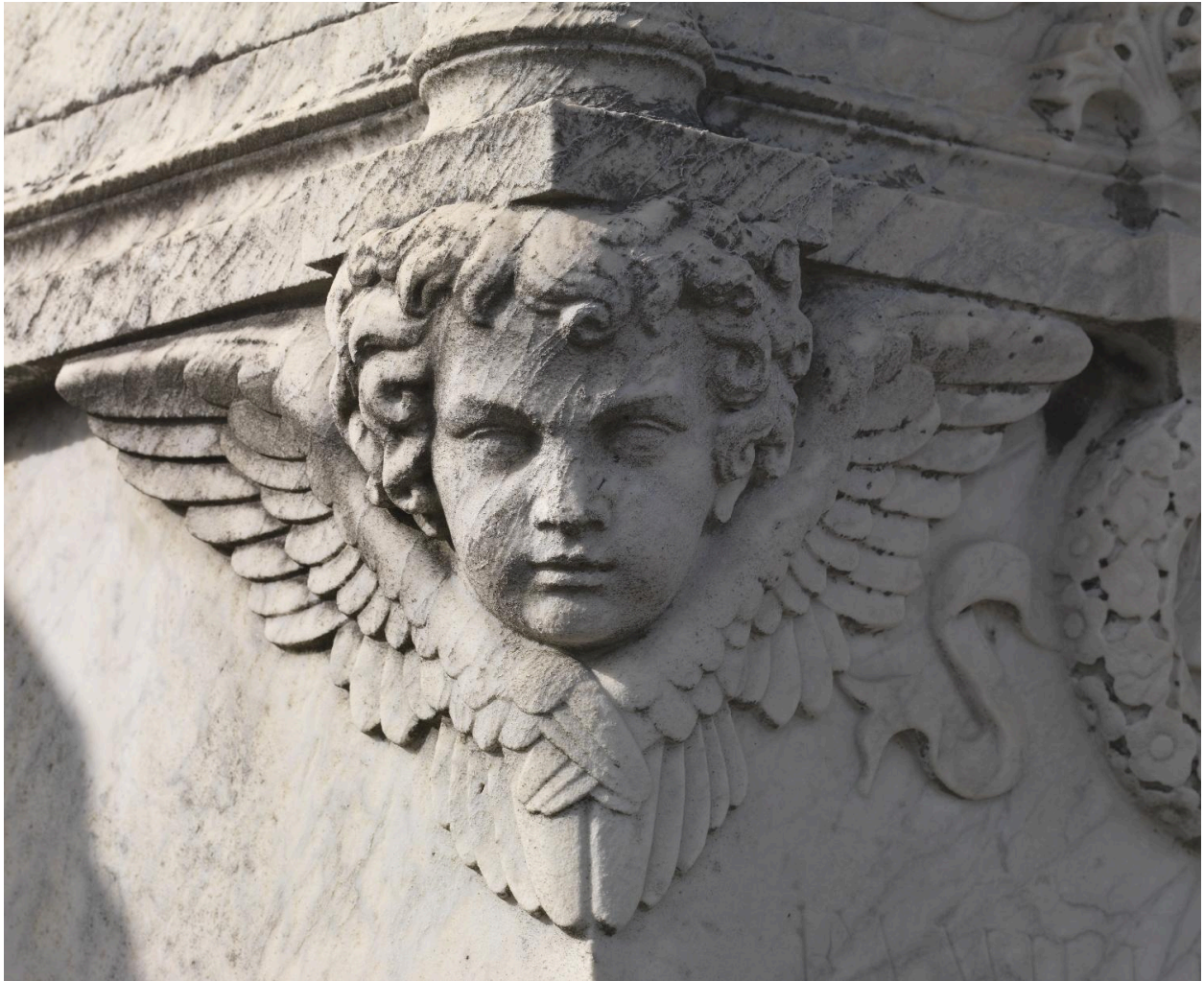
Détail de la tête de chérubin située à gauche