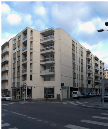
Vue générale IVR82_20116904102NUCA