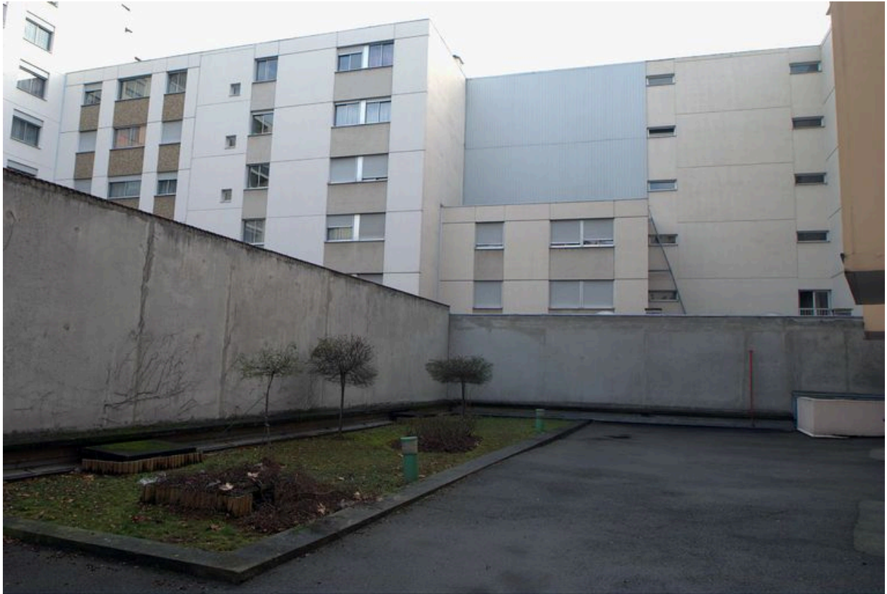
Elévation postérieure, vue partielle