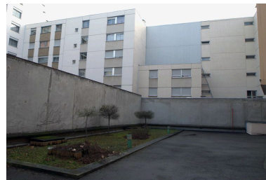
Elévation postérieure, vue partielle IVR82_20116904103NUCA