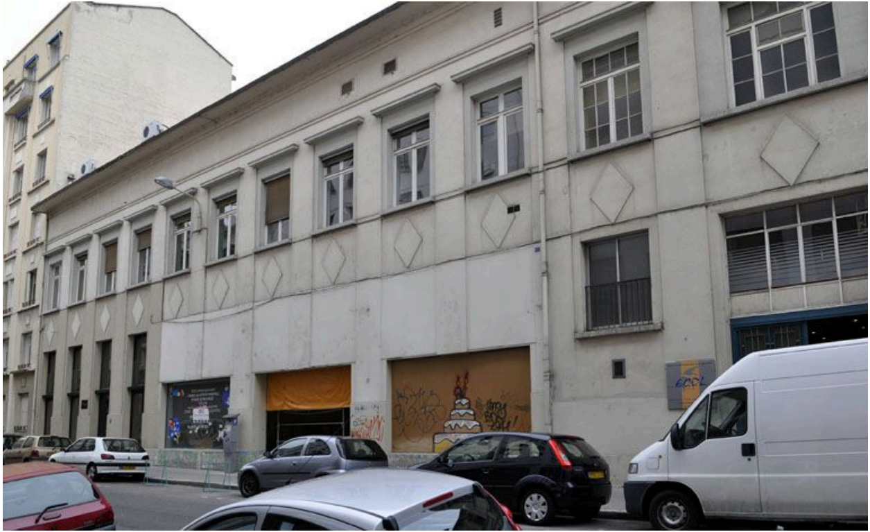
Façade antérieure depuis l'Est.