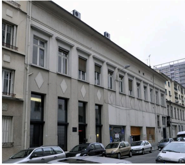
Vue générale IVR82_20106900824NUCA