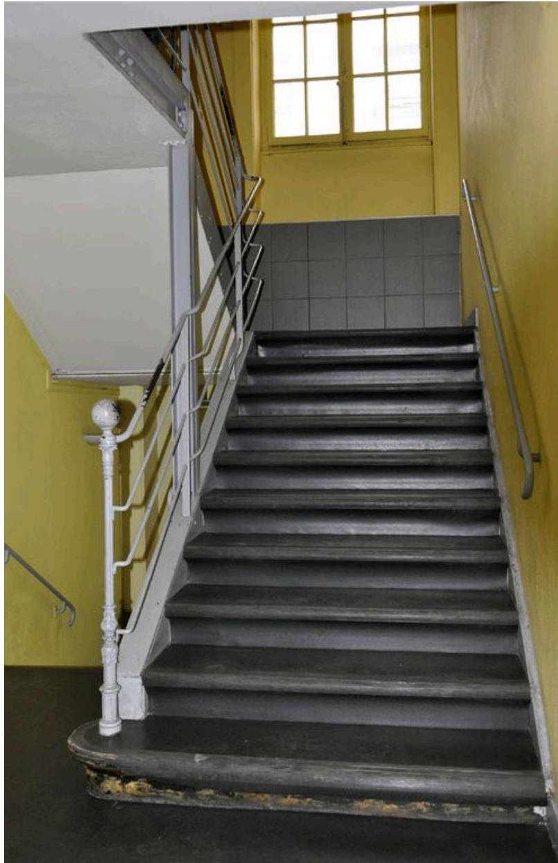
Volée d'escalier menant du premier palier au second.