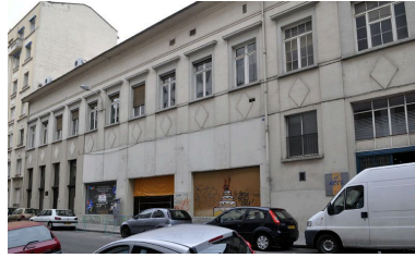
Façade antérieure depuis l'Est.