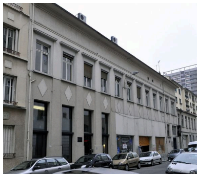
Vue générale IVR82_20106900824NUCA