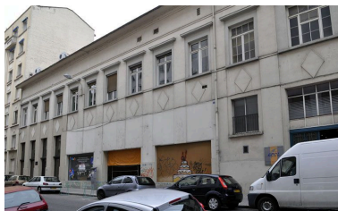
Façade antérieure depuis l'Est.