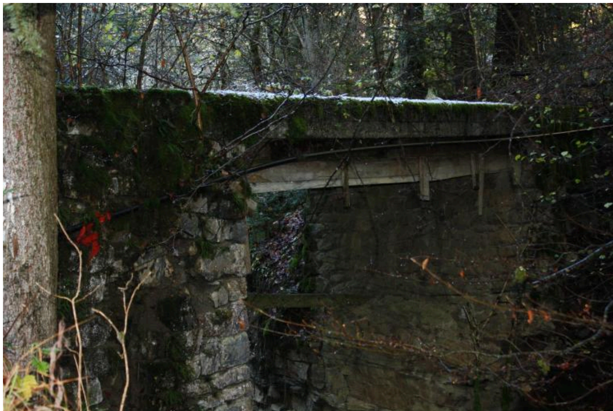
Vieux pont des Landoz, détails culée et tablier béton