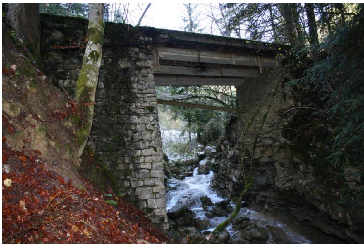
Vieux pont des Landoz, face aval