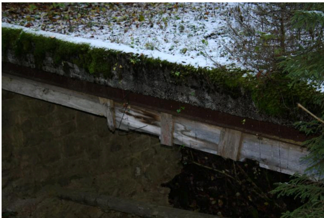
Vieux pont des Landoz, détails poutre acier et renfort bois