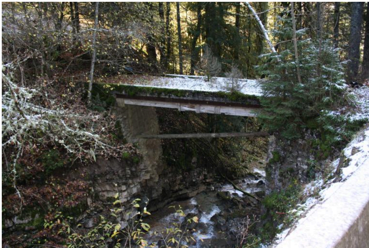
Vieux pont des Landoz, face amont