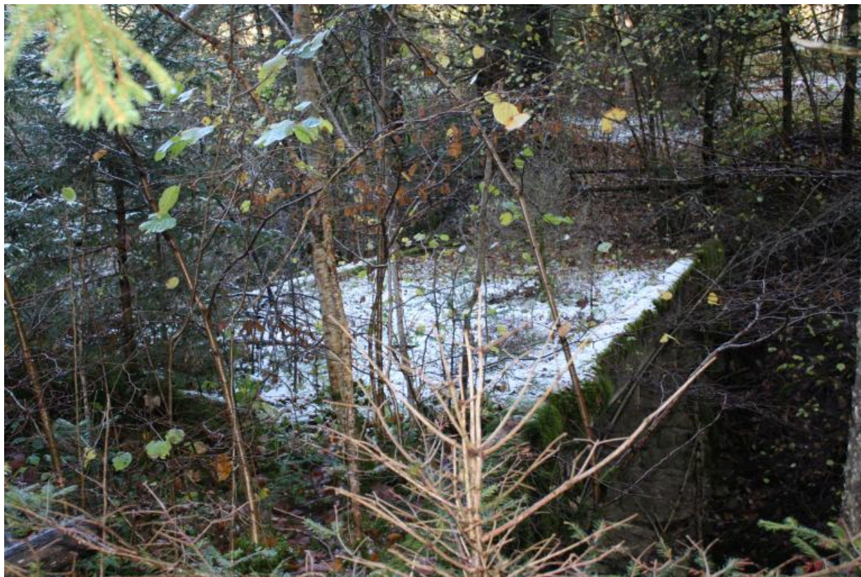
Vieux pont des Landoz, chaussée et gardes corps