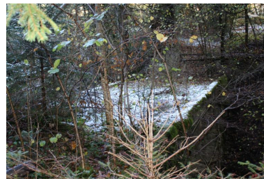
Vieux pont des Landoz, chaussée et gardes corps IVR84_20207401259NUCA