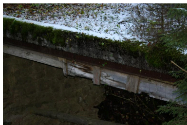
Vieux pont des Landoz, détails poutre acier et renfort bois IVR84_20207401260NUCA