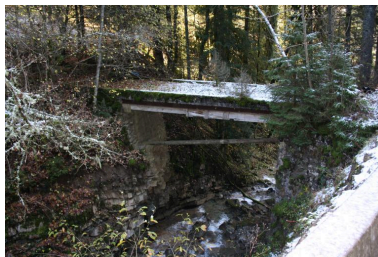
Vieux pont des Landoz, face amont IVR84_20207401258NUCA