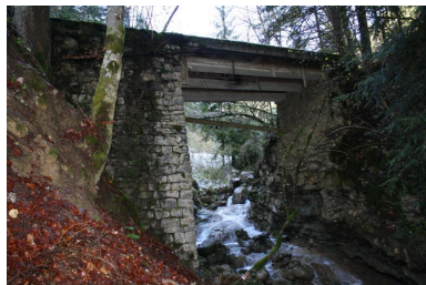
Vieux pont des Landoz, face aval IVR84_20197401279NUCA