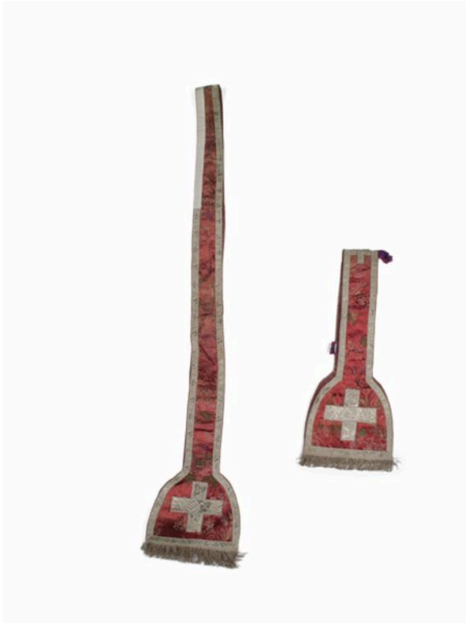
Vue générale de l'étole et du manipule