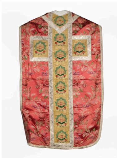
Vue générale du dos de la chasuble IVR83_20156300206NUC4A