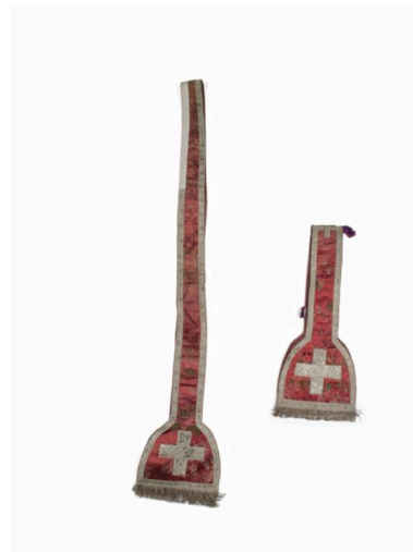
Vue générale de l'étole et du manipule IVR83_20156300207NUC4A