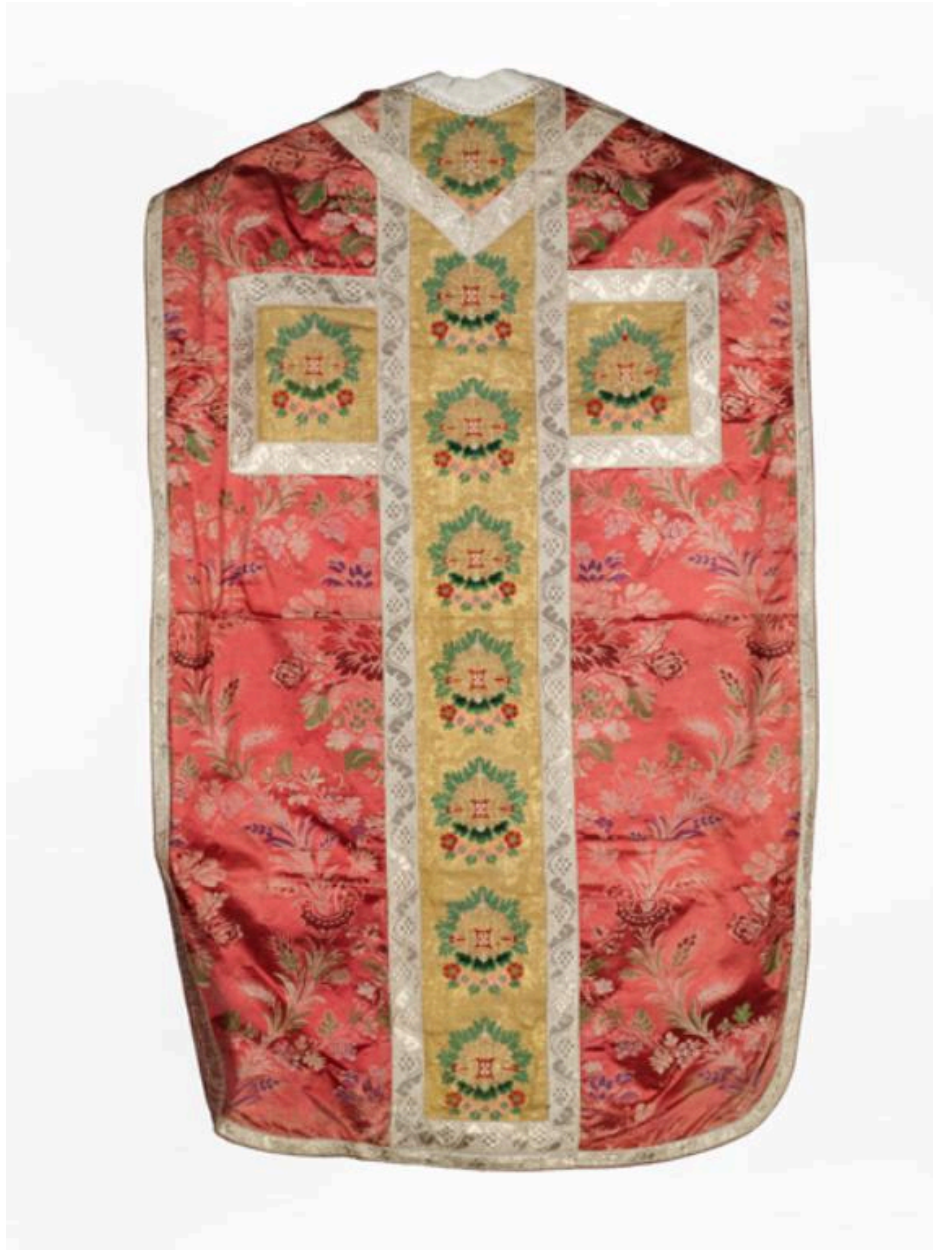
Vue générale du dos de la chasuble