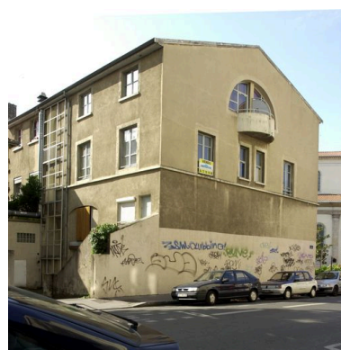
Elévation rue de Créqui. Vue d'ensemble depuis le nord-ouest. Etat en 2007