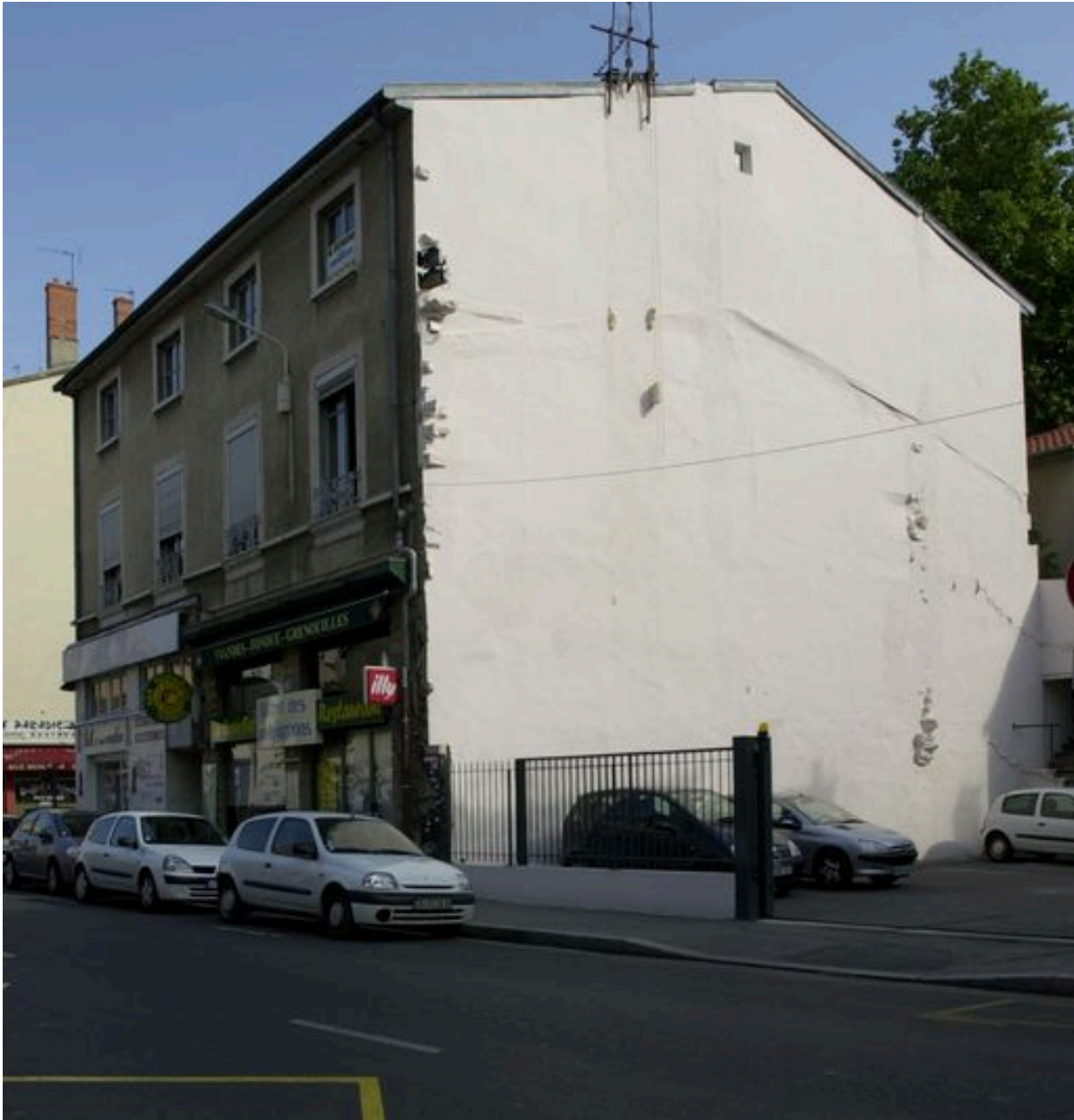
Elévation rue de la Guillotière. Vue d'ensemble depuis le sud-est. Etat en 2007