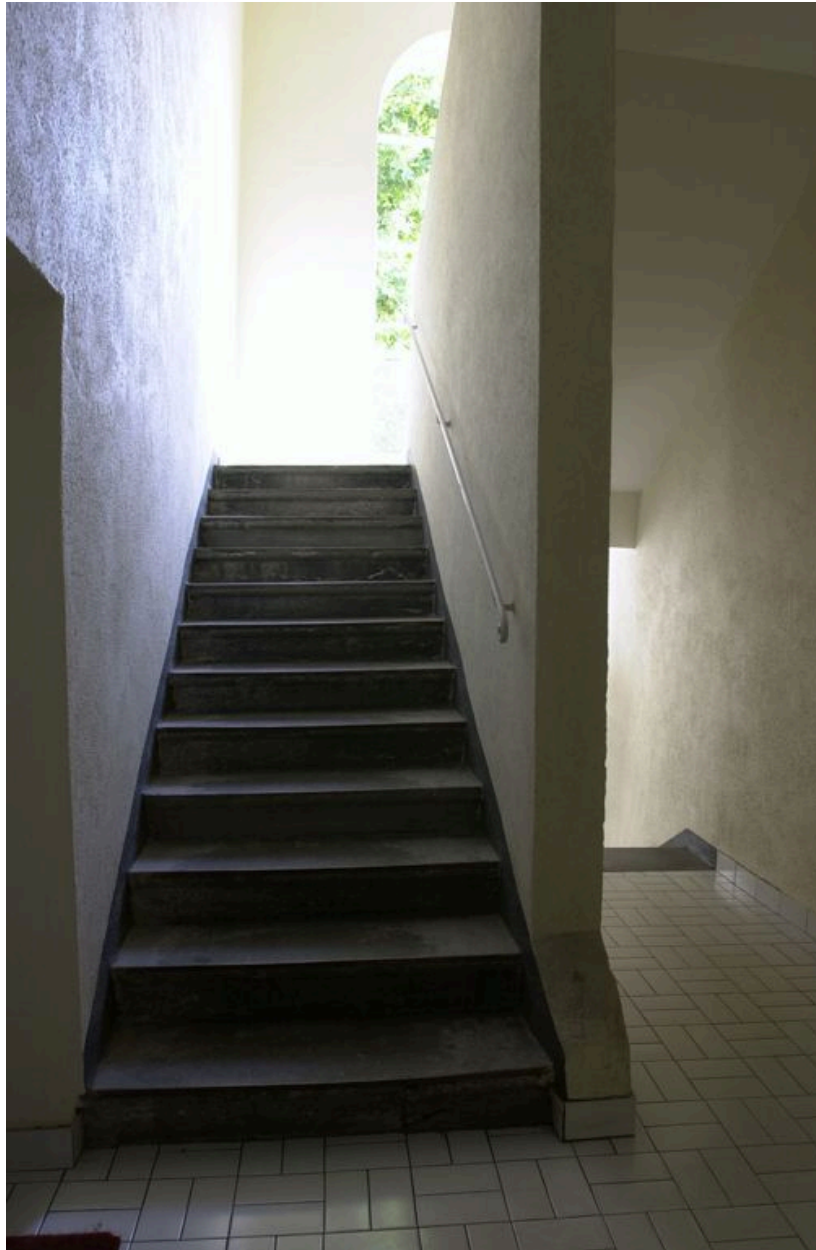
Volée de l'escalier. Etat en 2007