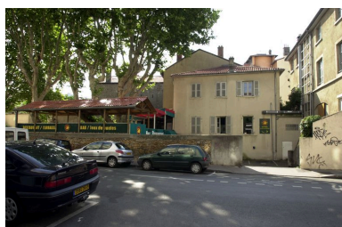
Vue de la cour et du corps de bâtiment rue de Créqui. Etat en 2007 IVR82_20106903645NUCA