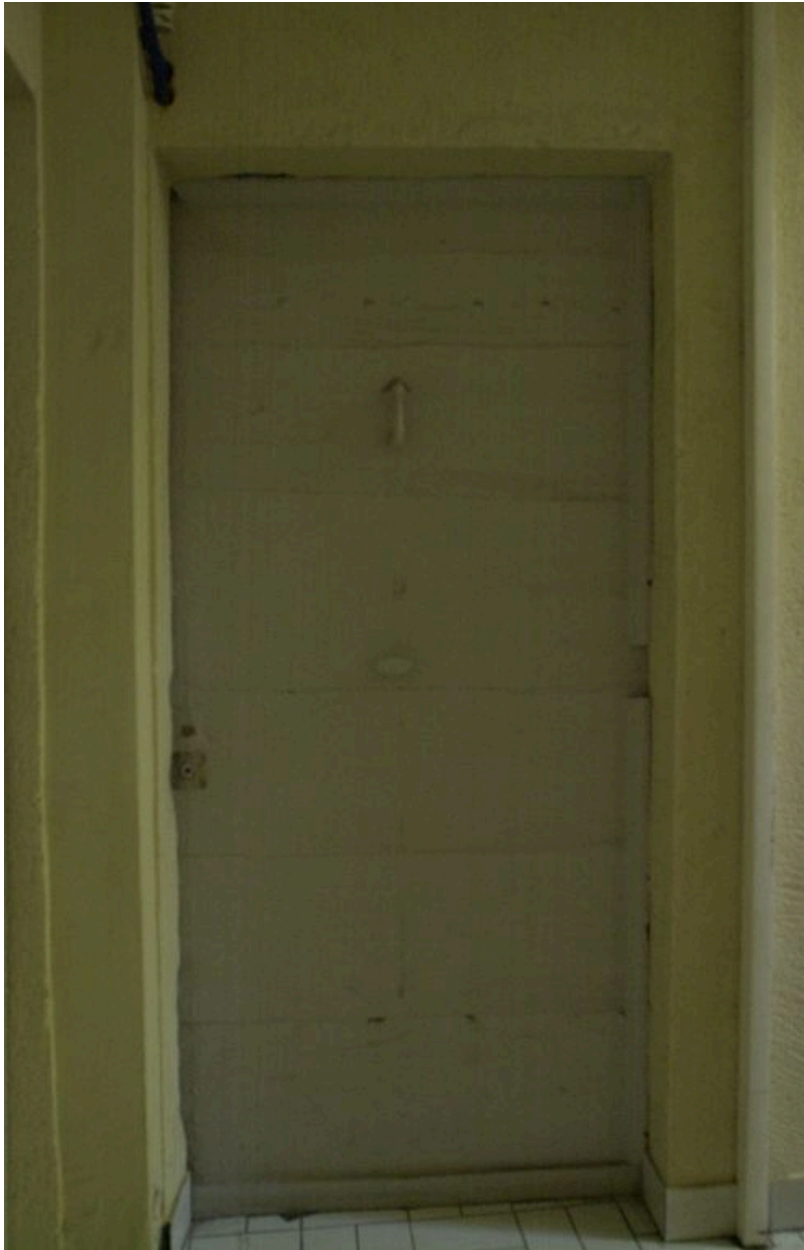
Porte palière. Etat en 2007