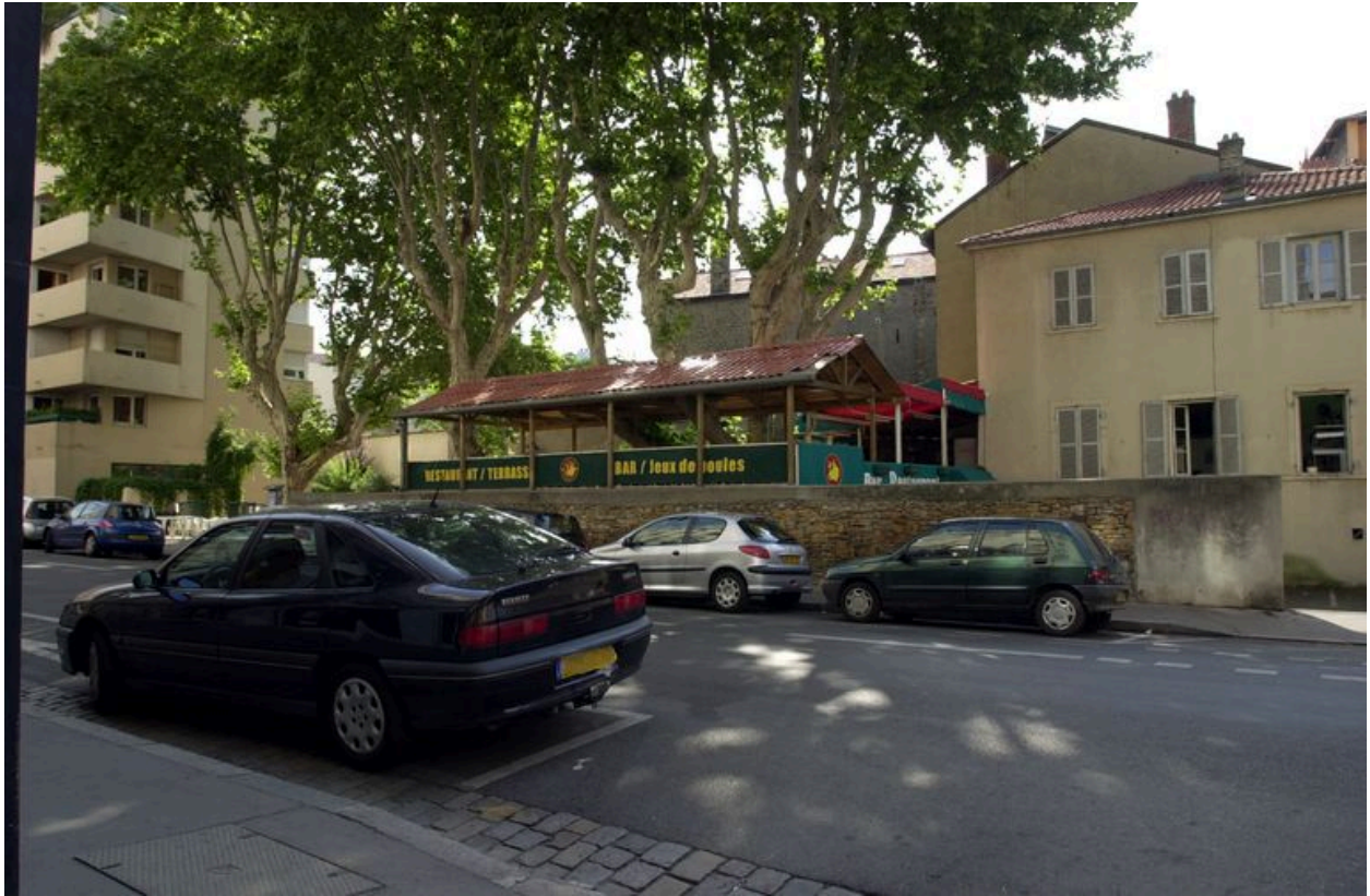
Vue de la cour et du restaurant, rue de Créqui. Etat en 2007