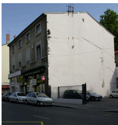
Elévation rue de la Guillotière. Vue d'ensemble depuis le sud-est. Etat en 2007 IVR82_20106903643NUCA