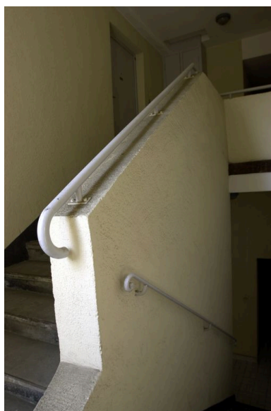
Escalier : arrivée du mur noyau au dernier étage. Etat en 2007