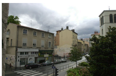
Elévation rue de la Guillotière. Vue d'ensemble depuis le sud-ouest. Etat en 2007 IVR82_20106903642NUCA