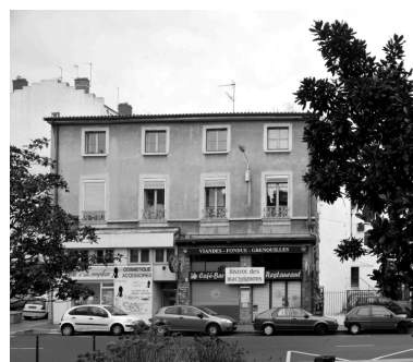
Elévation antérieure IVR82_20076901323NUC