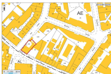
Plan masse et de situation, IVR82_20136902230NUDA