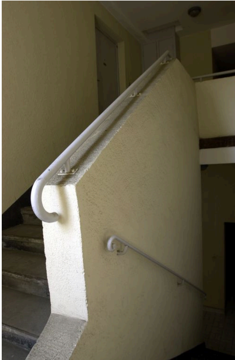
Escalier : arrivée du mur noyau au dernier étage. Etat en 2007