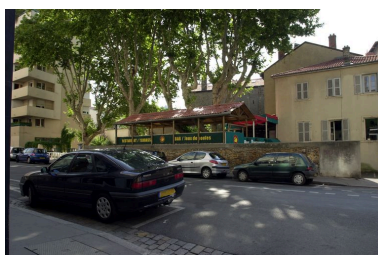
Vue de la cour et du restaurant, rue de Créqui. Etat en 2007 IVR82_20106903646NUCA