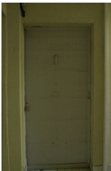
Porte palière. Etat en 2007