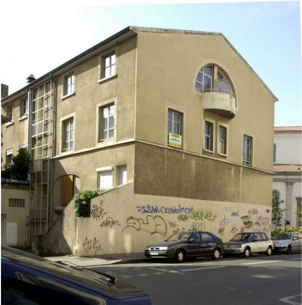
Elévation rue de Créqui. Vue d'ensemble depuis le nord-ouest. Etat en 2007