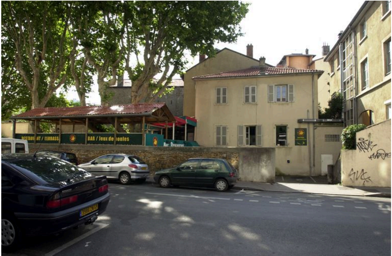
Vue de la cour et du corps de bâtiment rue de Créqui. Etat en 2007