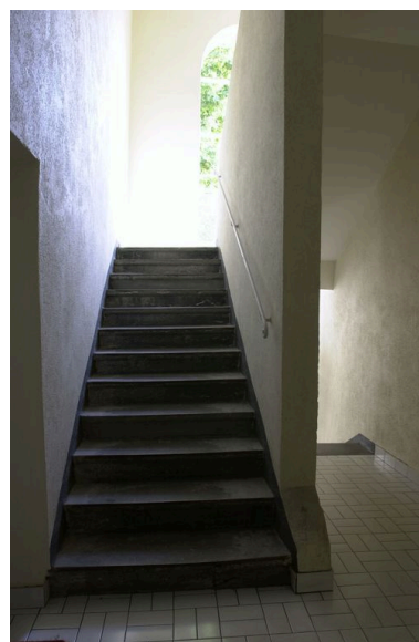
Volée de l'escalier. Etat en 2007