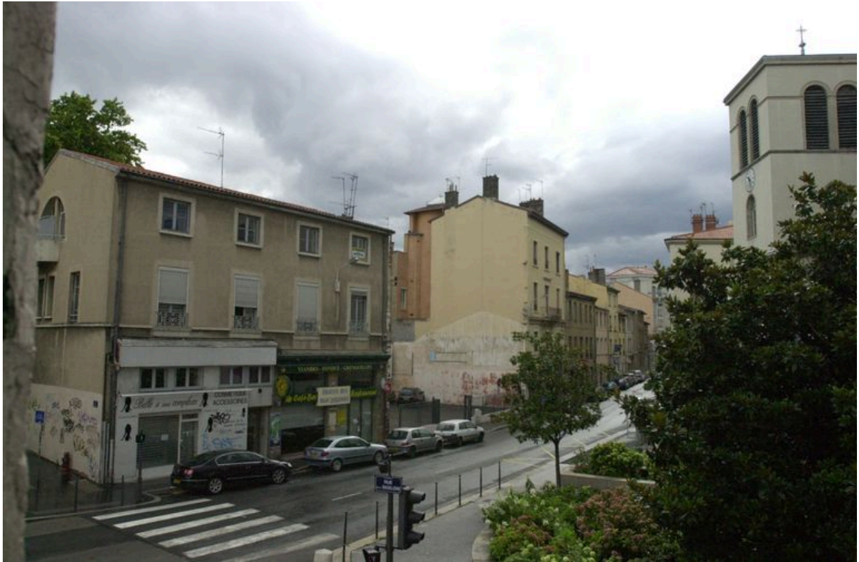
Elévation rue de la Guillotière. Vue d'ensemble depuis le sud-ouest. Etat en 2007