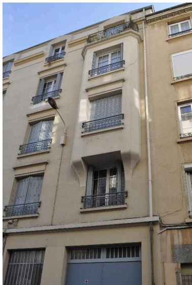
Détail d'une travée latérale avec bow-window IVR84_20166902147NUCA