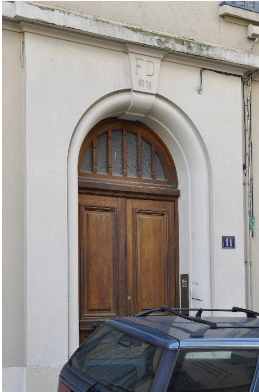
Porte d'entrée avec la signature et la date