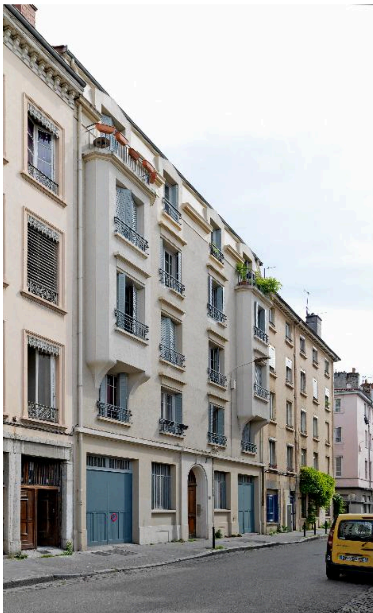
Vue d'ensemble, élévation sur rue