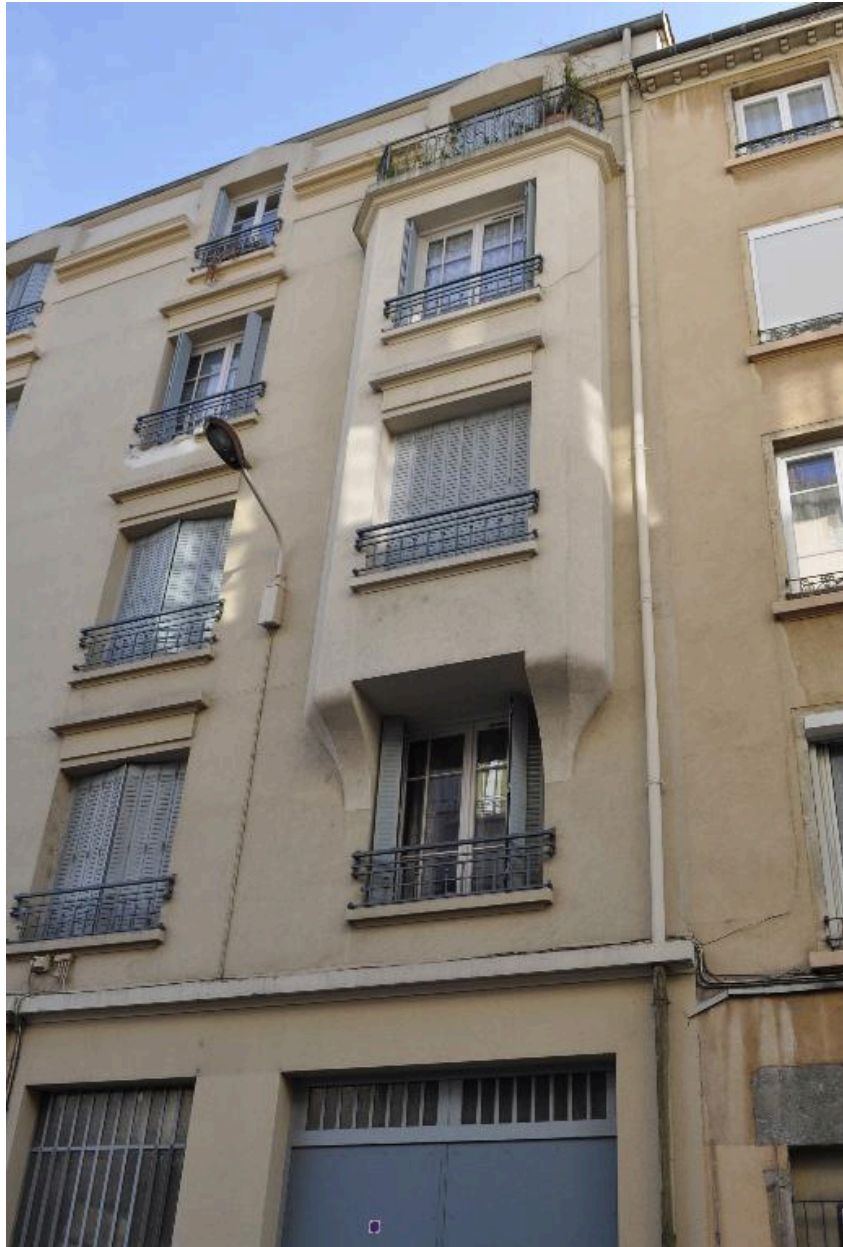
Détail d'une travée latérale avec bow-window