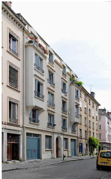
Vue d'ensemble, élévation sur rue IVR84_20176900529NUCA