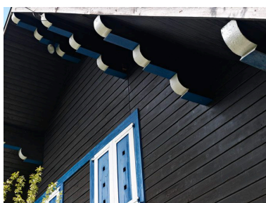
Détail des corbeaux d'avant- toit de la façade sud