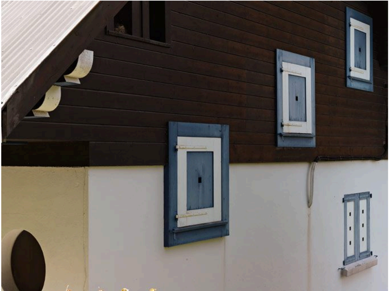
Détail des baies de la façade nord