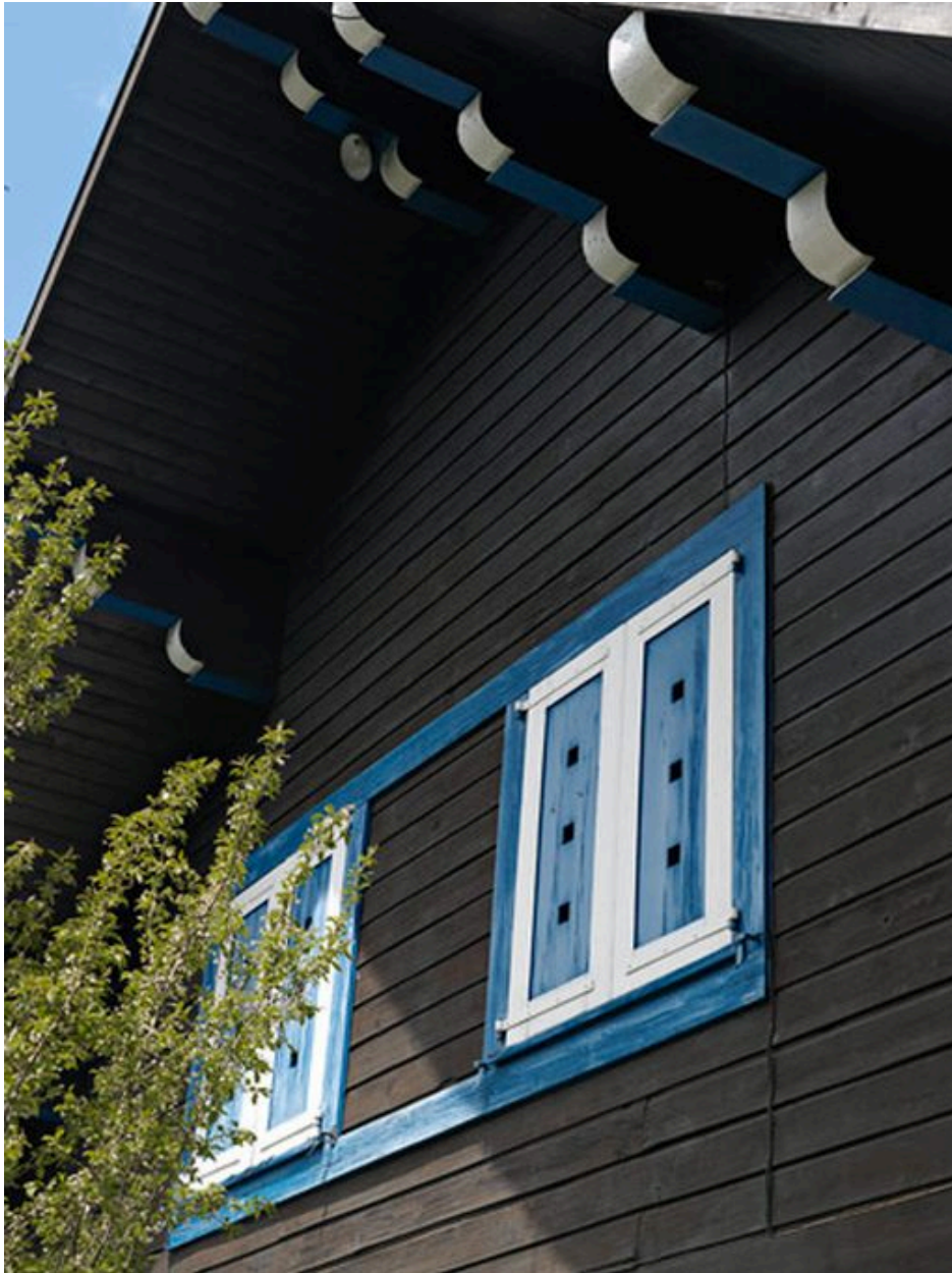
Détail des baies de la façade sud