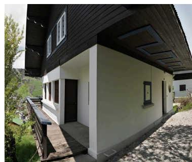
Vue d'ensemble du balcon le long de la façade sud IVR82_20117400107NUCA