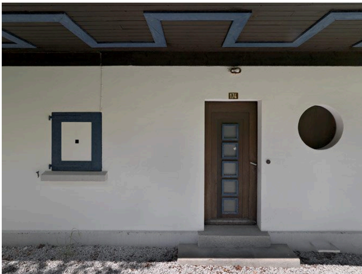
Entrée du chalet sous l'avant-toit de la façade latérale