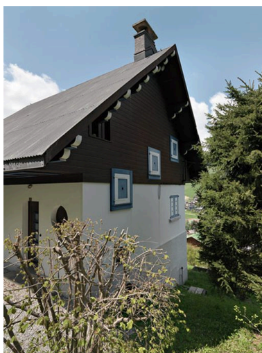
Vue depuis le nord-est