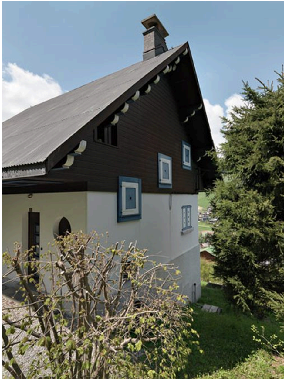
Vue depuis le nord-est