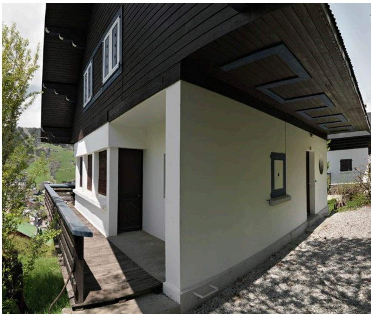
Vue d'ensemble du balcon le long de la façade sud