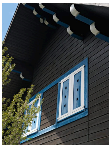
Détail des baies de la façade sud IVR82_20107401303NUCA