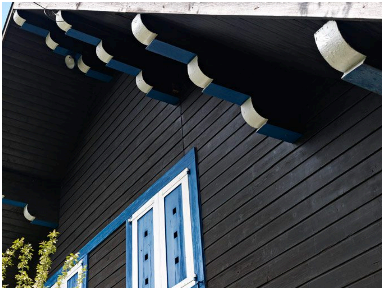
Détail des corbeaux d'avant-toit de la façade sud