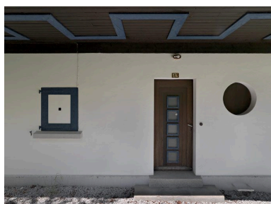
Entrée du chalet sous l'avant- toit de la façade latérale IVR82_20107401297NUCA