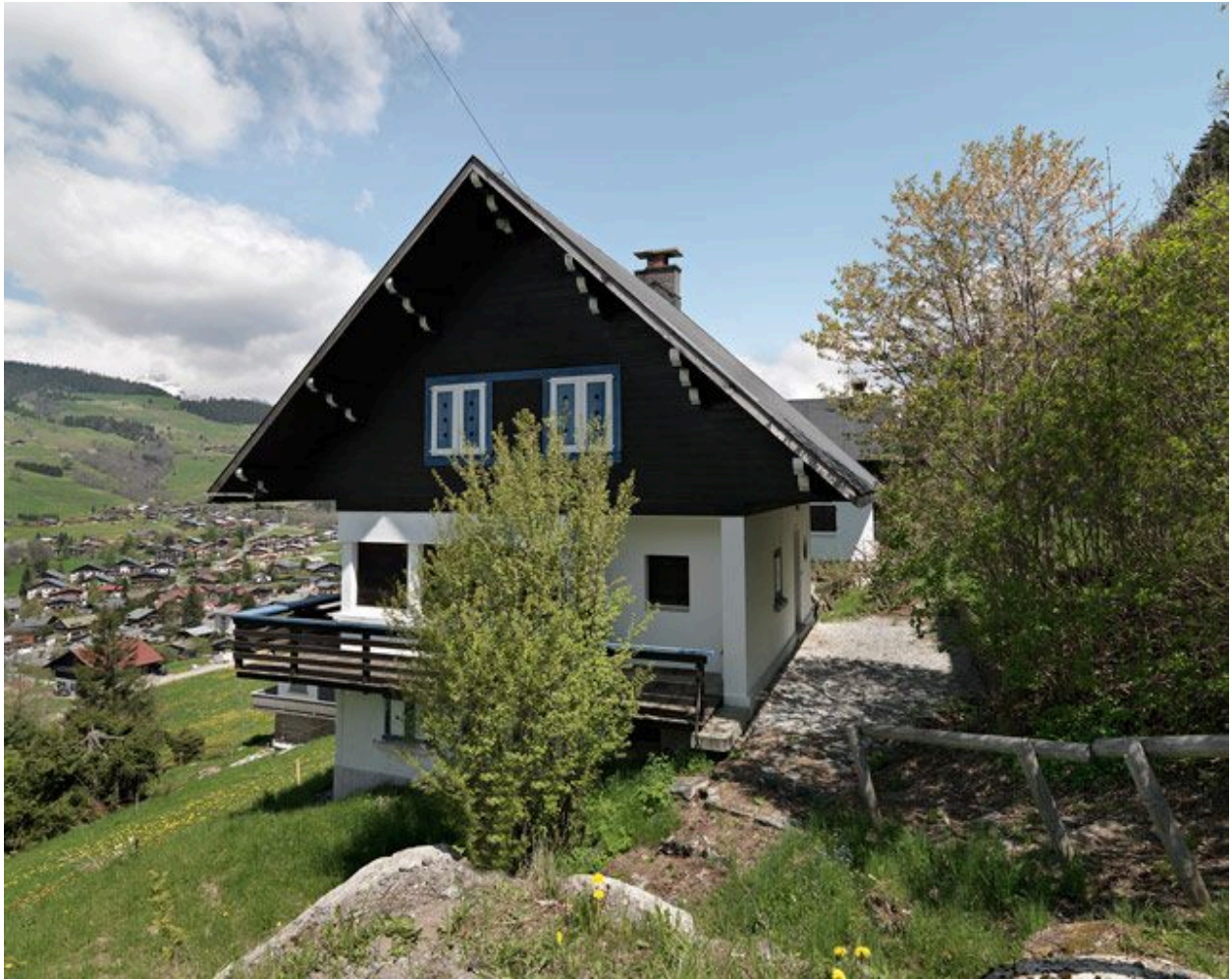
Vue générale depuis le sud-est