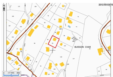
Plan de situation, extrait du plan cadastral 2012 IVR82_20127403019NUDA