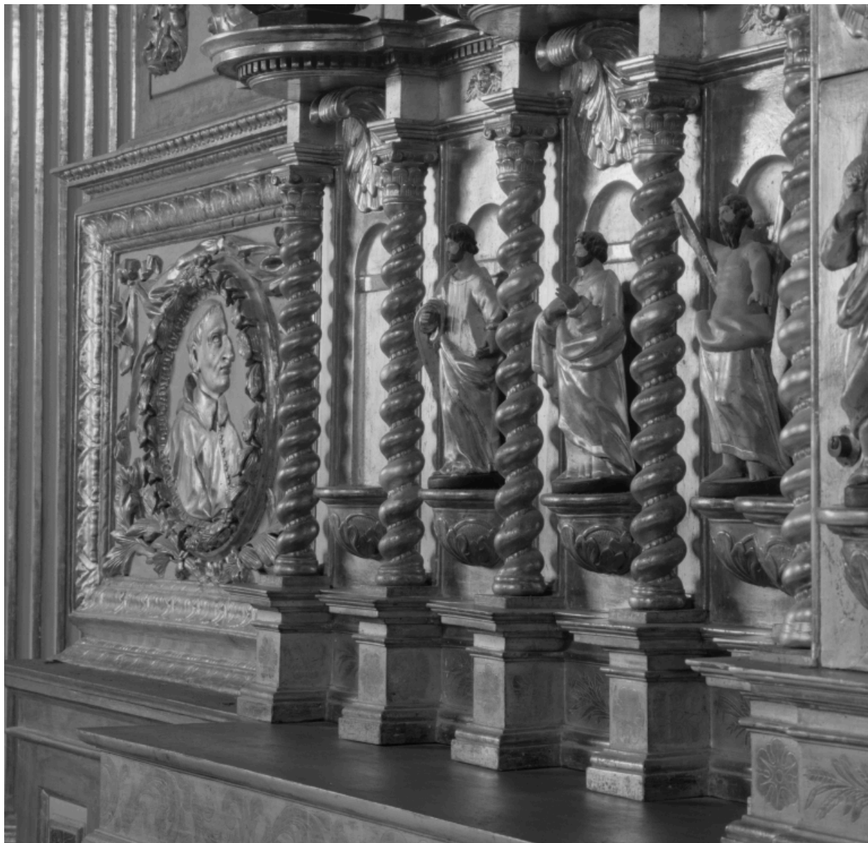
Détail, aile gauche.