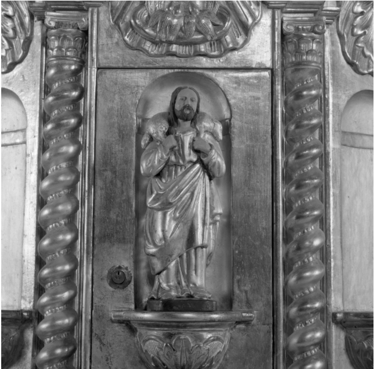
Porte du tabernacle, détail, statuette : le Bon Pasteur.