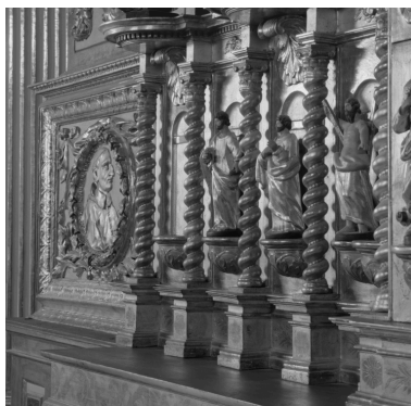
Détail, aile gauche. IVR82_20002601039X