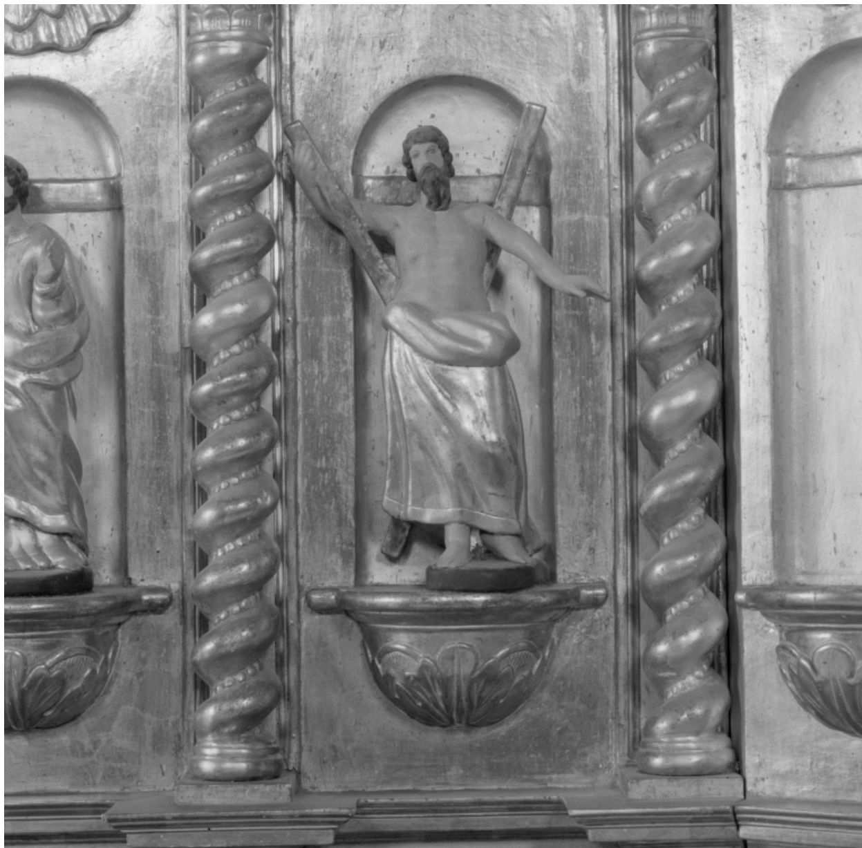
Détail aile gauche, statuette : saint André.