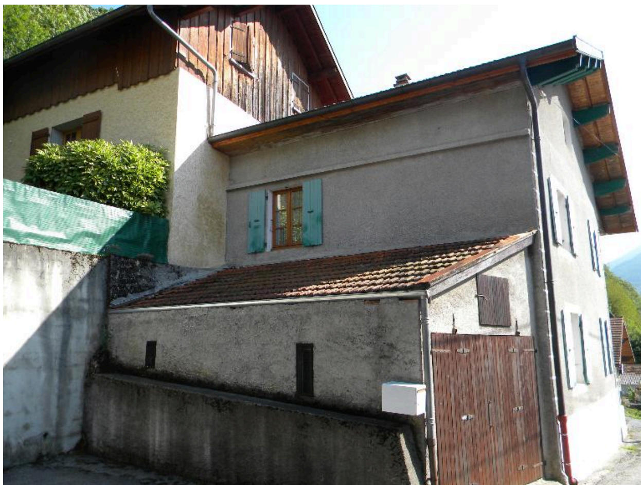
Façade nord d'une maison remaniée (2008 D14 2157).