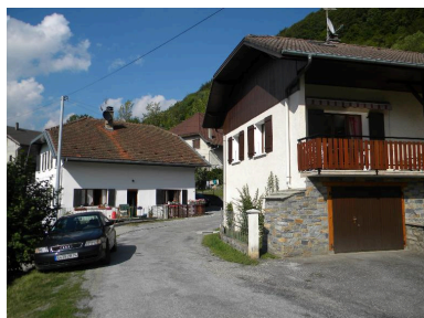
Vue du coeur du hameau. IVR82_20137401142NUCA