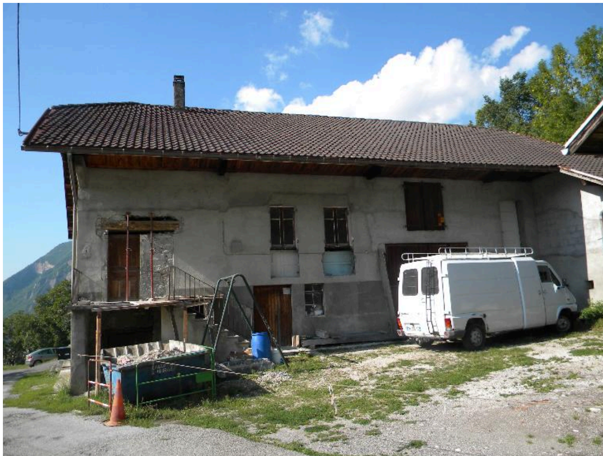
Vue de la façade principale d'une ancienne ferme au nord du hameau.