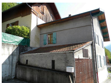
Façade nord d'une maison remaniée (2008 D14 2157).