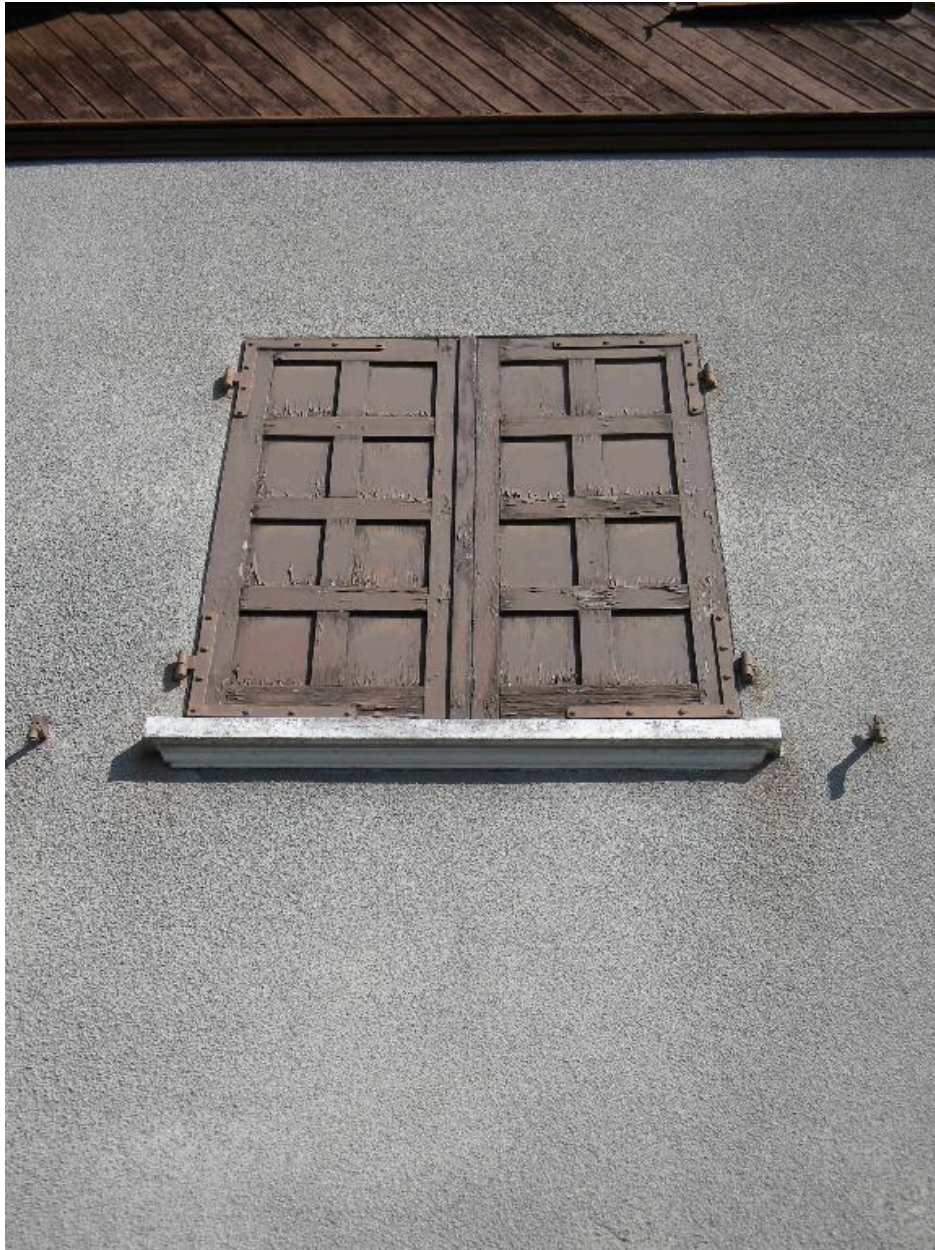
Détail d'une tablette moulurée en béton sur un encadrement de fenêtre (2008 D14 2159).