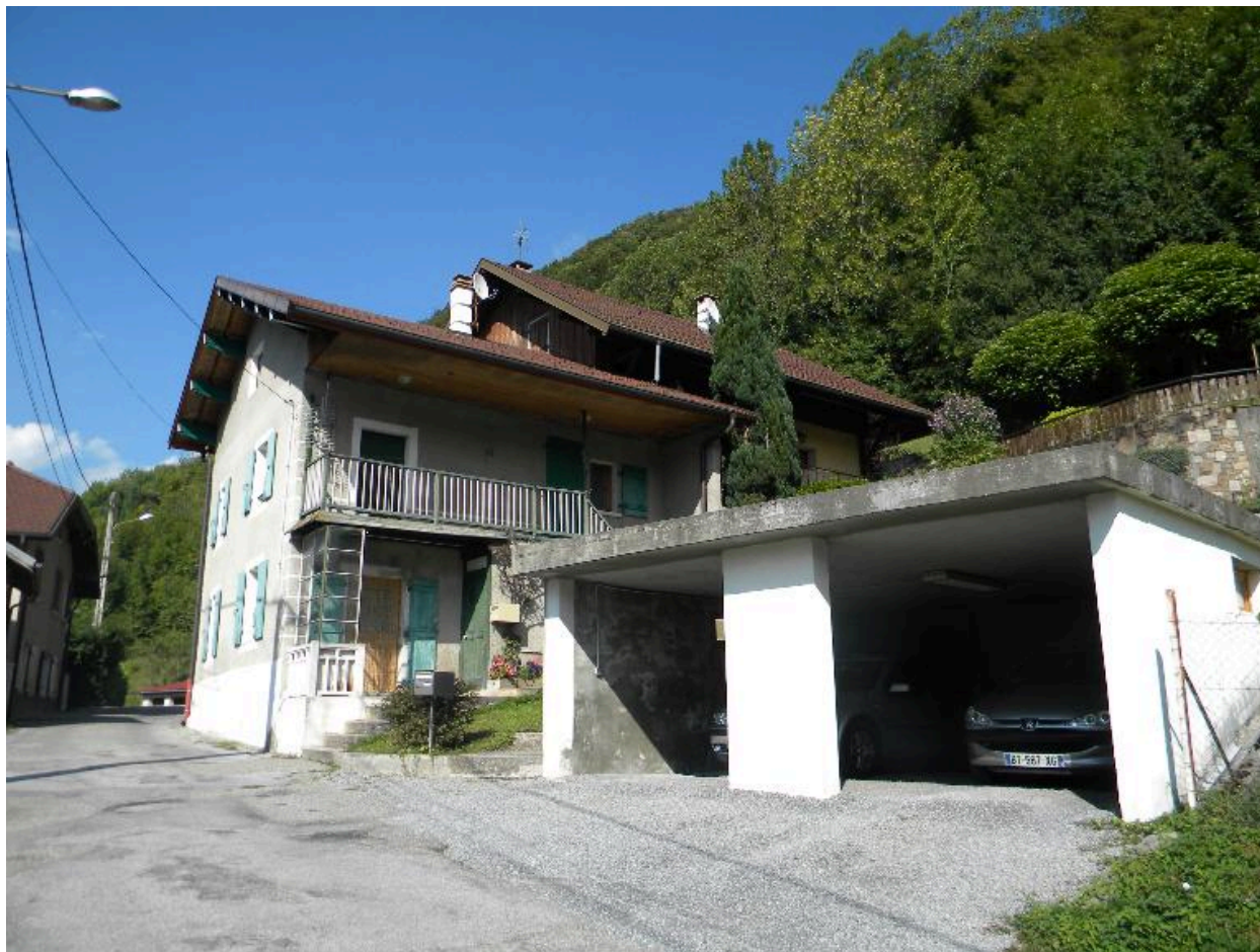
Vue d'une maison remaniée à l'entrée du hameau (2008 D14 2157).