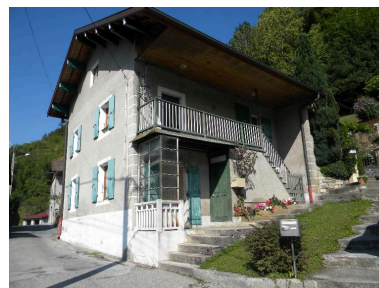
Vue d'une maison remaniée avec chainages figurés (2008 D14 2157).