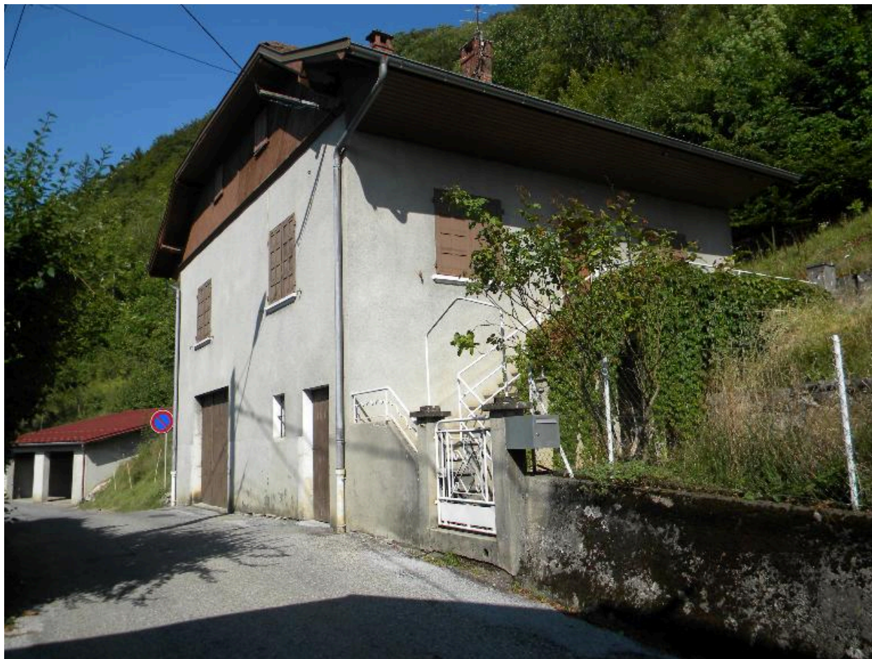
Vue d'une maison reprise au ciment avec tablettes moulurées sous les fenêtres (2008 D14 2159)