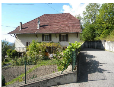
Vue d'une maison remaniée (2008 D14 2163) IVR82_20137401149NUCA