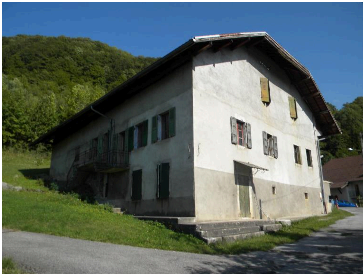
Vue d'ensemble d'une ancienne ferme au nord du hameau (2008 D14 2169).