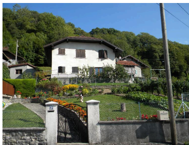
Jardins en contrebas d'anciennes fermes modifiées.

IVR82_20137401151NUCA