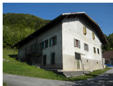
Vue d'ensemble d'une ancienne ferme au nord du hameau (2008 D14 2169). IVR82_20137401150NUCA