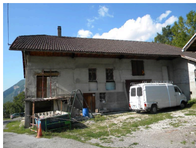
Vue de la façade principale d'une ancienne ferme au nord du hameau.

IVR82_20137401151NUCA