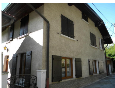
Maison entièrement reprise (2008 D14 2144).