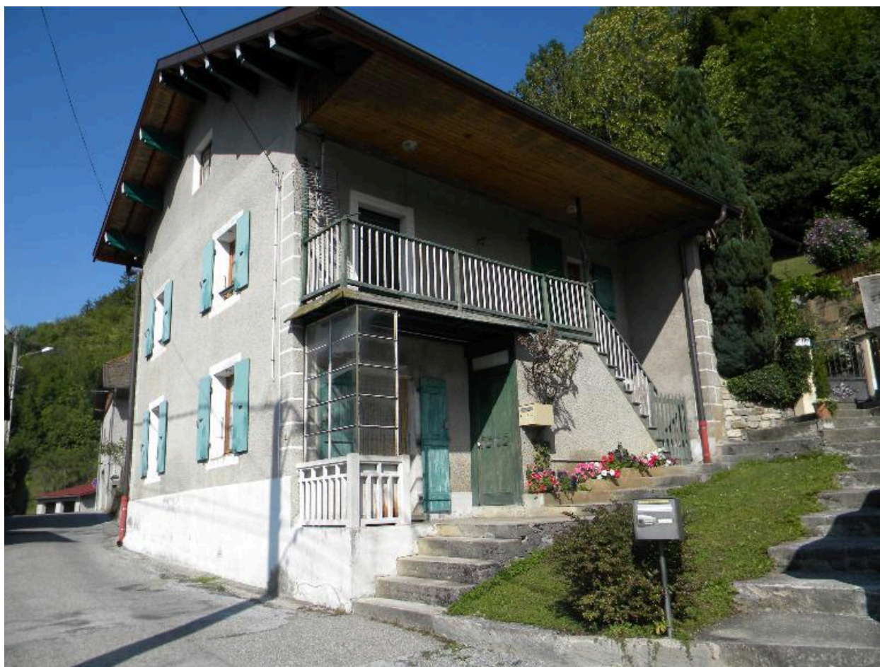
Vue d'une maison remaniée avec chainages figurés (2008 D14 2157).