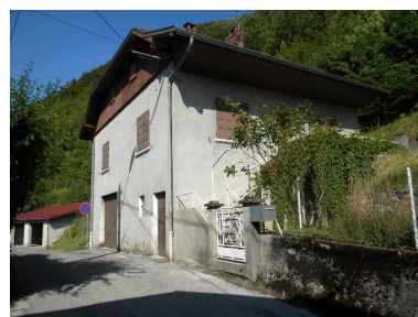
Vue d'une maison reprise au ciment avec tablettes moulurées sous les fenêtres (2008 D14 2159) IVR82_20137401147NUCA