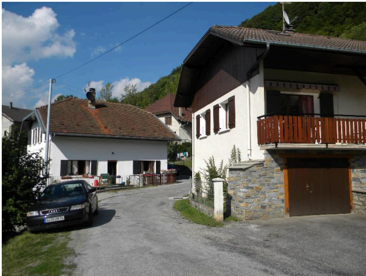
Vue du coeur du hameau.