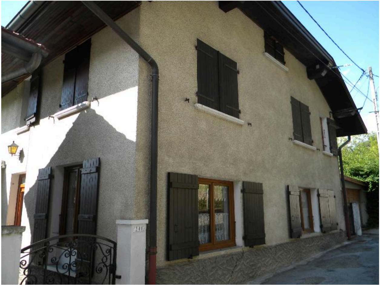
Maison entièrement reprise (2008 D14 2144).