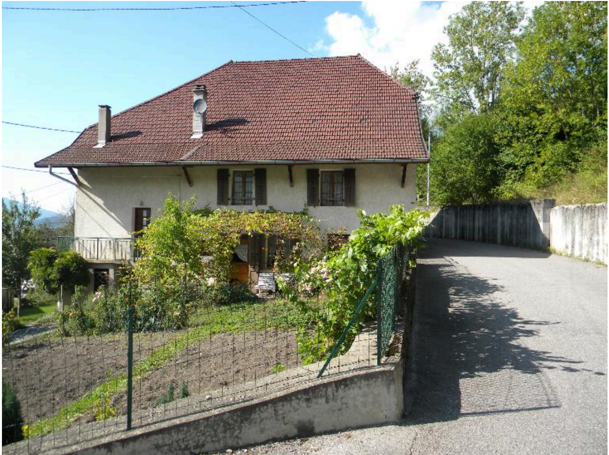
Vue d'une maison remaniée (2008 D14 2163)