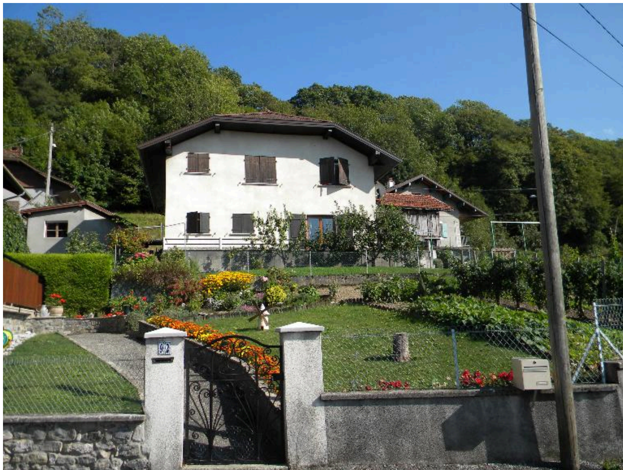
Jardins en contrebas d'anciennes fermes modifiées.