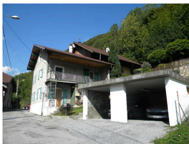
Vue d'une maison remaniée à l'entrée du hameau (2008 D14 2157). IVR82_20137401143NUCA