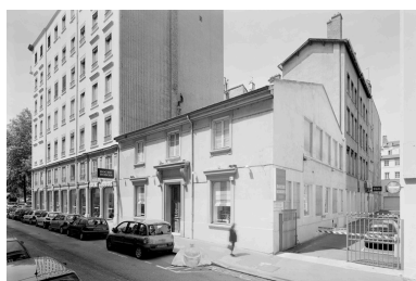
Vue d'ensemble