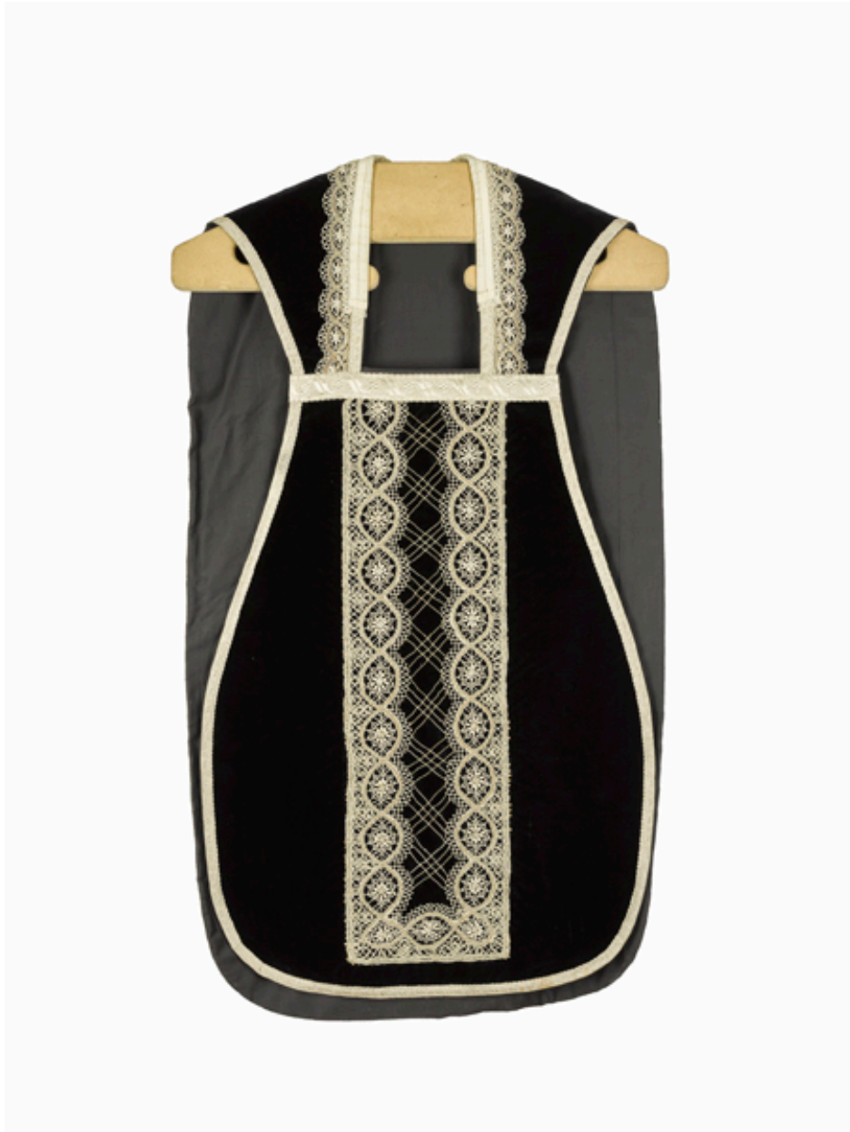
Vue du devant de la chasuble