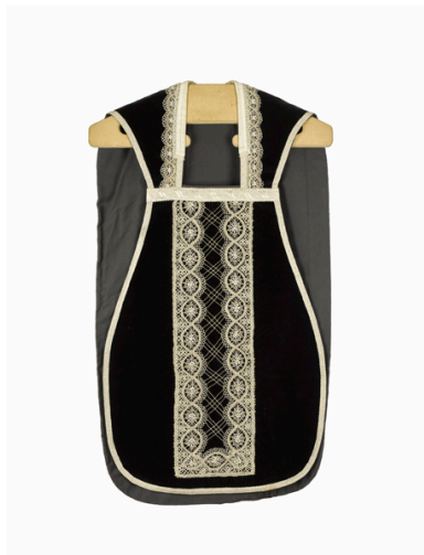
Vue du devant de la chasuble IVR84_20184300108NUC4A