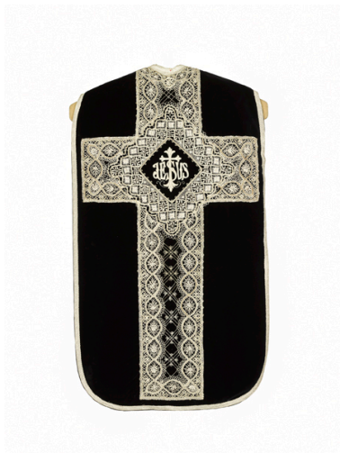
Vue du dos de la chasuble IVR84_20184300110NUC4A