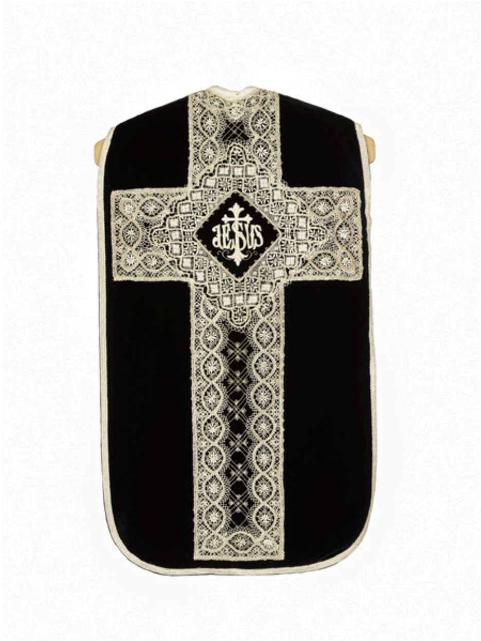
Vue du dos de la chasuble