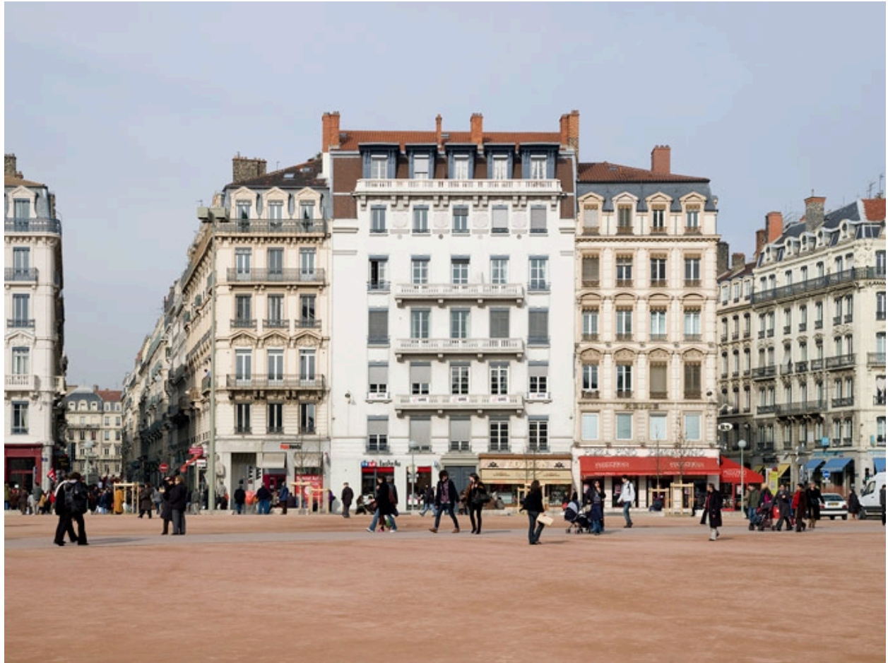
Vue de situation, en 2009