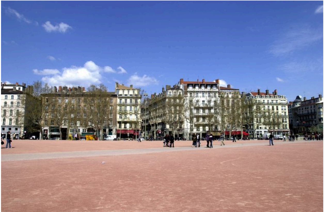
Vue de situation depuis la place Bellecour