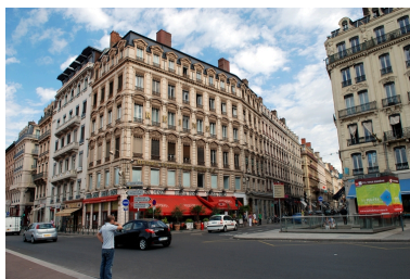
Vue d'ensemble IVR82_20096904976NUCA