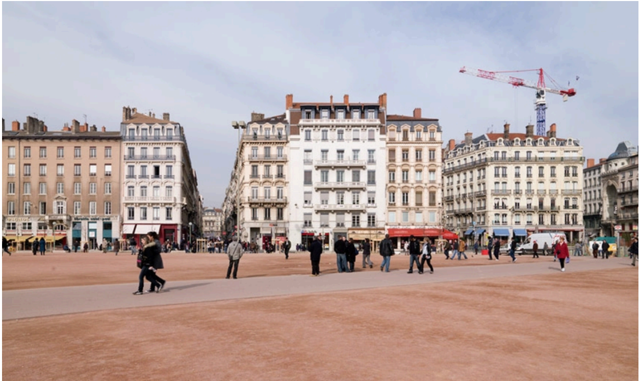
Vue de situation, en 2009, après la coupe des platanes et la plantation de jeunes chênes chevelus