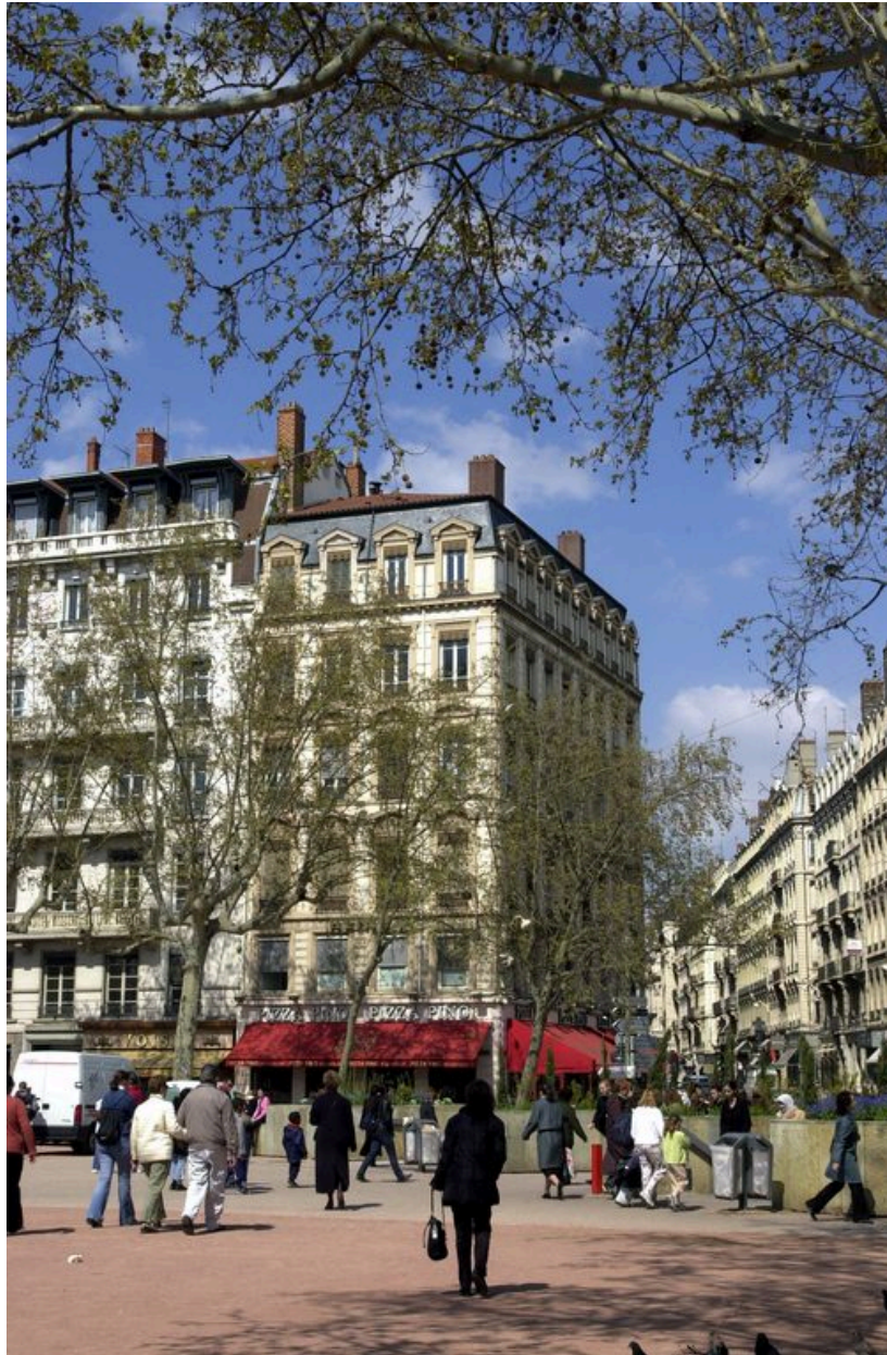
Vue générale depuis la place Bellecour