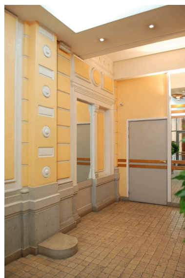
L'allée avec une porte et une fenêtre condamnée, ancienne loge de concierge ?