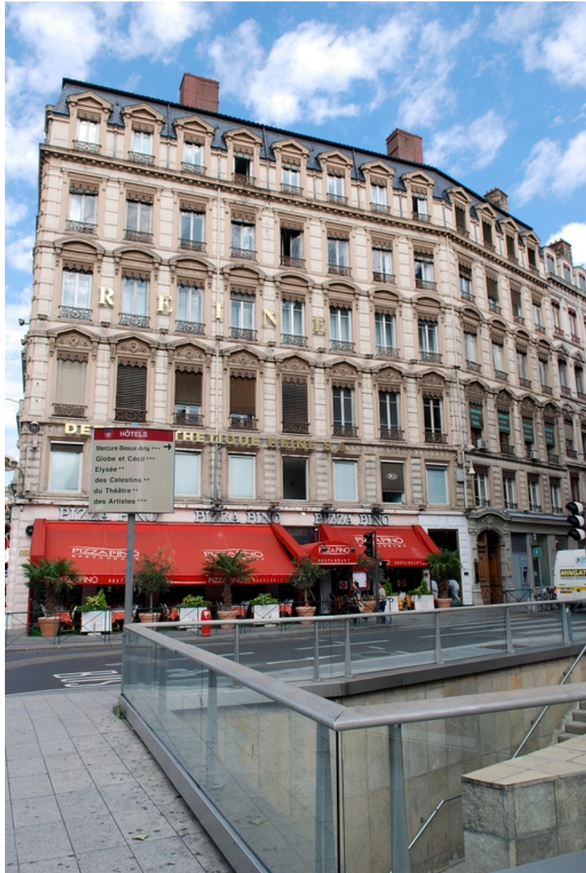
Elévations place Le Viste et rue du Président-Edouard-Herriot