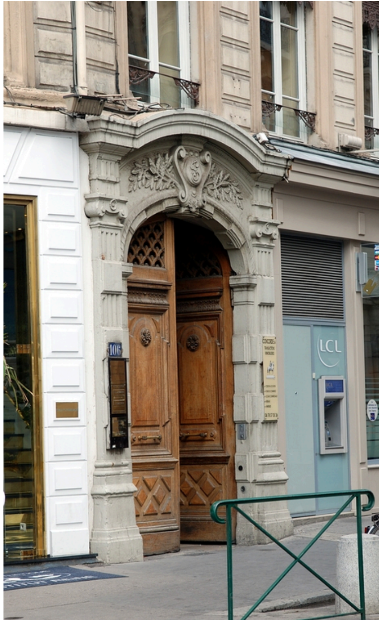
Elévation rue du Président-Edouard-Herriot : la porte