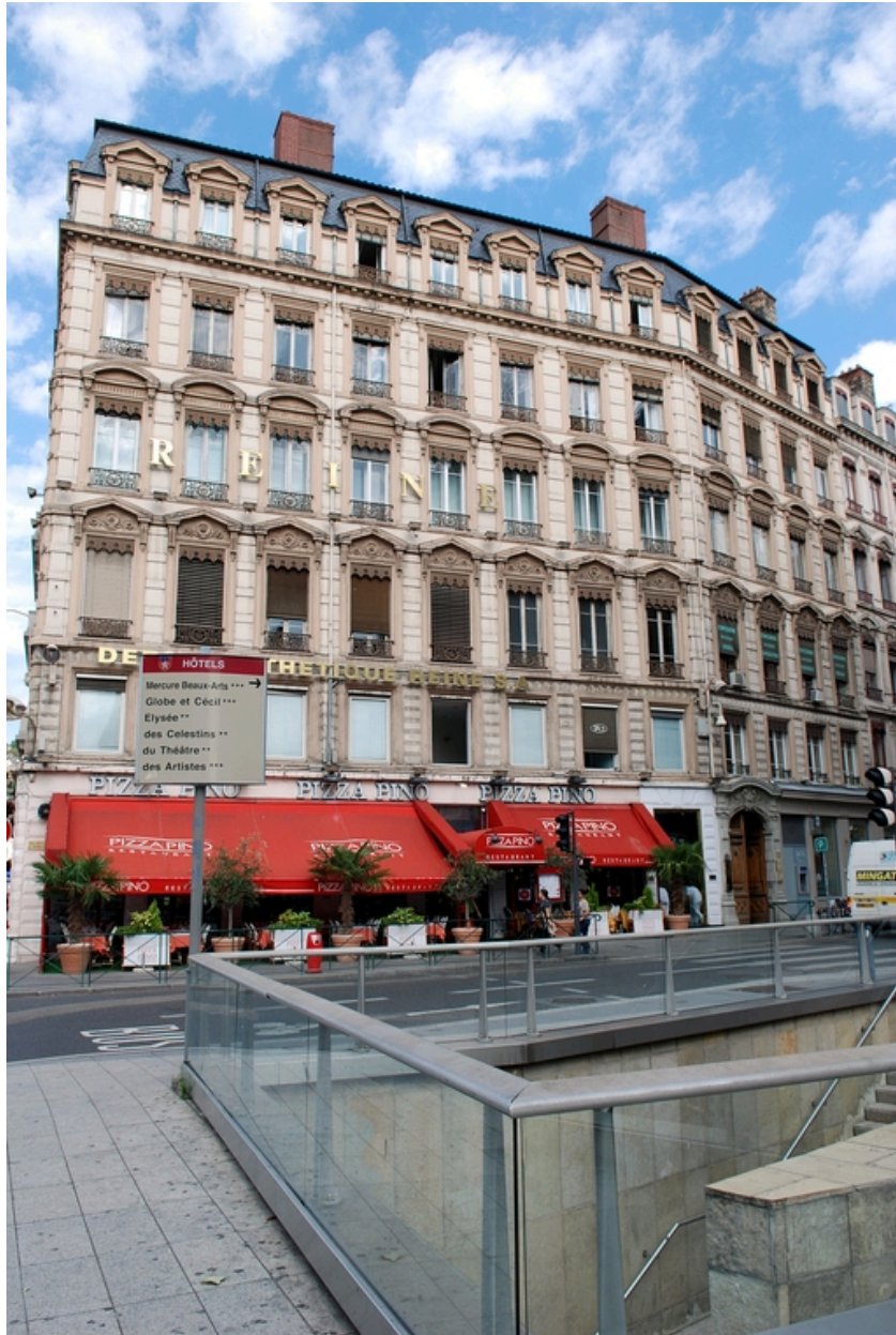
Elévations place Le Viste et rue du Président-Edouard-Herriot