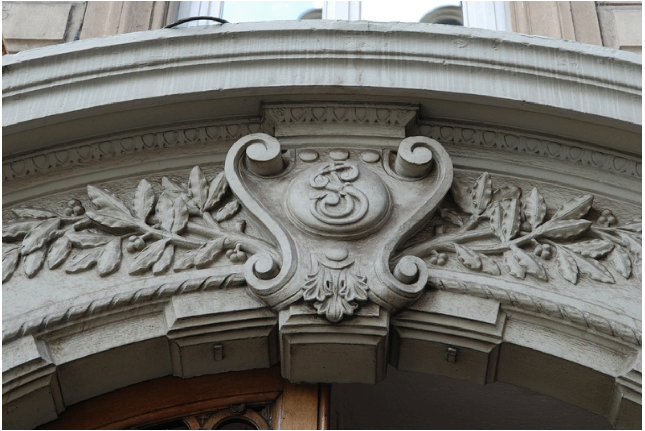
Elévation rue du Président-Edouard-Herriot : la porte, détail du fronton cintré