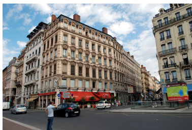
Vue d'ensemble IVR82_20096904976NUCA