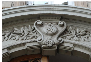
Elévation rue du Président- Edouard-Herriot : la porte, détail du fronton cintré IVR82_20096904979NUCA