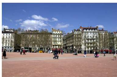
Vue de situation depuis la place Bellecour