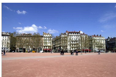
Vue de situation depuis la place Bellecour