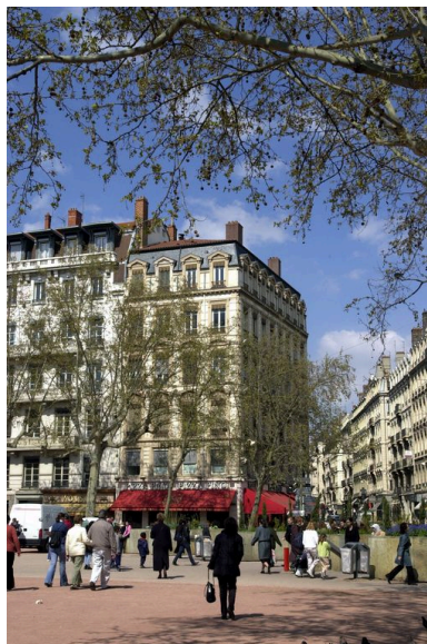
Vue générale depuis la place Bellecour