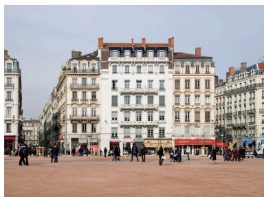
Vue de situation, en 2009