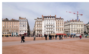
Vue de situation, en 2009, après la coupe des platanes et la plantation de jeunes chênes chevelus