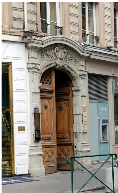
Elévation rue du Président- Edouard-Herriot : la porte