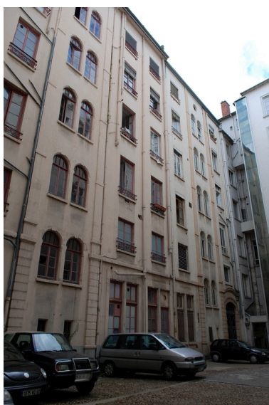
Elévation sur cour IVR82_20096904980NUCA