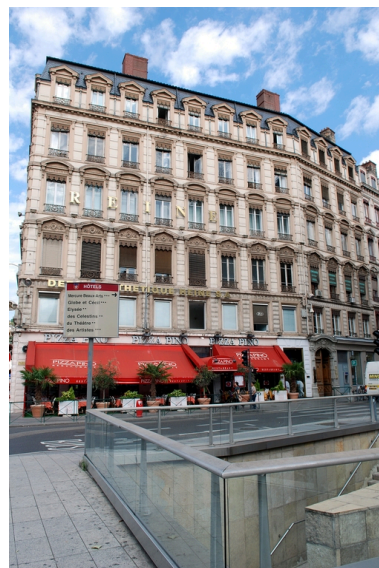
Elévations place Le Viste et rue du Président-Edouard-Herriot IVR82_20096904977NUCA