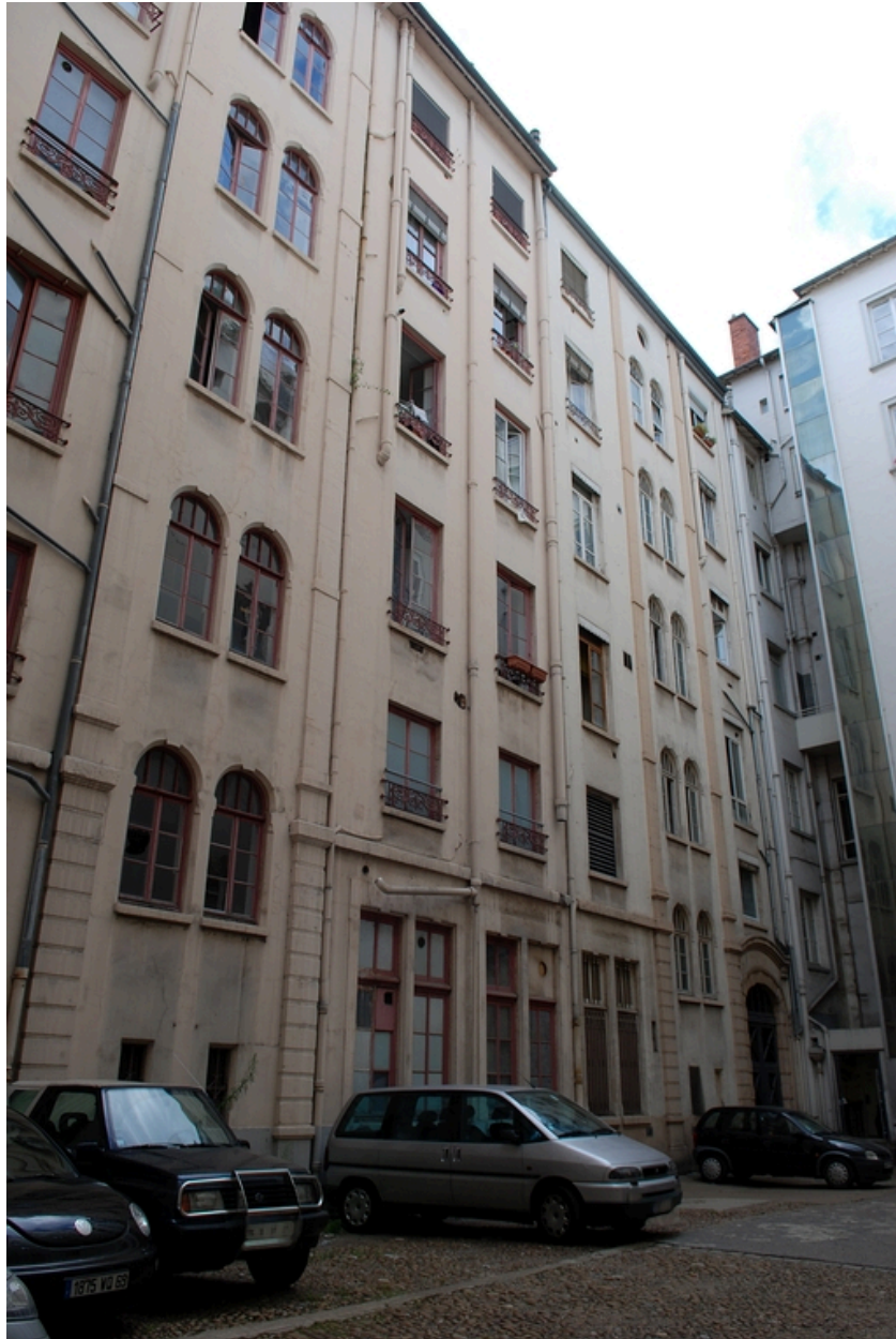
Elévation sur cour