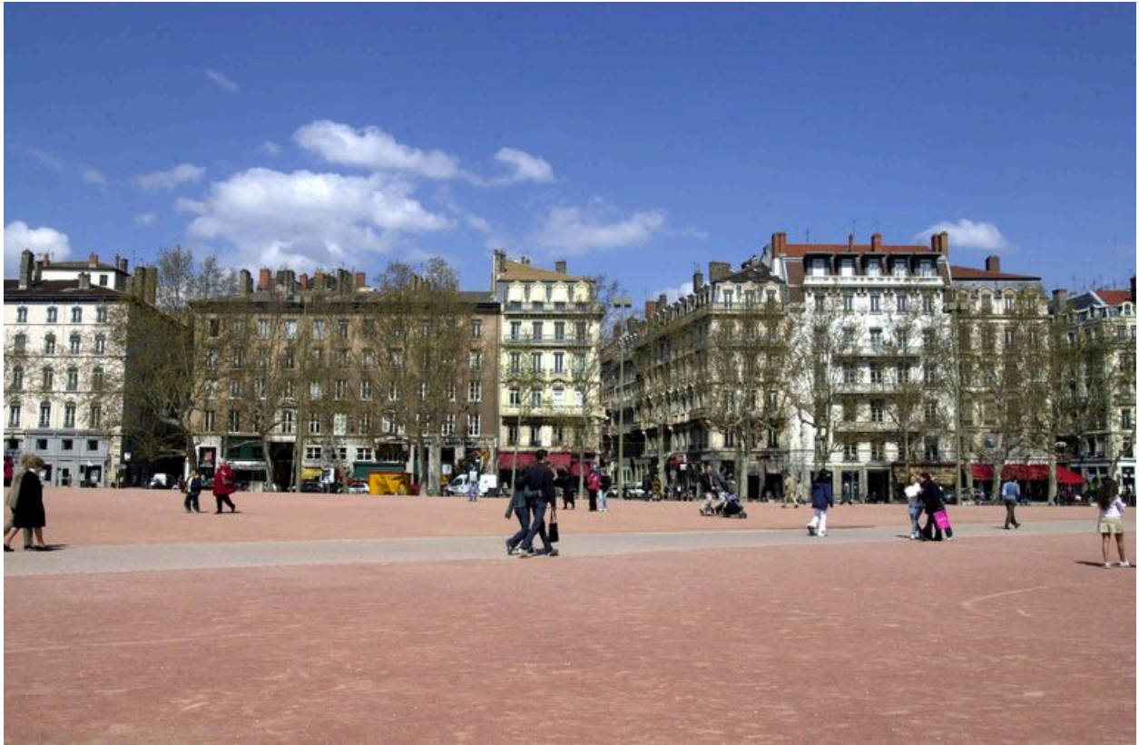
Vue de situation depuis la place Bellecour