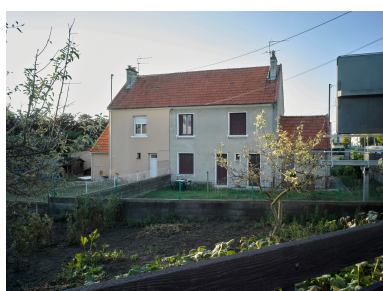
Habitation double de la petite unité de logements ouvriers des "Sports", boulevard Étienne-Clémentel. IVR84_20196300356NUC4A