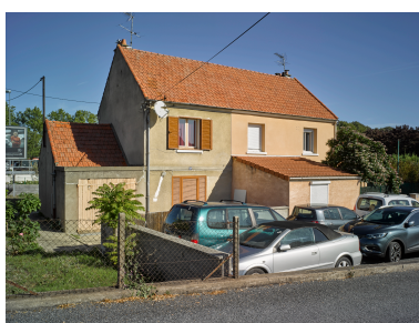
Maison double de la cité des "Sports", boulevard Étienne-Clémentel.