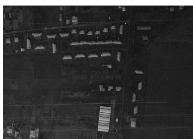
Vue aérienne de la cité, le 17/12/1956.