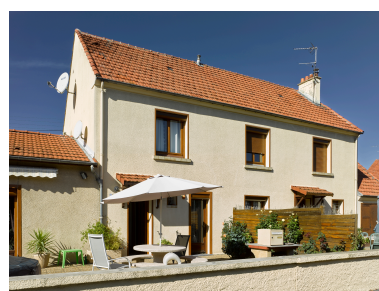
Habitation double de la petite unité de logements ouvriers des "Sports", boulevard Étienne-Clémentel. IVR84_20196300355NUC4A