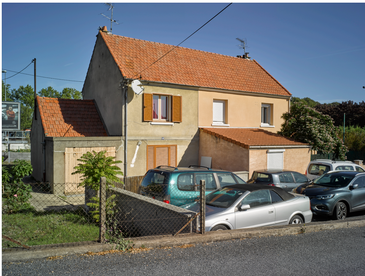
Maison double de la cité des "Sports", boulevard Étienne-Clémentel.