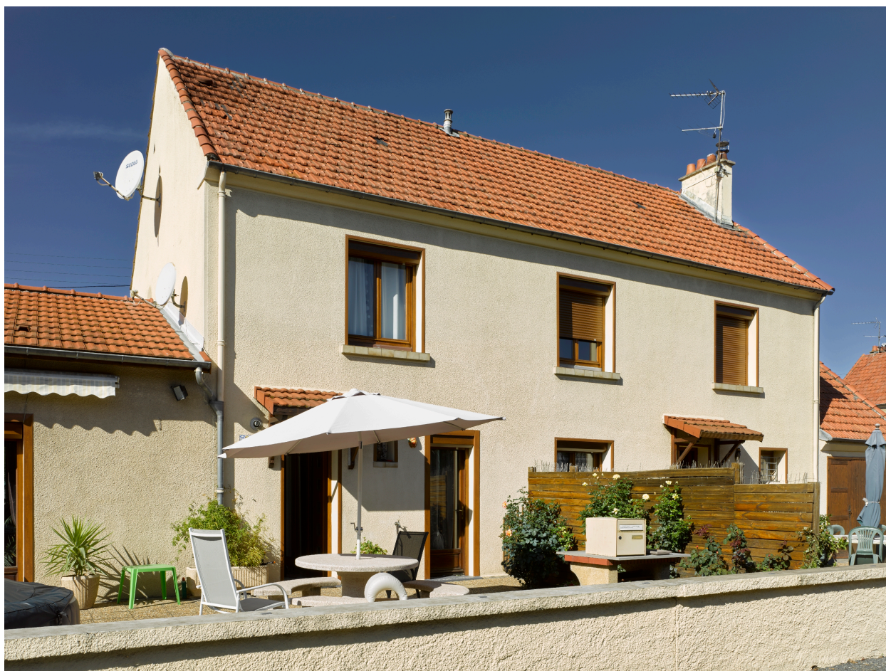
Habitation double de la petite unité de logements ouvriers des "Sports", boulevard Étienne-Clémentel.