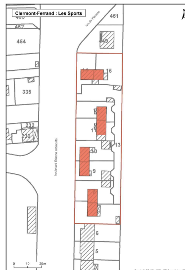
Plan des différents bâtiments d'origine de la cité (partie est : "les Sports"). IVR84_20216301275NUDA