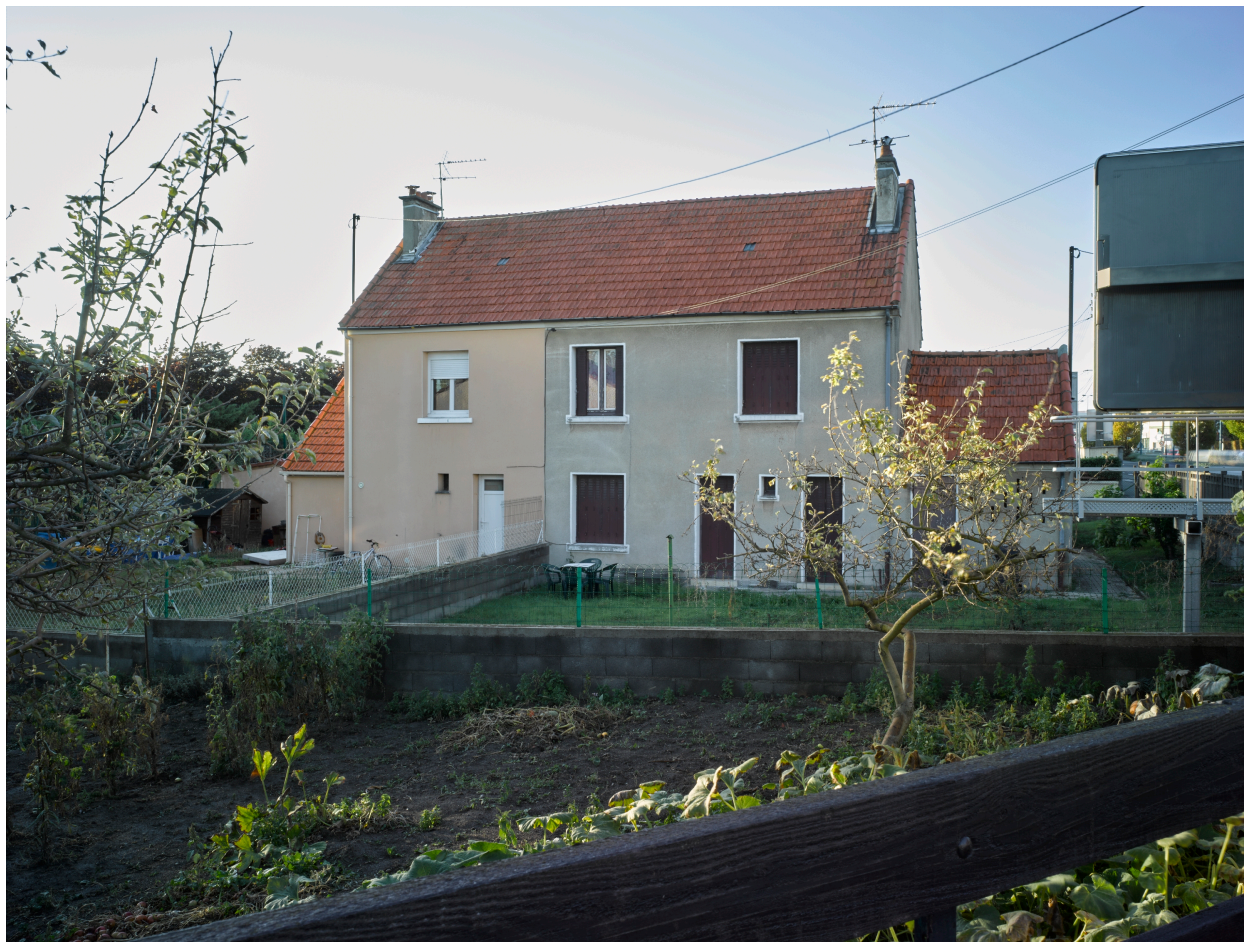
Habitation double de la petite unité de logements ouvriers des "Sports", boulevard Étienne-Clémentel.