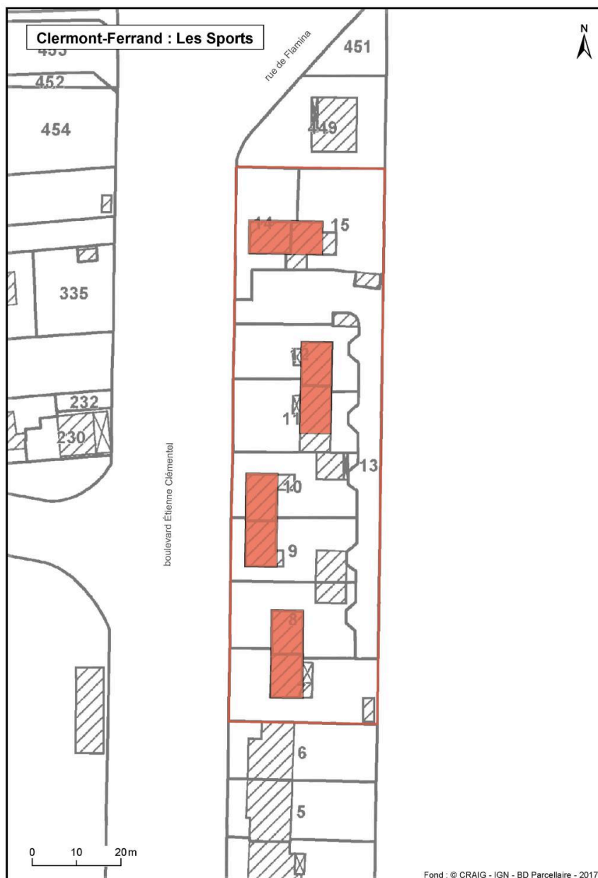
Plan des différents bâtiments d'origine de la cité (partie est : "les Sports").