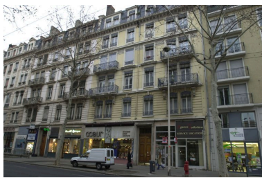
Vue d'ensemble des 15-17 avenue Jean-Jaurès IVR82_20046904379NUCA