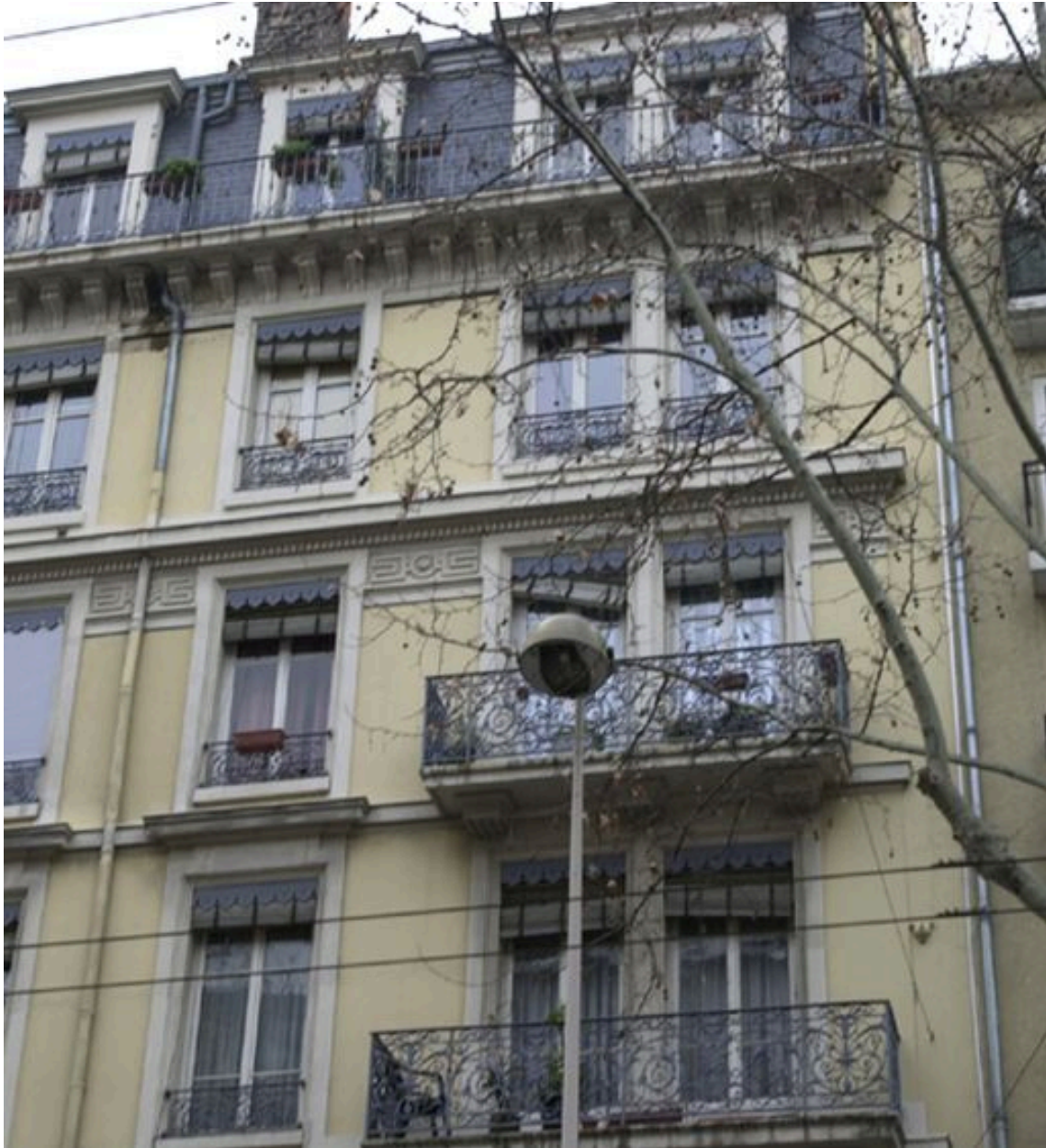
Détail de façade, 17 avenue Jean-Jaurès