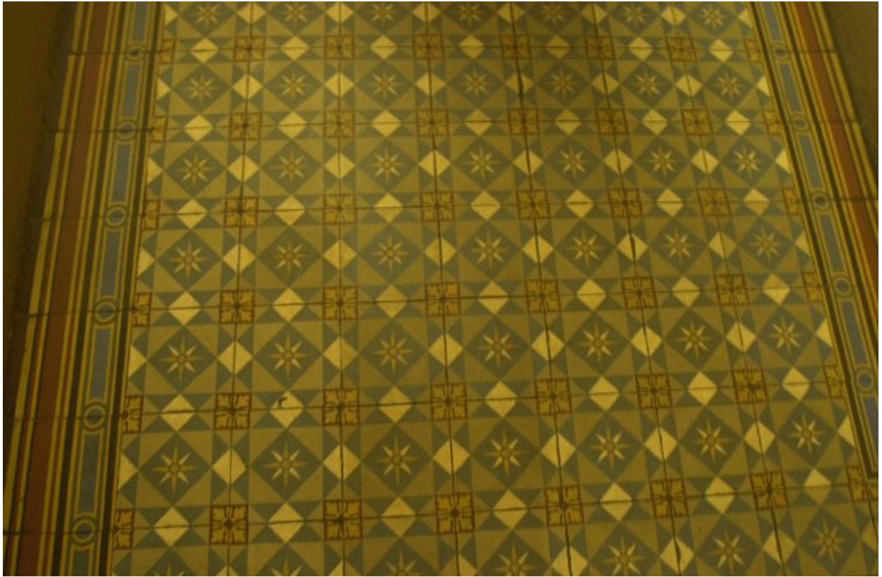
Détail du carrelage du vestibule, 17 avenue Jean-Jaurès