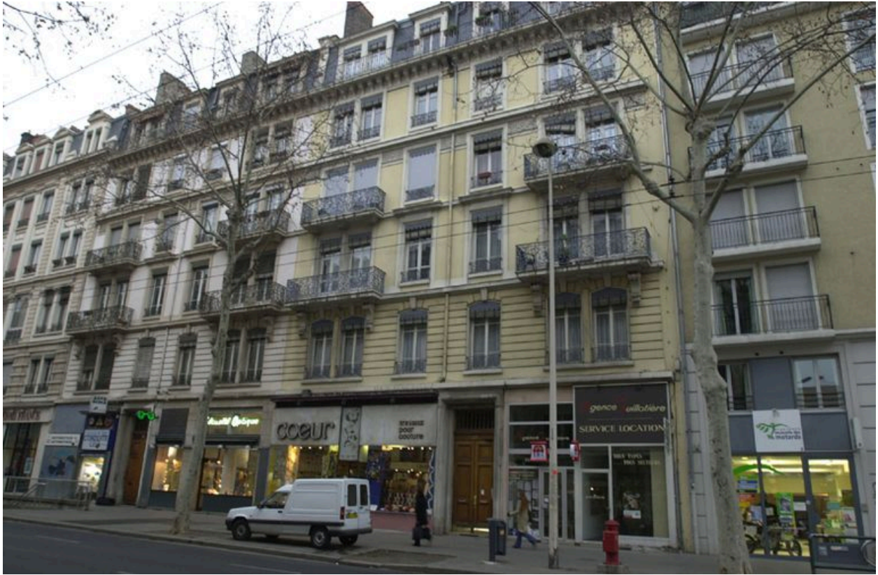
Vue d'ensemble des 15-17 avenue Jean-Jaurès