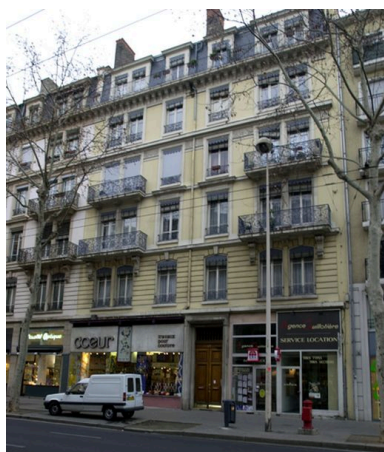
Façade, 17 avenue Jean-Jaurès