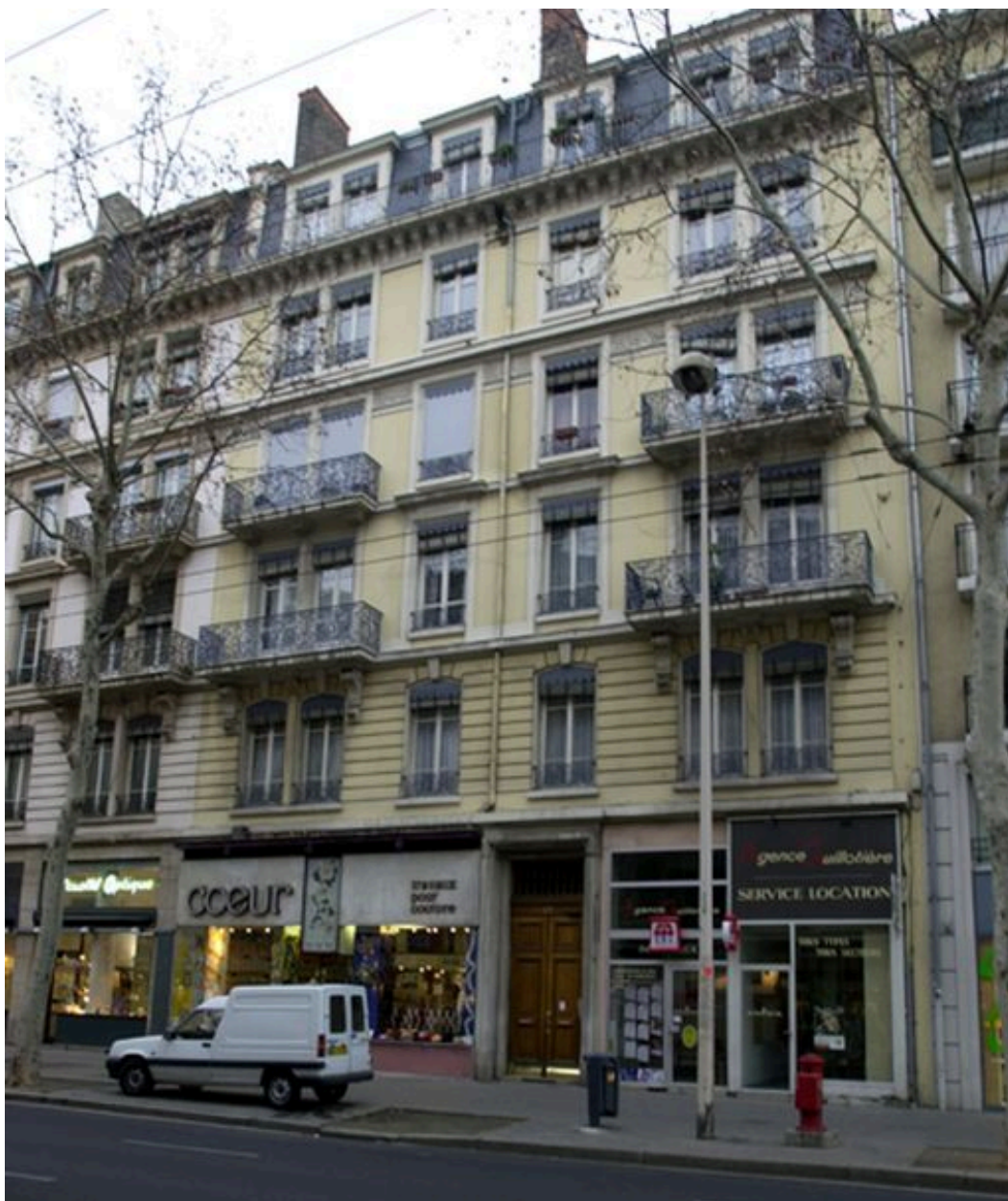
Façade, 17 avenue Jean-Jaurès