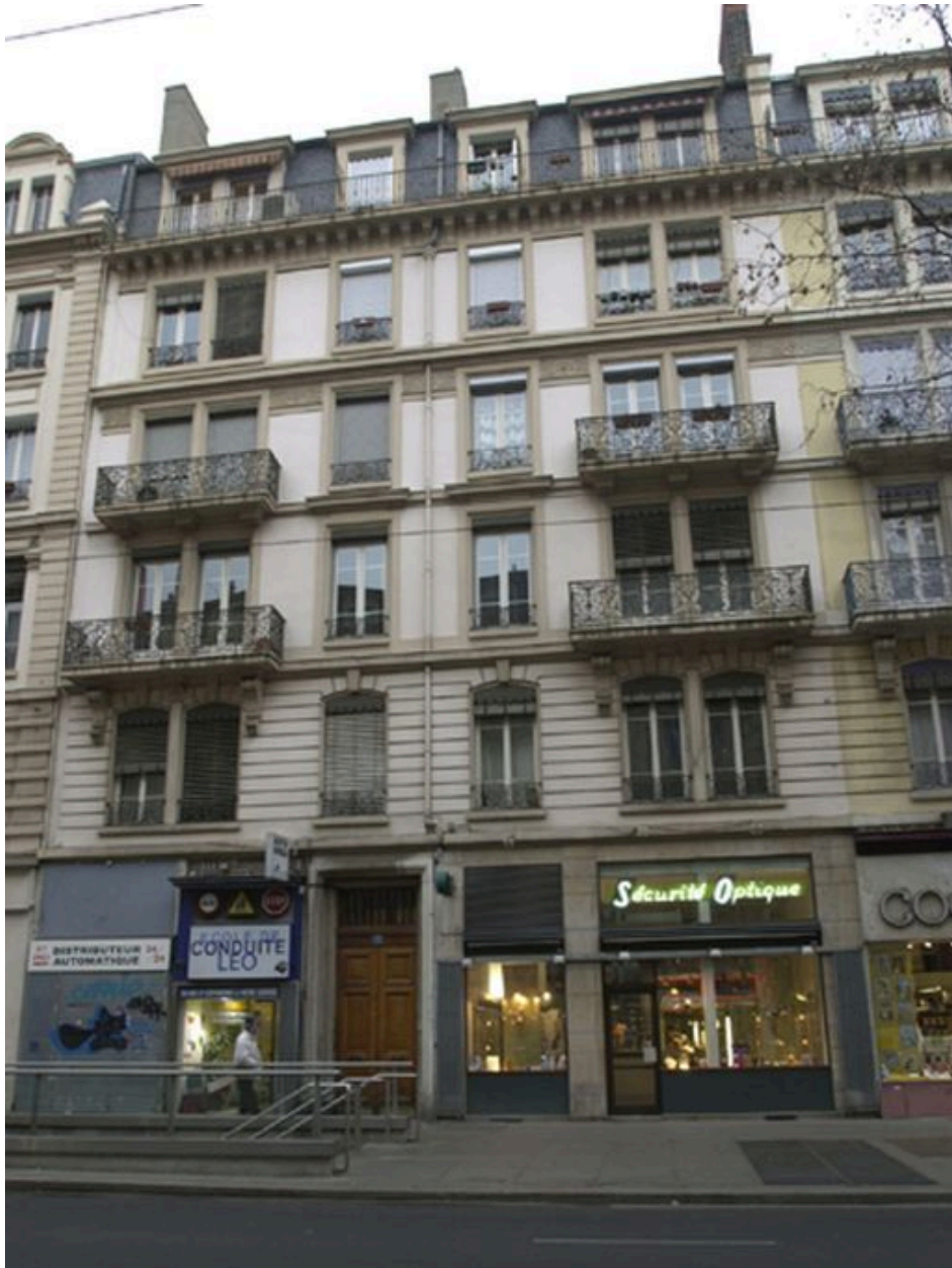
Façade, 15 avenue Jean-Jaurès