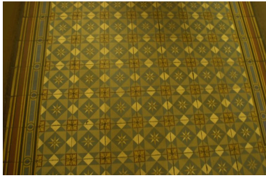
Détail du carrelage du vestibule, 17 avenue Jean-Jaurès IVR82_20046904383NUCA

IVR82_20046904382NUCA