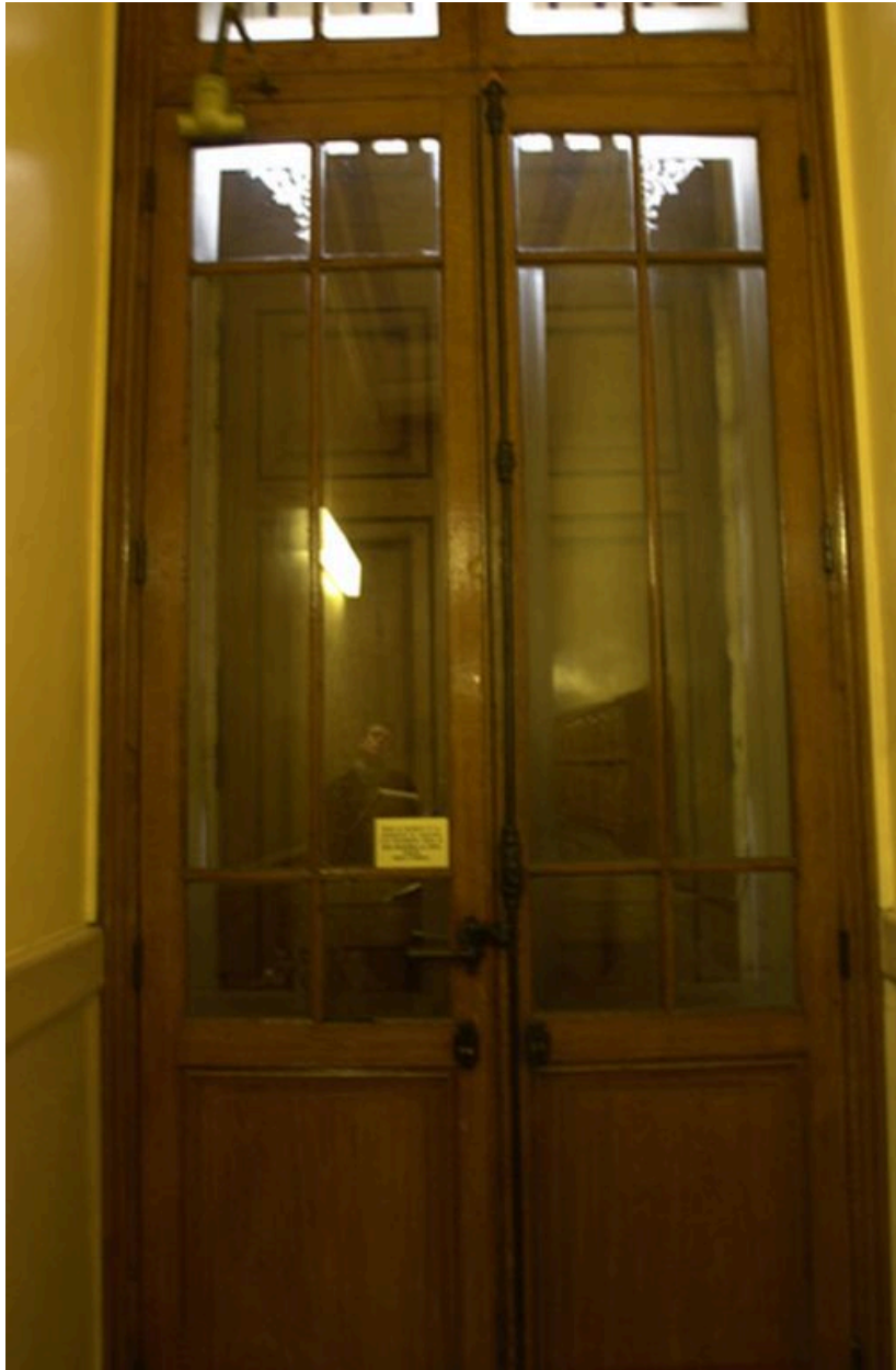
Vue de la porte intérieure du vestibule, 17 avenue Jean-Jaurès