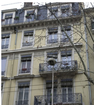
Détail de façade, 17 avenue Jean-Jaurès IVR82_20046904381NUCA