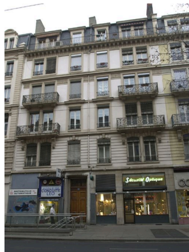
Façade, 15 avenue Jean-Jaurès IVR82_20046904380NUCA