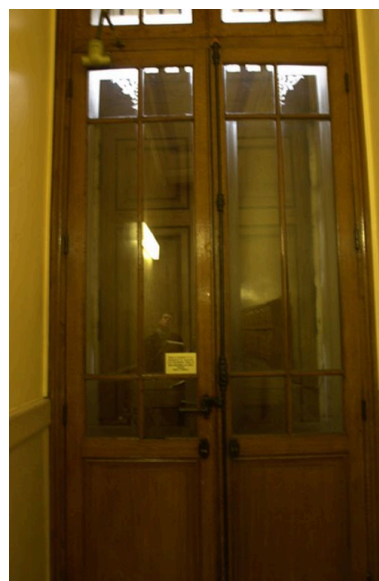
Vue de la porte intérieure du vestibule, 17 avenue Jean-Jaurès