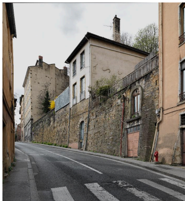
Vue de situation : l'immeuble est à l'arrière-plan