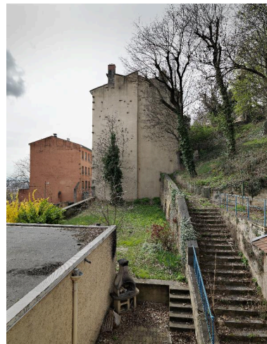
Le pignon nord depuis le jardin de la maison élevée 6 montée du Chemin-Neuf IVR84_20176900480NUCA