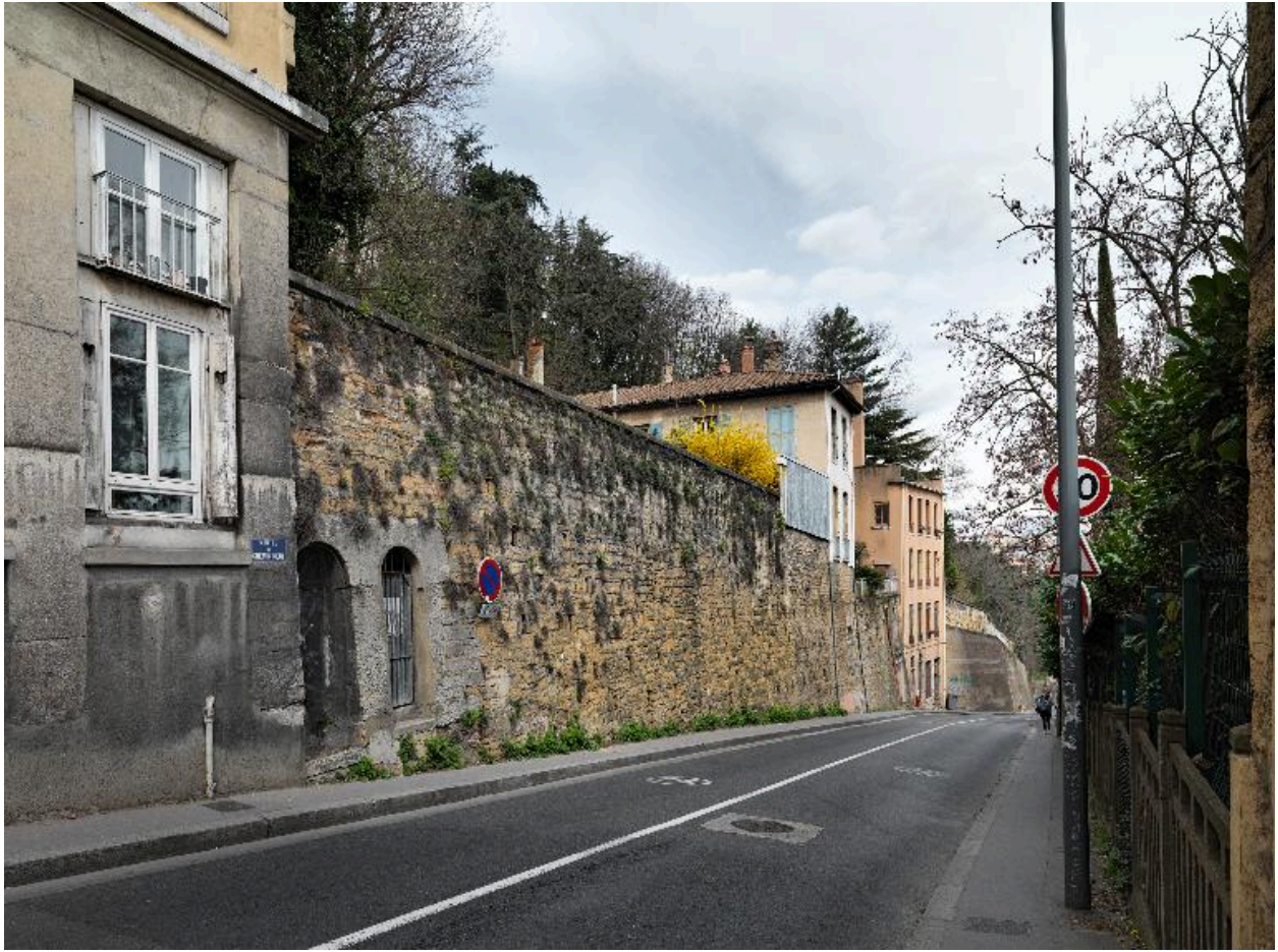
A gauche de l'image, baie de la travée droite de l'immeuble, rez-de-chaussée