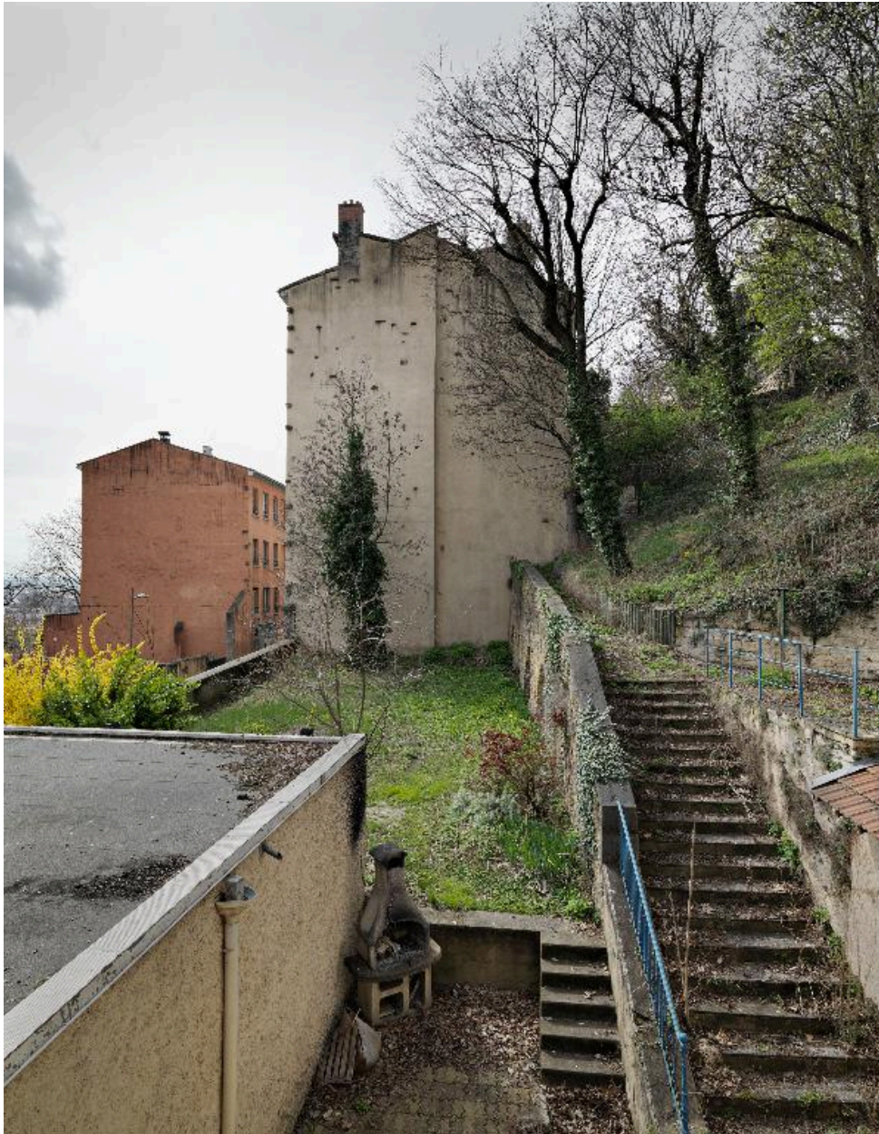
Le pignon nord depuis le jardin de la maison élevée 6 montée du Chemin-Neuf