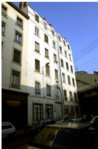
Vue générale IVR82_20016900331NUCA