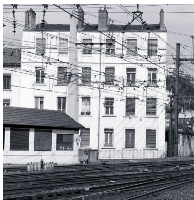
Elévation depuis la voie ferrée