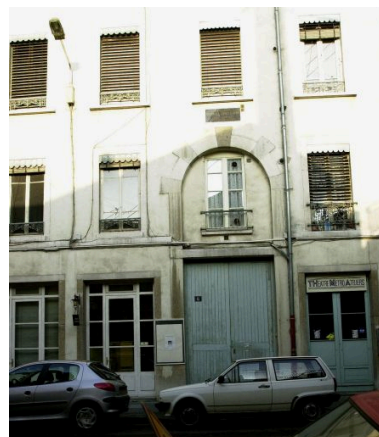
Détail de l'entrée IVR82_20016900332NUCA