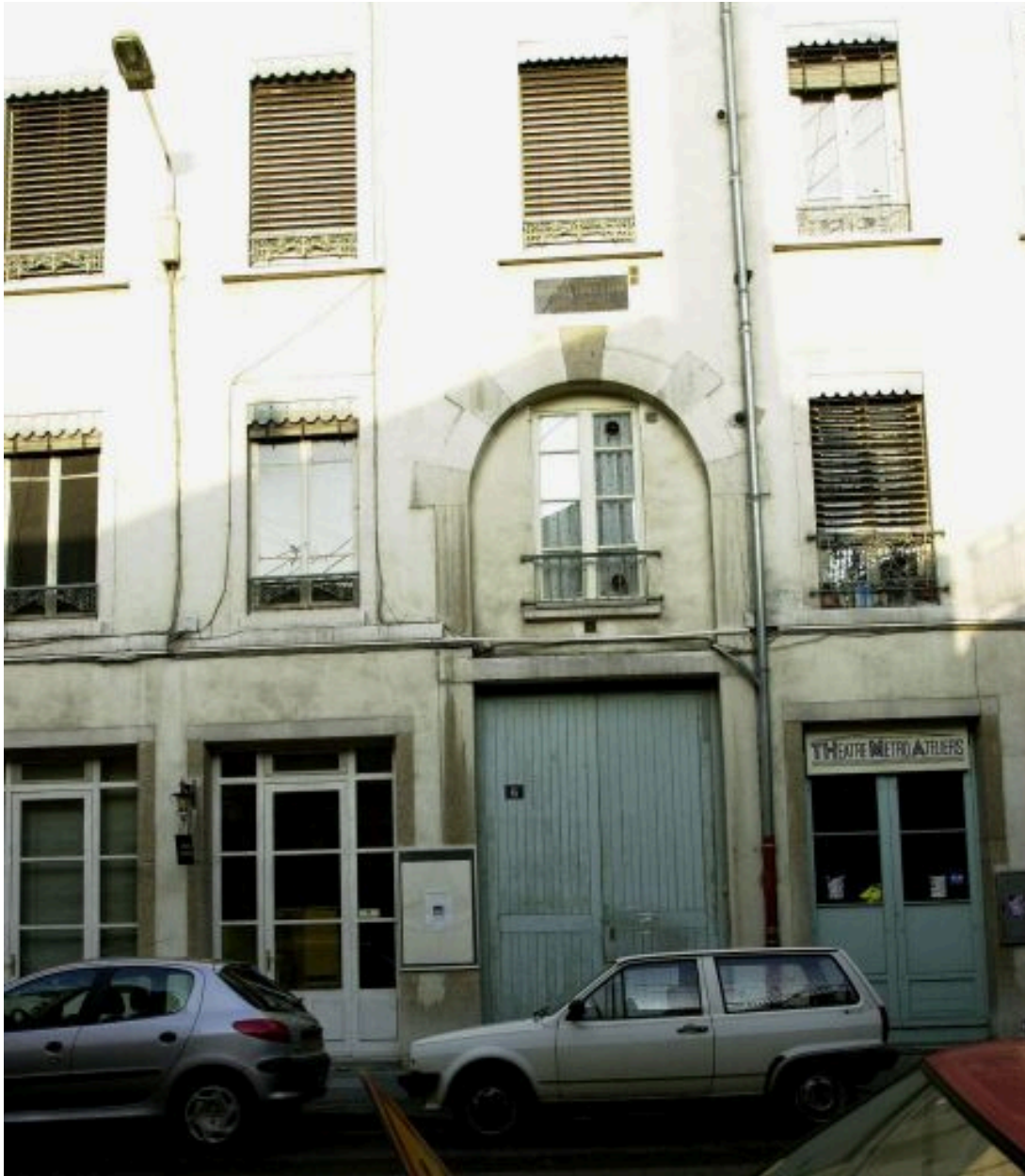
Détail de l'entrée