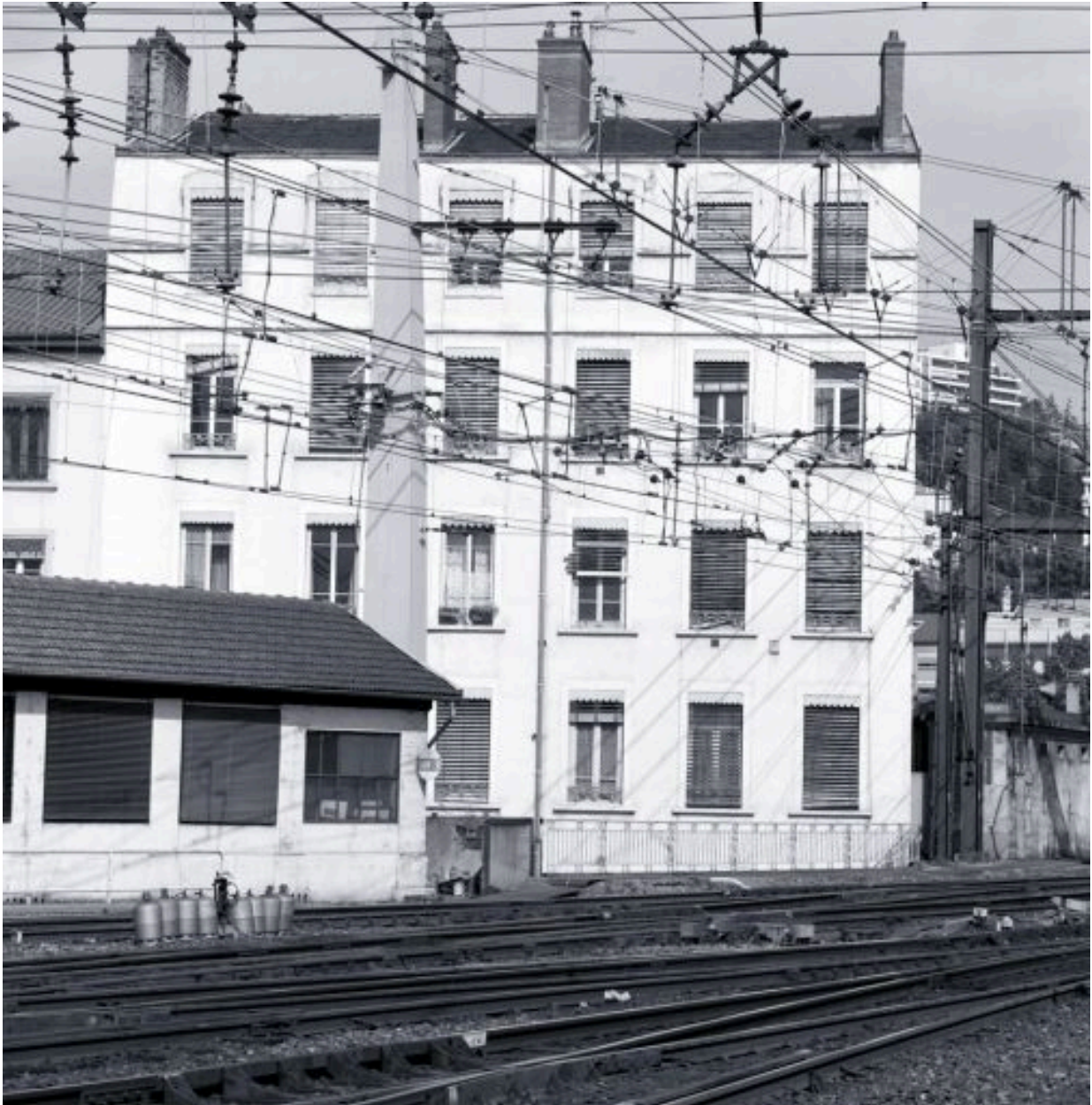
Elévation depuis la voie ferrée