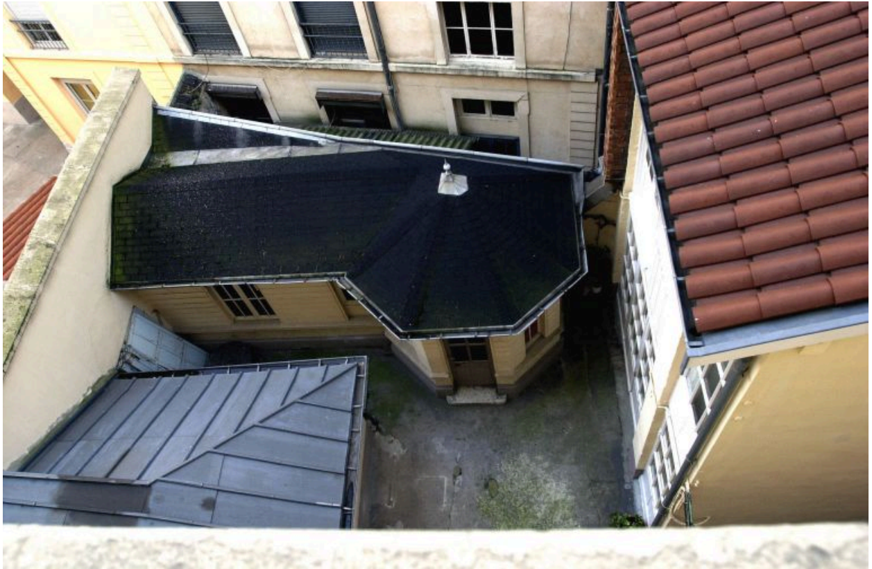
Vue de la cour