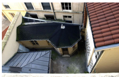
Vue de la cour IVR82_20016900334NUCA