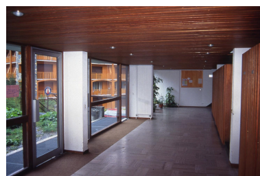
Détail du hall d'entrée IVR82_19987300035ZA