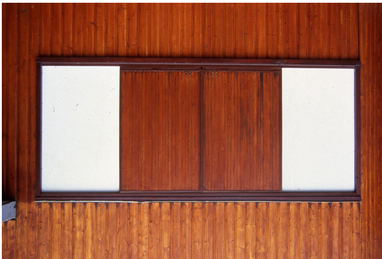
Détail des baies de l'élévation nord