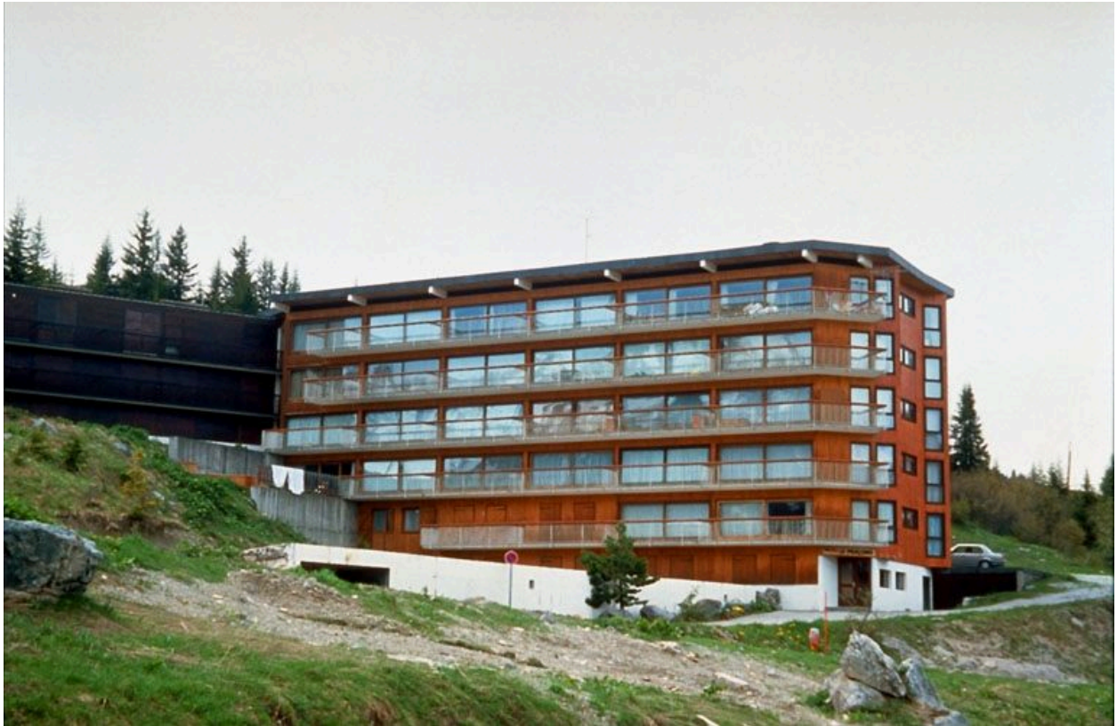
Elévation principale, au sud