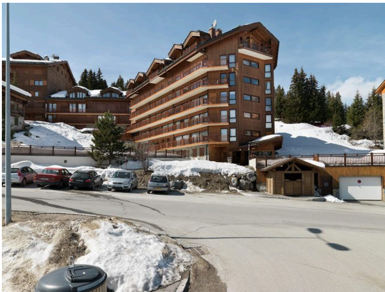
Le Pralong surélevé et modifié