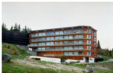
Elévation principale, au sud IVR82_19987300030ZA