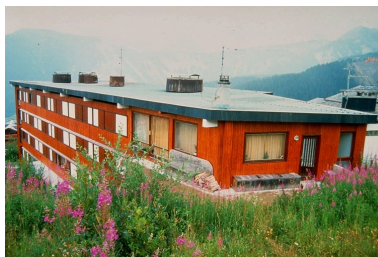
Vue depuis le nord-ouest IVR82_19987300031ZA