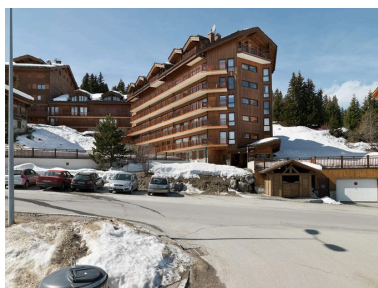
Le Pralong surélevé et modifié