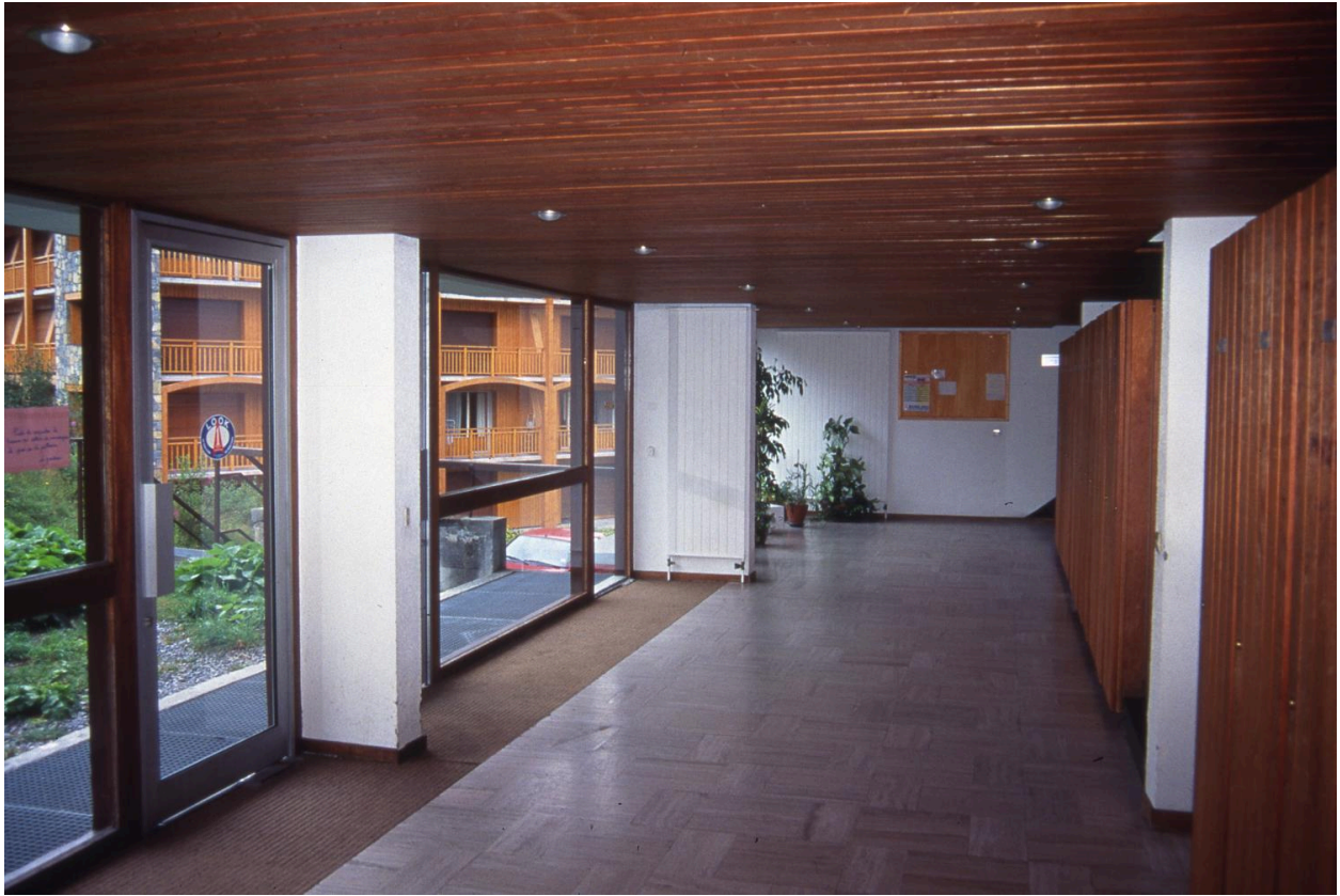
Détail du hall d'entrée