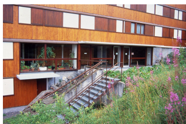
Elévation nord. Détail de l'entrée IVR82_19987300034ZA