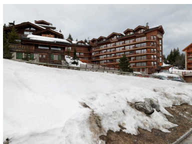
Vue d'ensemble du Pralong surélevé et modifié