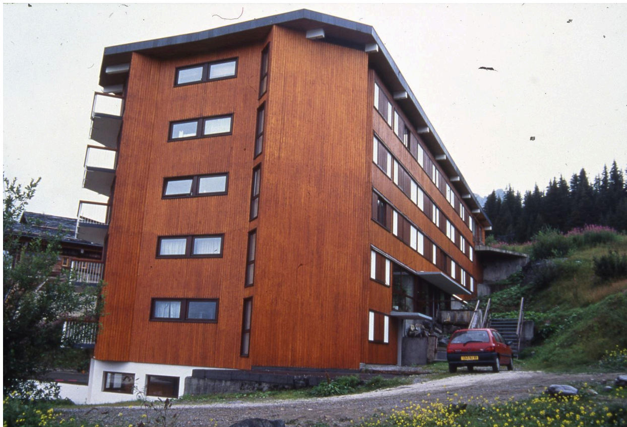
Vue depuis le nord-ouest