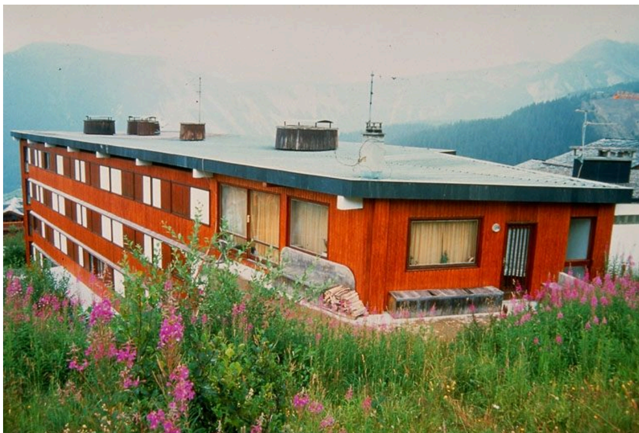
Vue depuis le nord-ouest