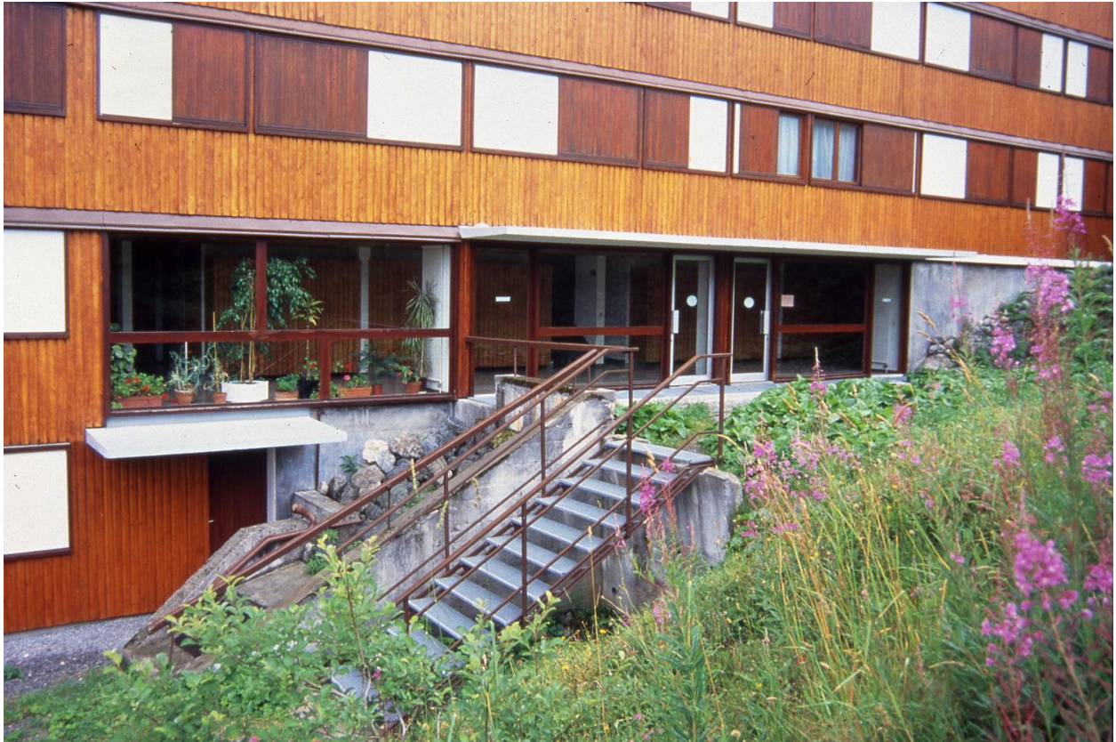
Elévation nord. Détail de l'entrée