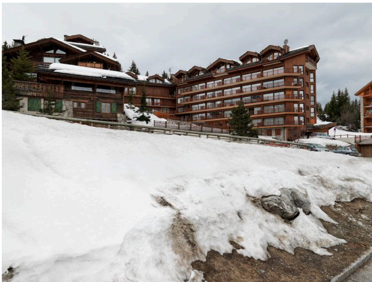
Vue d'ensemble du Pralong surélevé et modifié