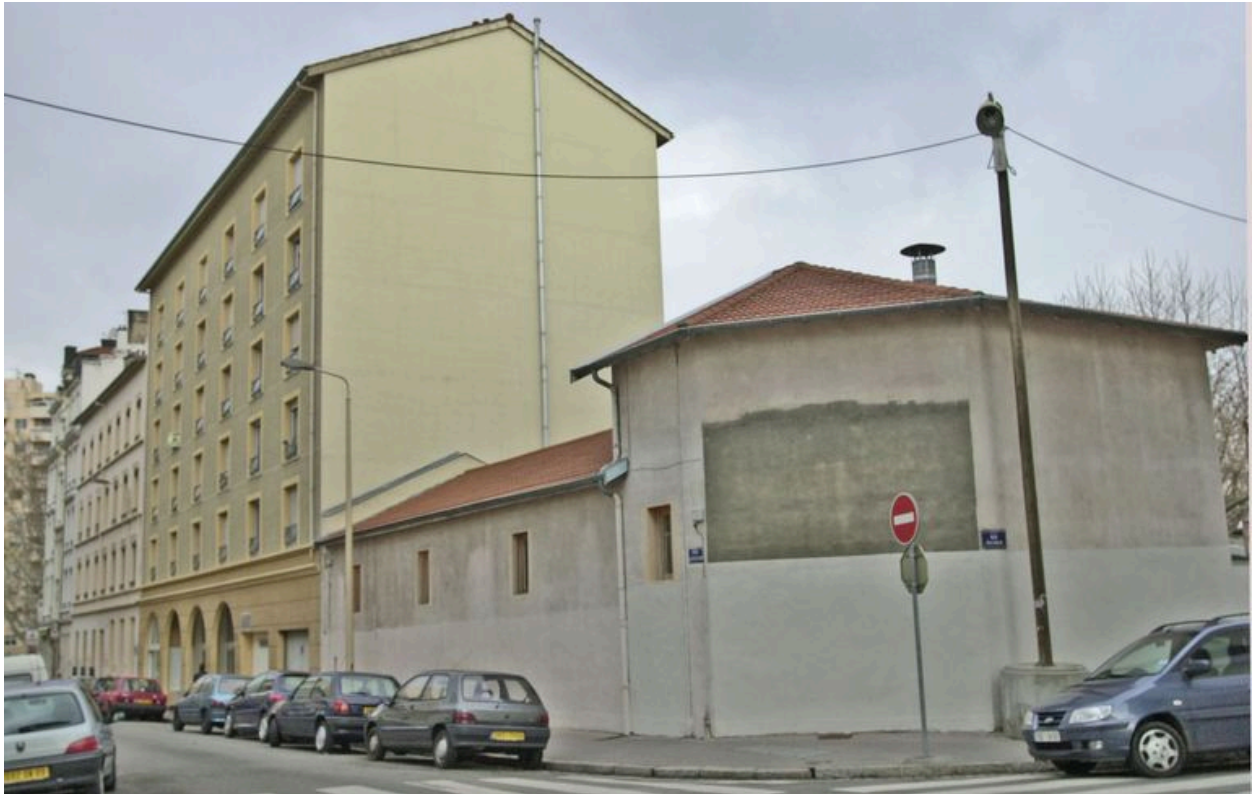
Vue de l'immeuble depuis la rue Rachais au sud-est