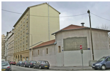
Vue de l'immeuble depuis la rue Rachais au sud-est IVR82_20066901287NUCA