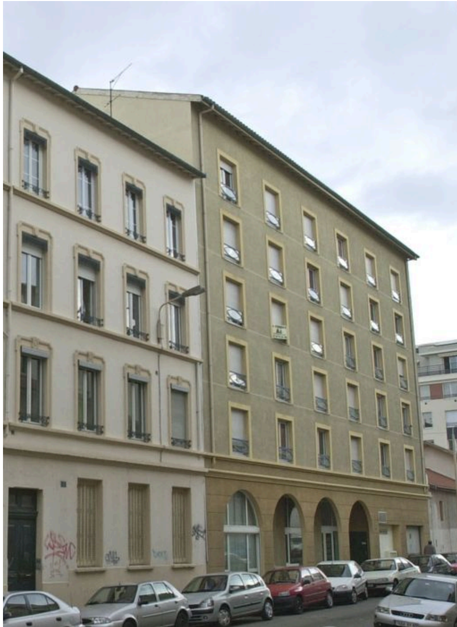
Vue de la façade sur rue depuis le sud-ouest