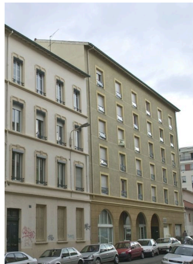
Vue de la façade sur rue depuis le sud-ouest IVR82_20066901288NUCA