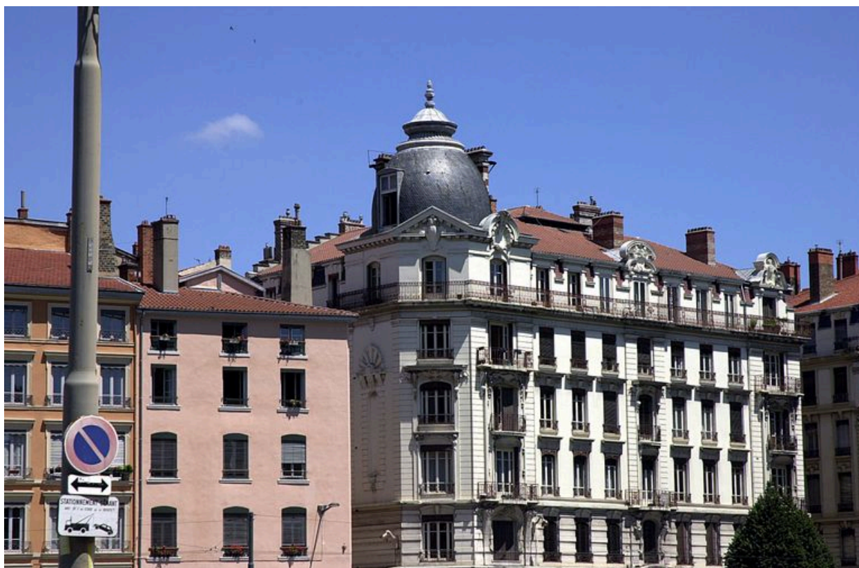
Vue partielle depuis le quai Pierre-Scize