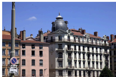
Vue partielle depuis le quai Pierre-Scize IVR82_20086901382NUCA