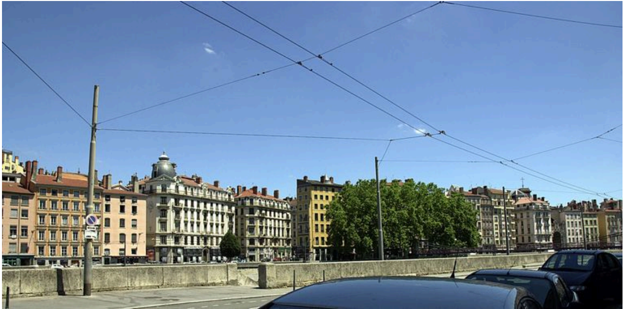
Vue de situation depuis le quai Pierre-Scize