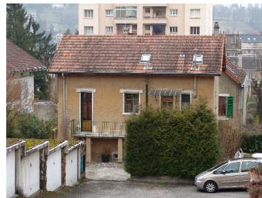
Façade principale IVR82_20097300174NUCA