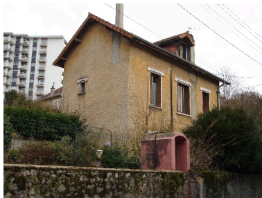
Vue générale IVR82_20097300175NUCA