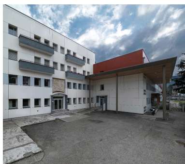
Vue générale