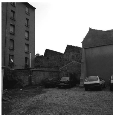
Vue ouest de la cour de l'immeuble IVR82_20026905011X