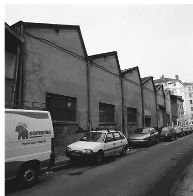
Vue est, rue Maurice Flandrin IVR82_20026905012X