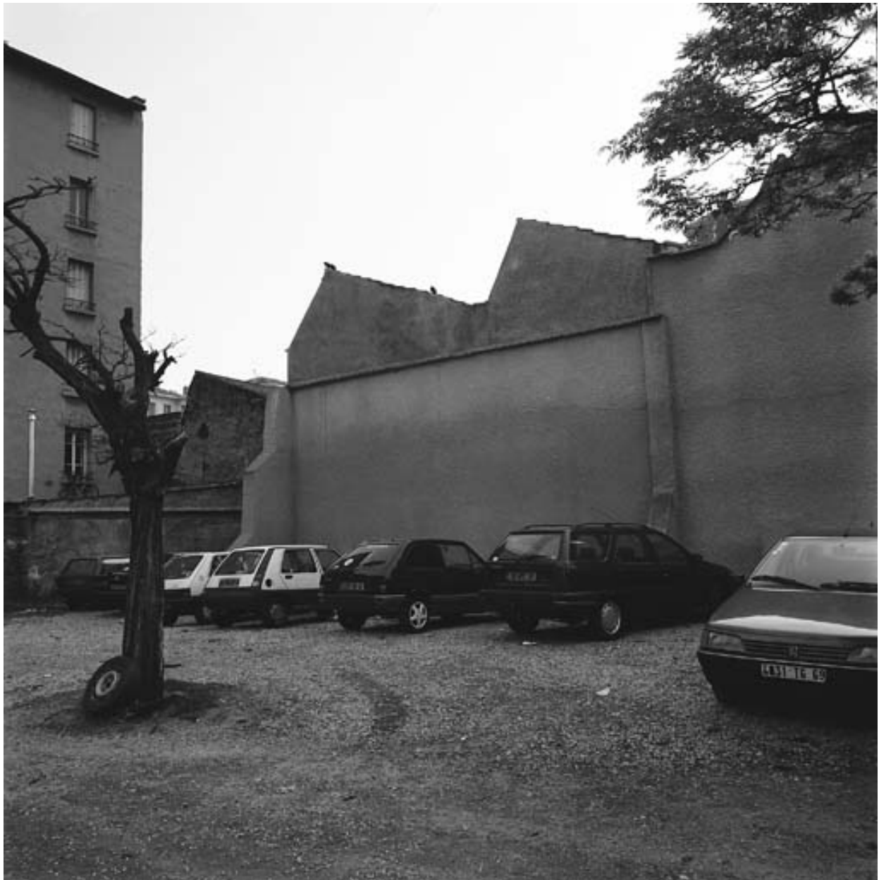
Vue ouest de la cour