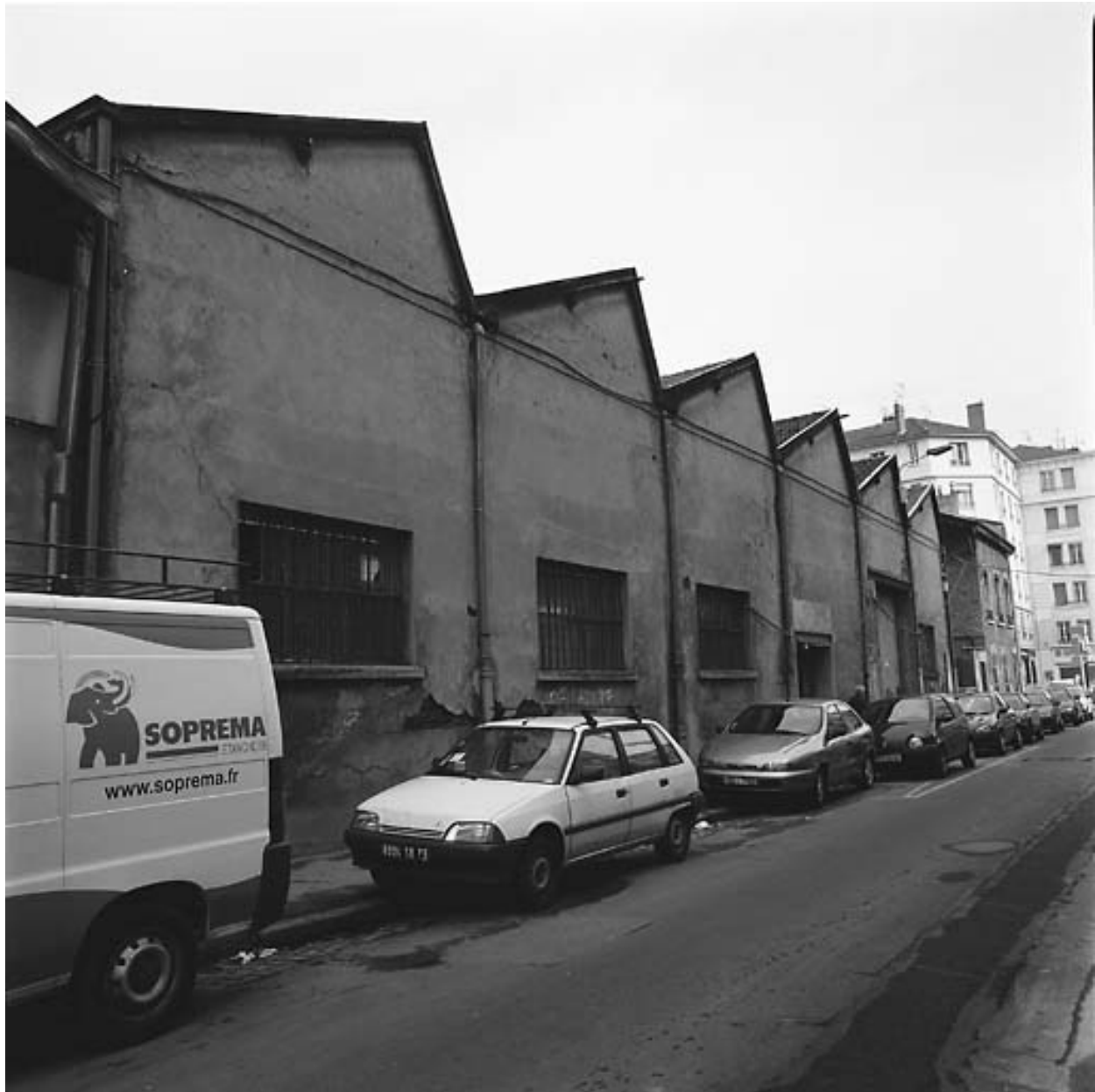
Vue est, rue Maurice Flandrin