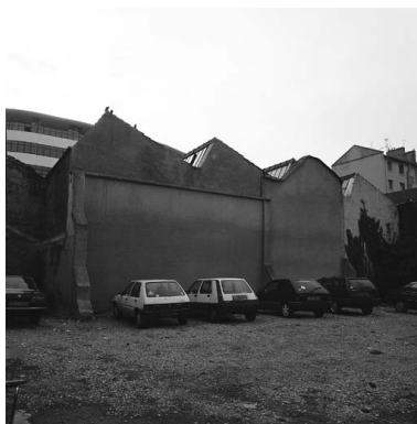
Ateliers vue de la cour