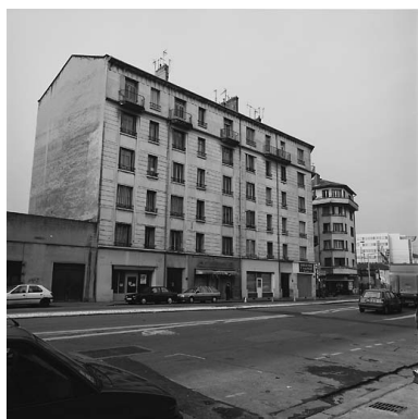
Vue nord-est