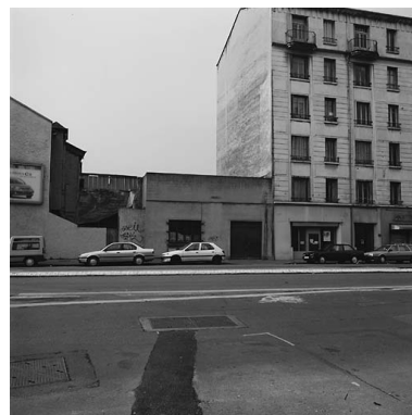
Vue nord IVR82_20026905009X