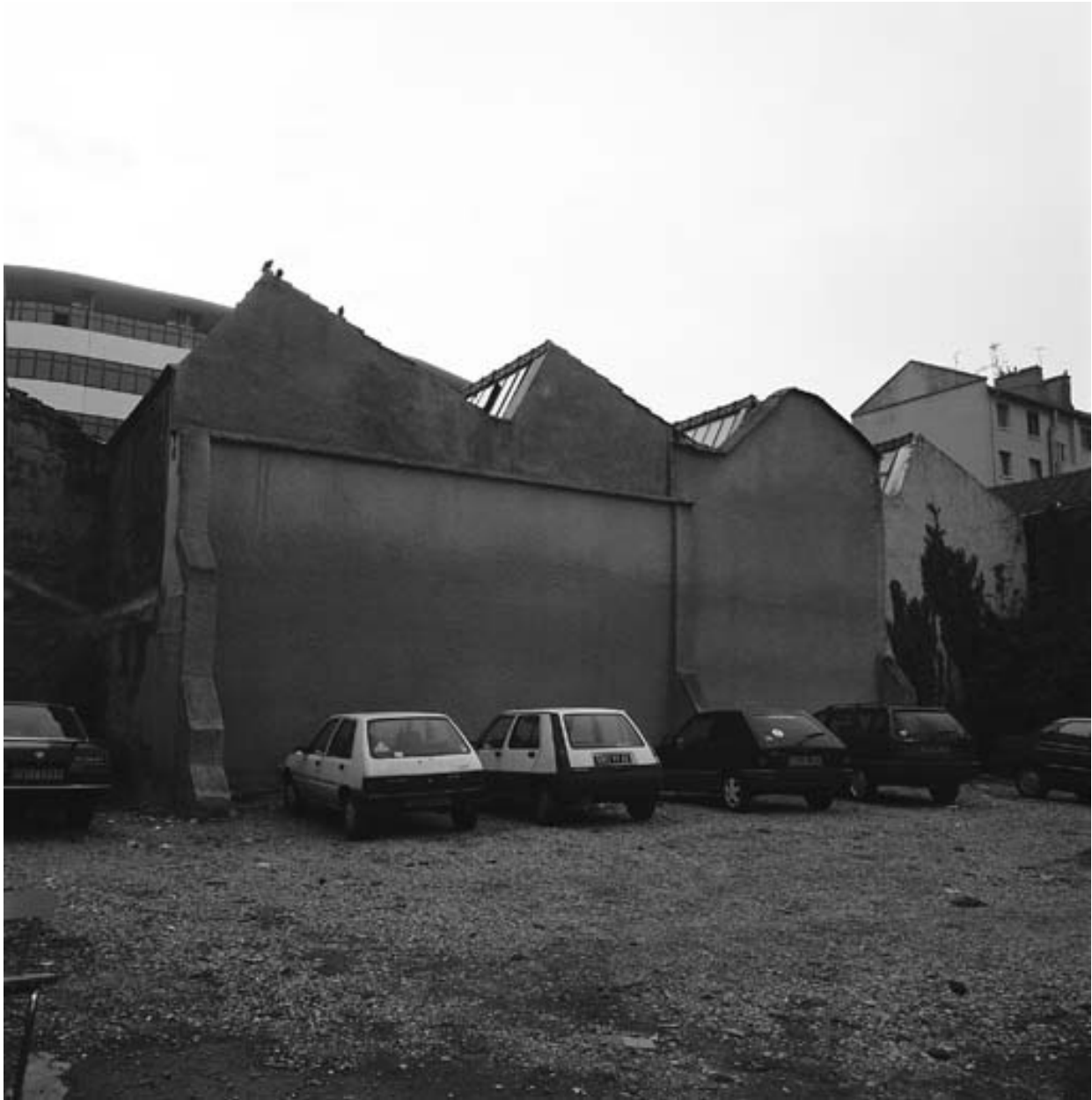
Ateliers vue de la cour