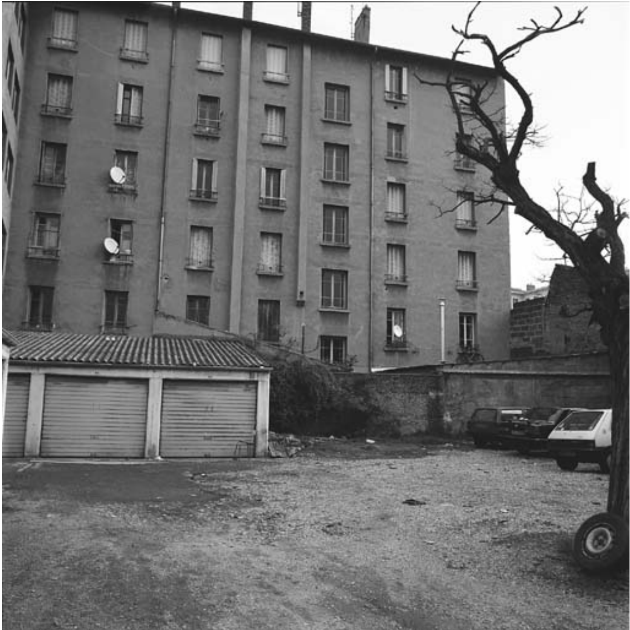
Vue sud du 202 Paul Bert