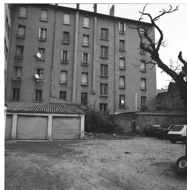
Vue sud du 202 Paul Bert