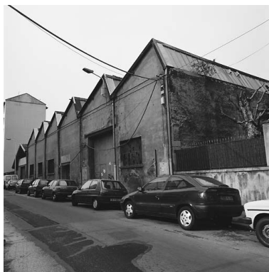
Façade est, vue d'ensemble des ateliers IVR82_20026905013X