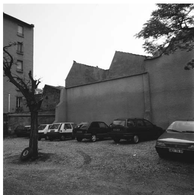
Vue ouest de la cour