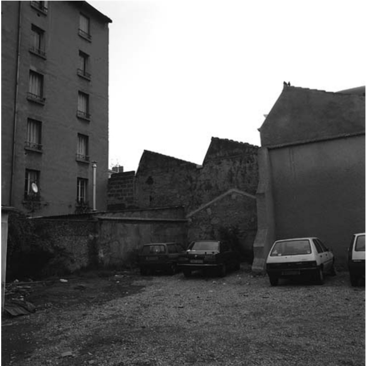
Vue ouest de la cour de l'immeuble