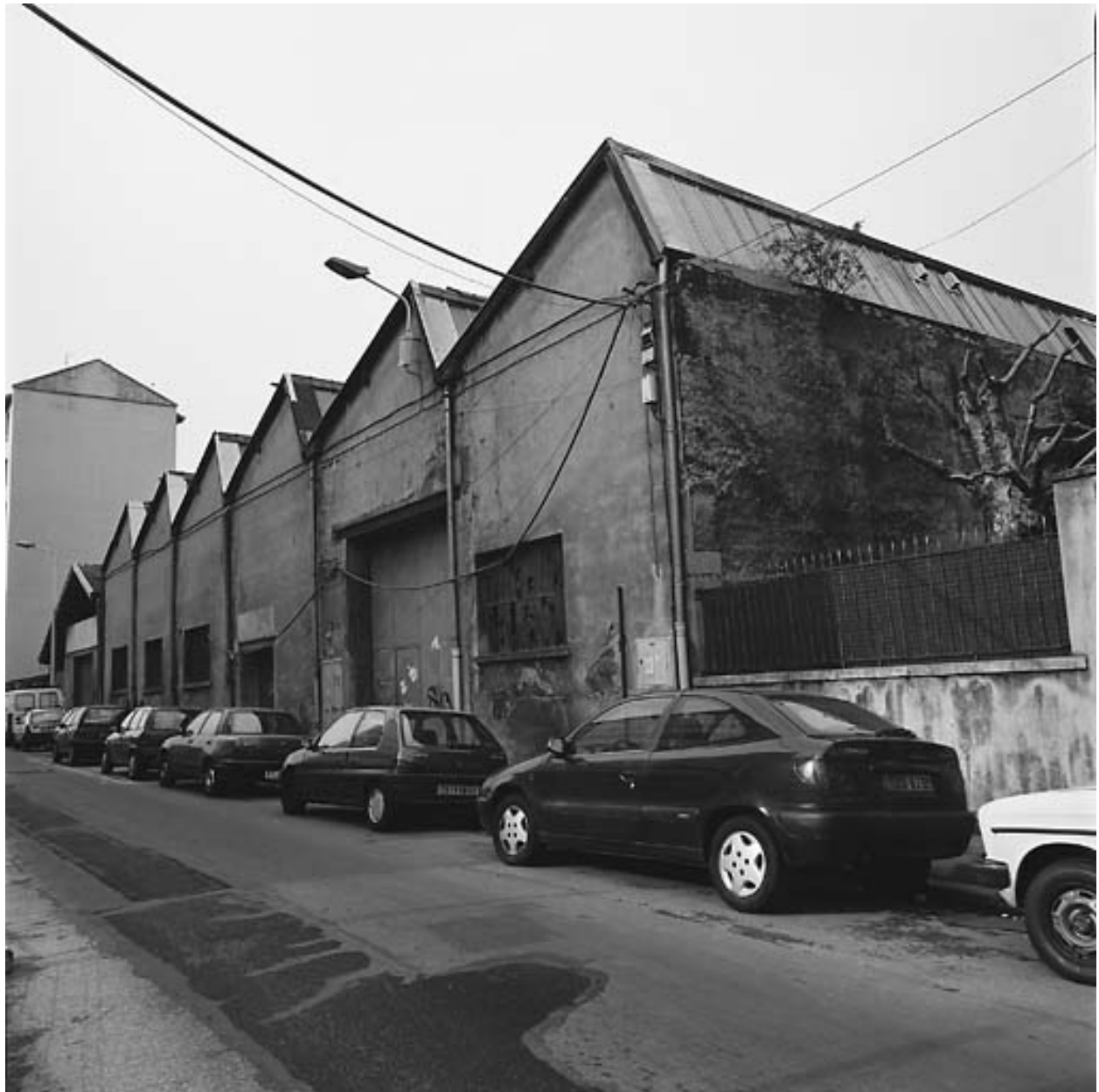
Façade est, vue d'ensemble des ateliers