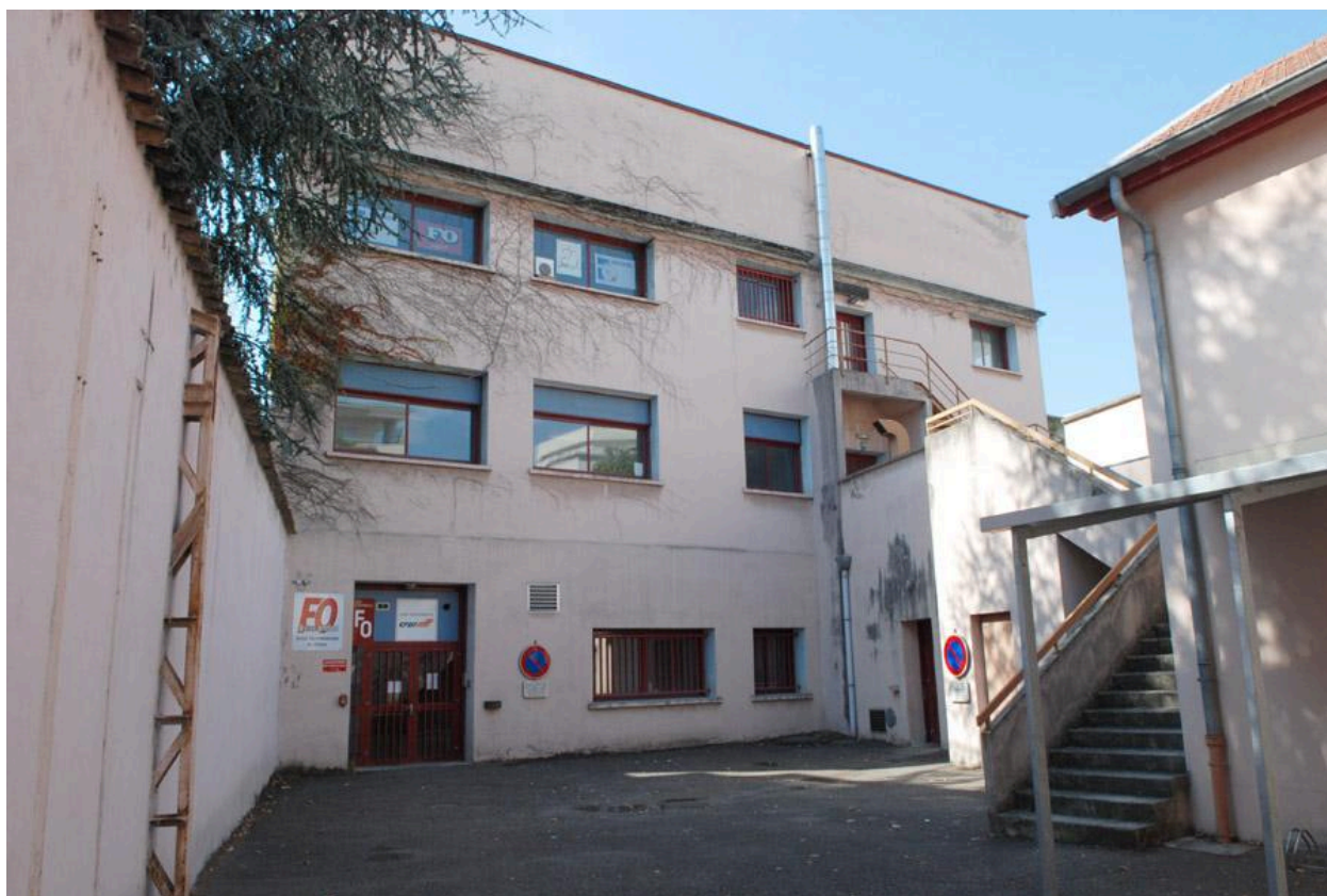
Vue sur cour des bâtiments administratifs