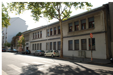
Vue d'ensemble IVR82_20116900384NUCA