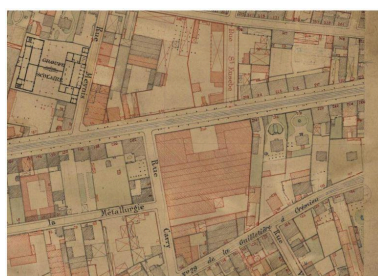
Plan de section 1/2000 de 1920 (AC Lyon) IVR82_20116900387NUCA