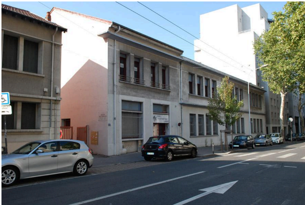
Vue est du site