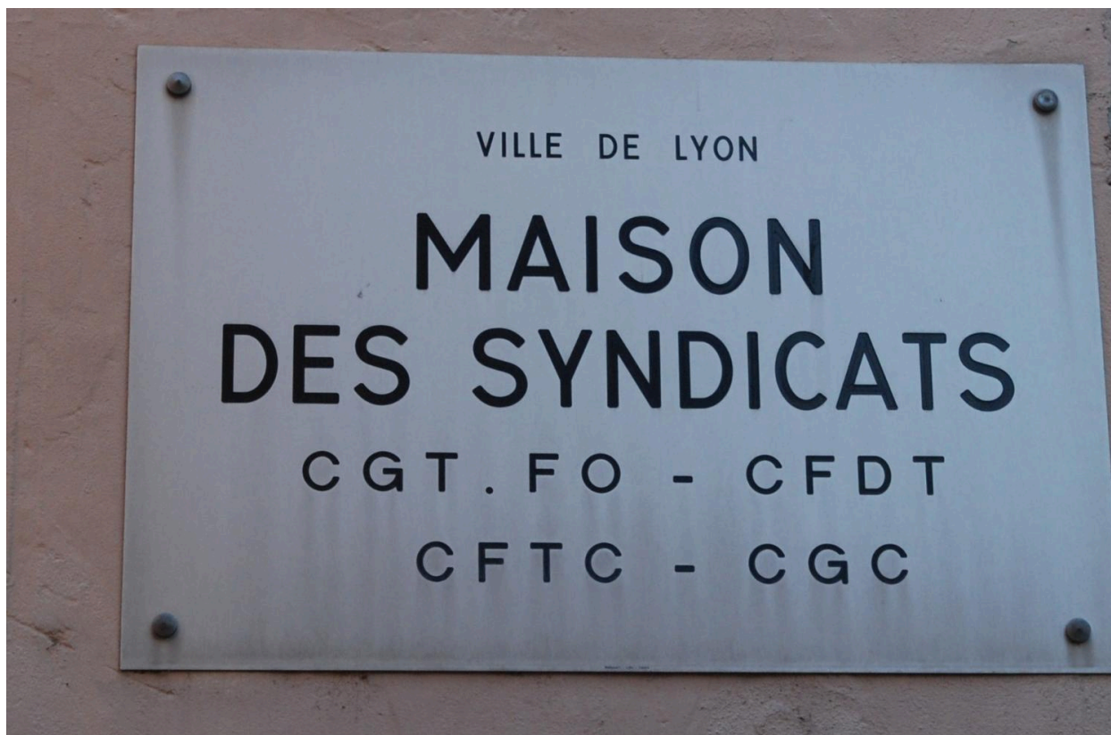
Plaque de la maison des syndicats en 2011