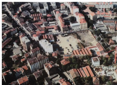
Vue du site en 1985 (ACL L 1767W035)