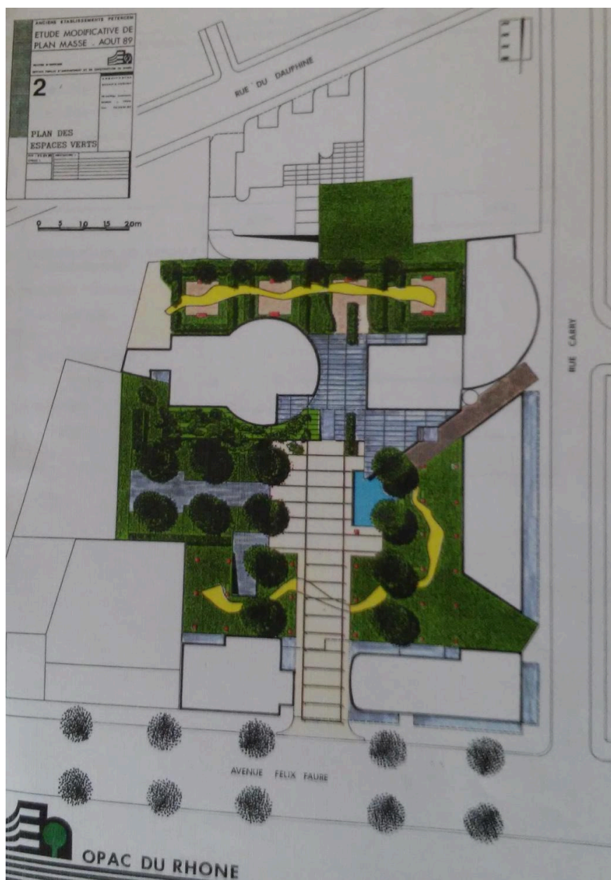
Projet d'aménagement urbain en 1985 (ACL 1767W035).