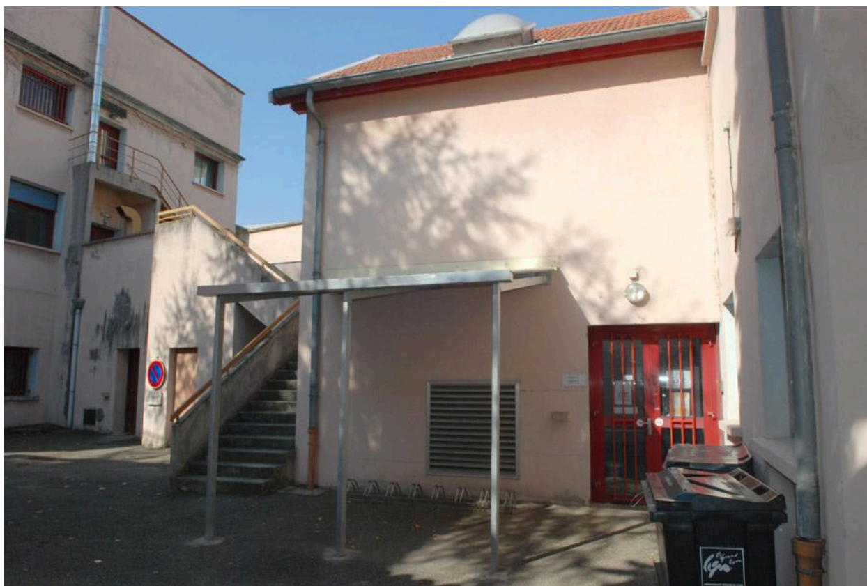
Vue sur cour intérieur