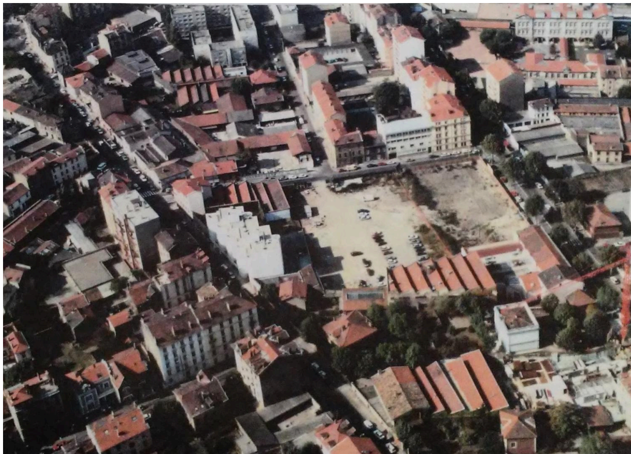
Vue du site en 1985 (AC L 1767W035)