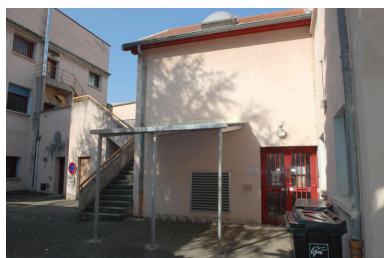
Vue sur cour intérieur IVR82_20116900386NUCA