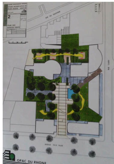
Projet d'aménagement urbain en 1985 (ACL L 1767W035).