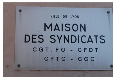
Plaque de la maison des syndicats en 2011