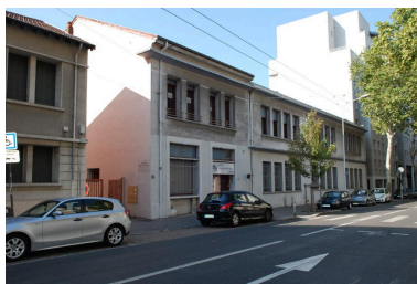
Vue est du site IVR82_20116900383NUCA