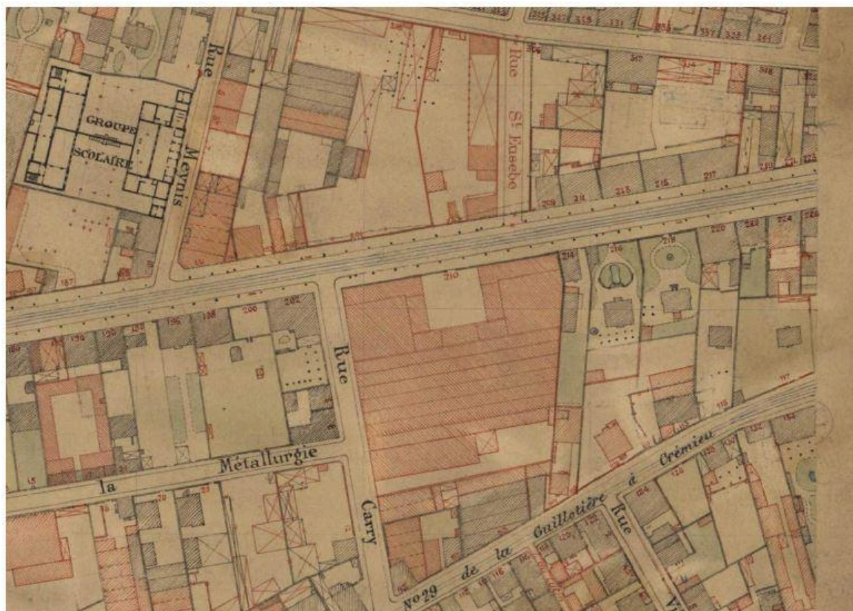
Plan de section 1/2000 de 1920 (AC Lyon)