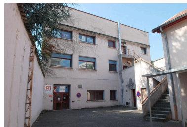
Vue sur cour des bâtiments administratifs IVR82_20116900385NUCA