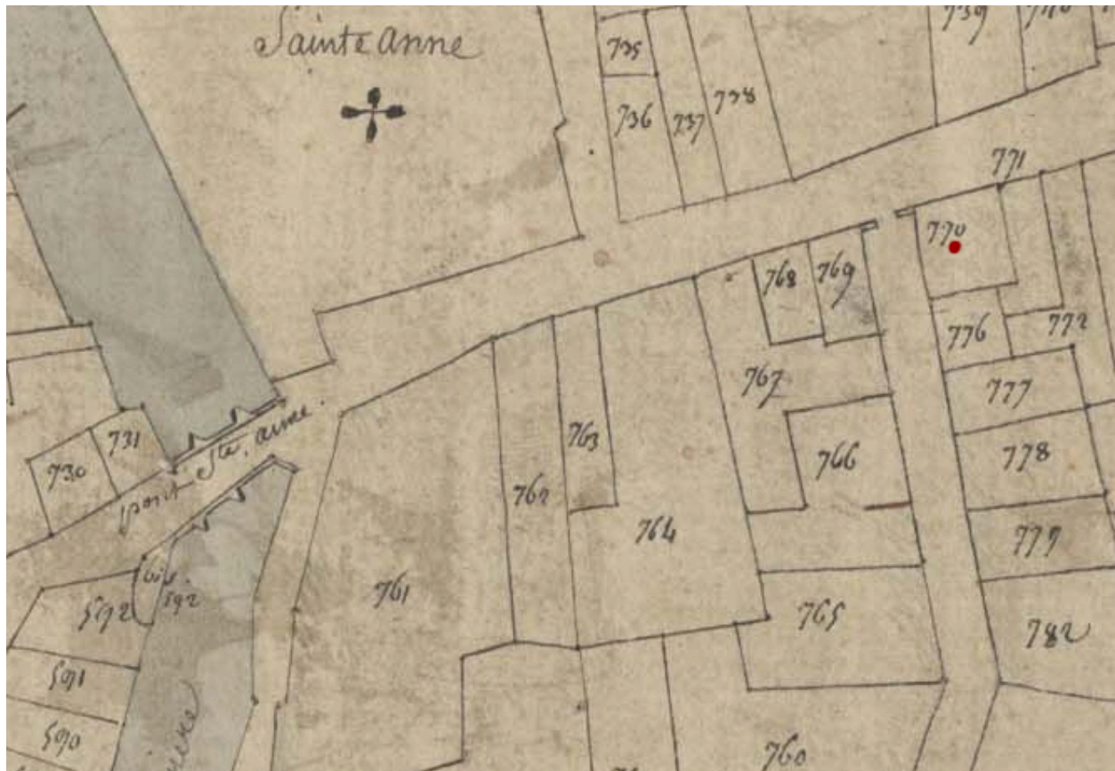
Extrait du plan cadastral de 1809, parcelle E 770.