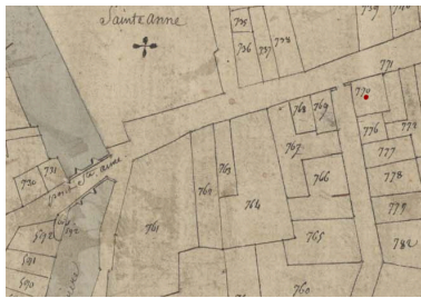
Extrait du plan cadastral de 1809, parcelle E 770.