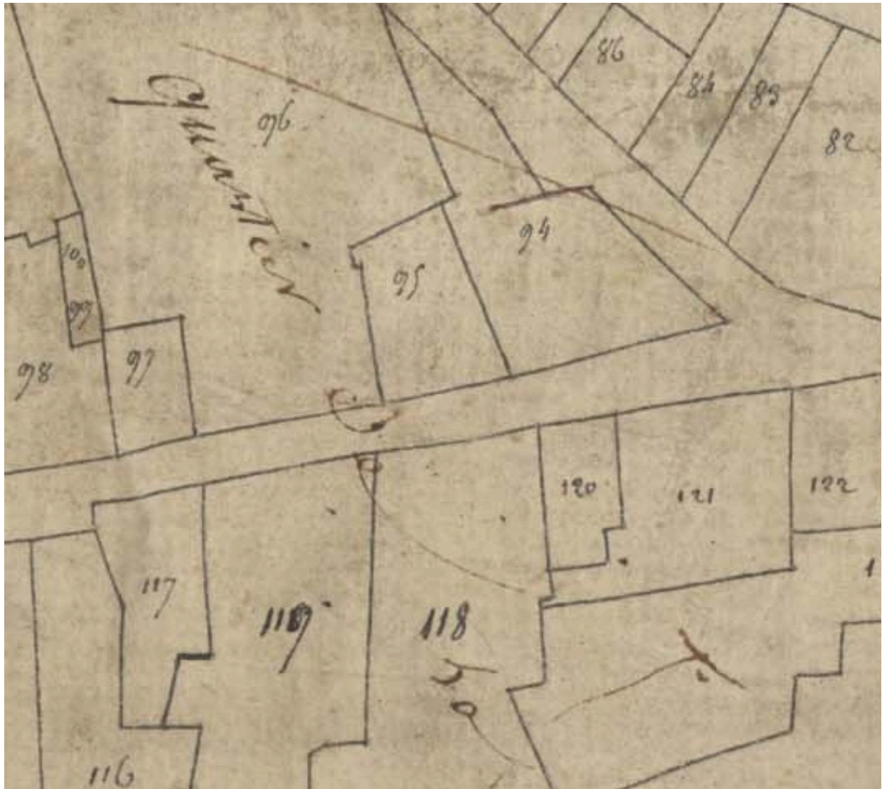
Extrait du plan cadastral de Montbrison, 1809, parcelle E 95.