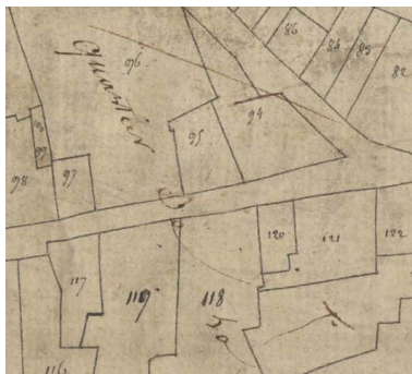
Extrait du plan cadastral de Montbrison, 1809, parcelle E 95. IVR82_20114200214NUD