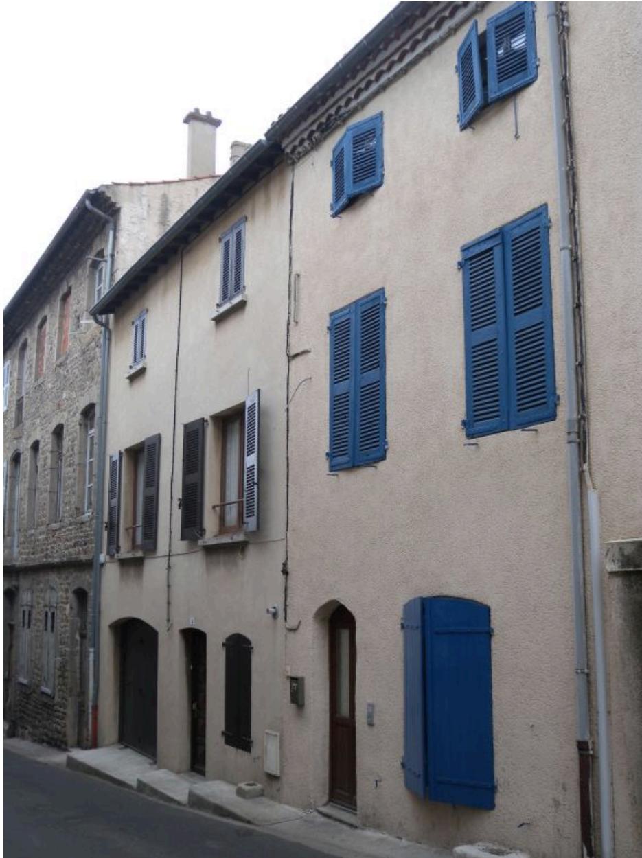
Elévation sur rue après la restauration de 2010.