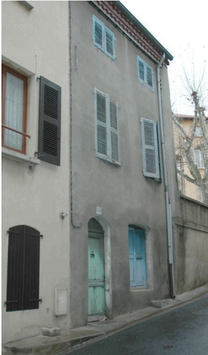
Vue de l'élévation principale sur rue, avant restauration.