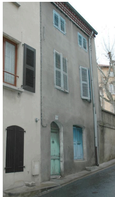
Vue de l'élévation principale sur rue, avant restauration. IVR82_20114200212NUCA