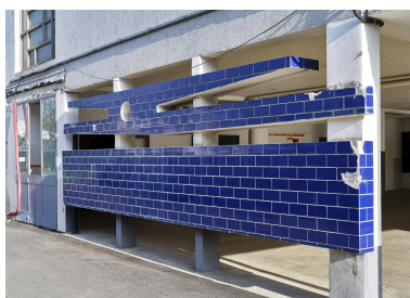
Vue du même panneau, côté bleu IVR84_20223800076NUCA