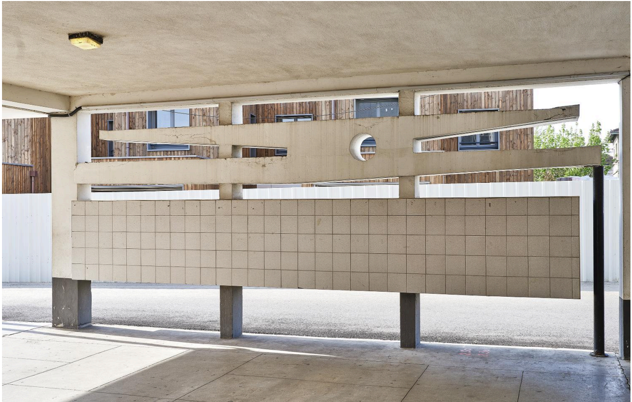
Vue d'un panneau, côté blanc