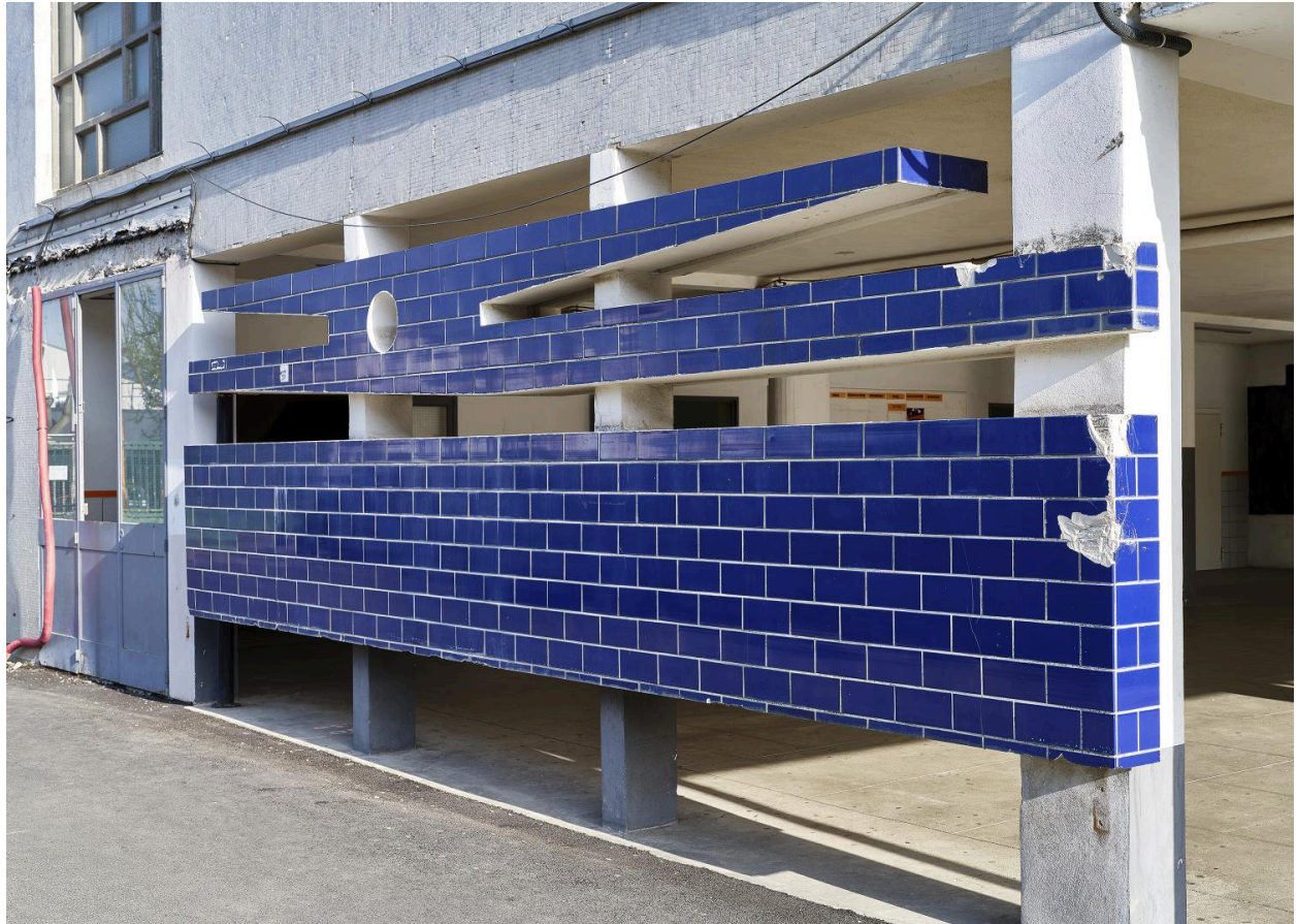
Vue du même panneau, côté bleu