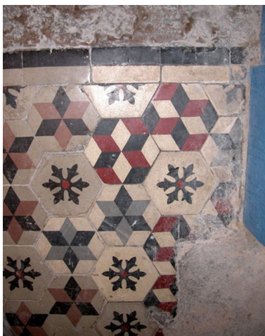
Carrelage en ciment moulé du vestibule IVR82_20046904665NUCA