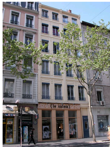
Elévation principale IVR82_20046904664NUCA