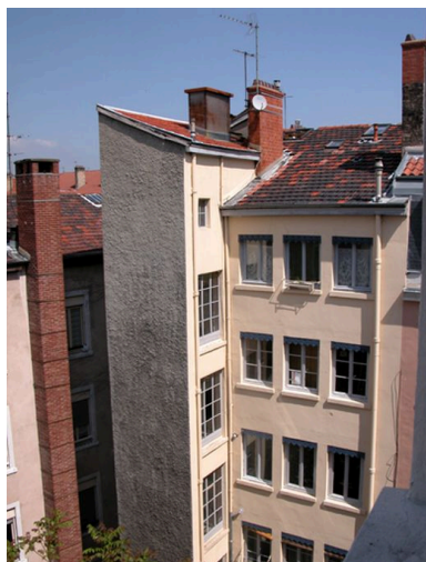
Elévation postérieure depuis le 4 avenue Jean-Jaurès IVR82_20046904542NUCA