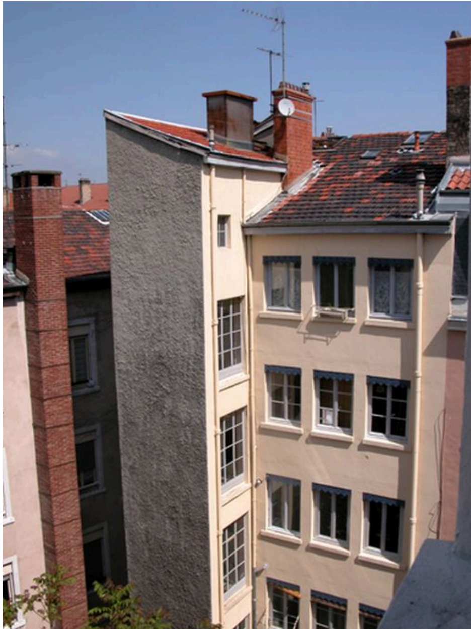
Elévation postérieure depuis le 4 avenue Jean-Jaurès