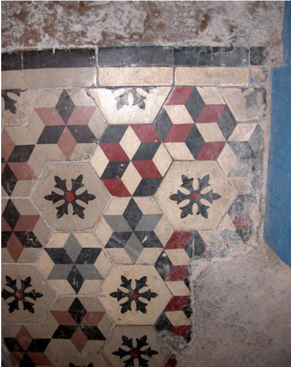
Carrelage en ciment moulé du vestibule