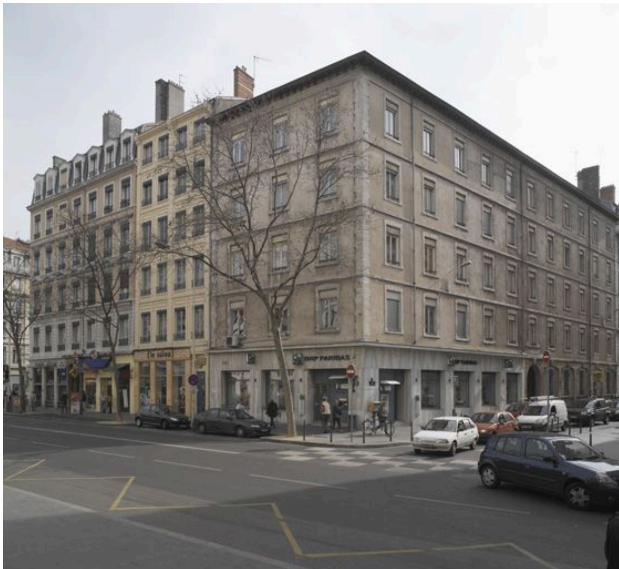
Vue générale depuis le nord-ouest