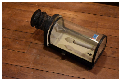
Vue générale IVR84_20216301445NUC4A