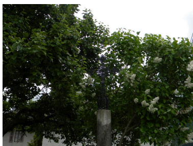
Vue de la croix en fonte sur son socle monolithe.