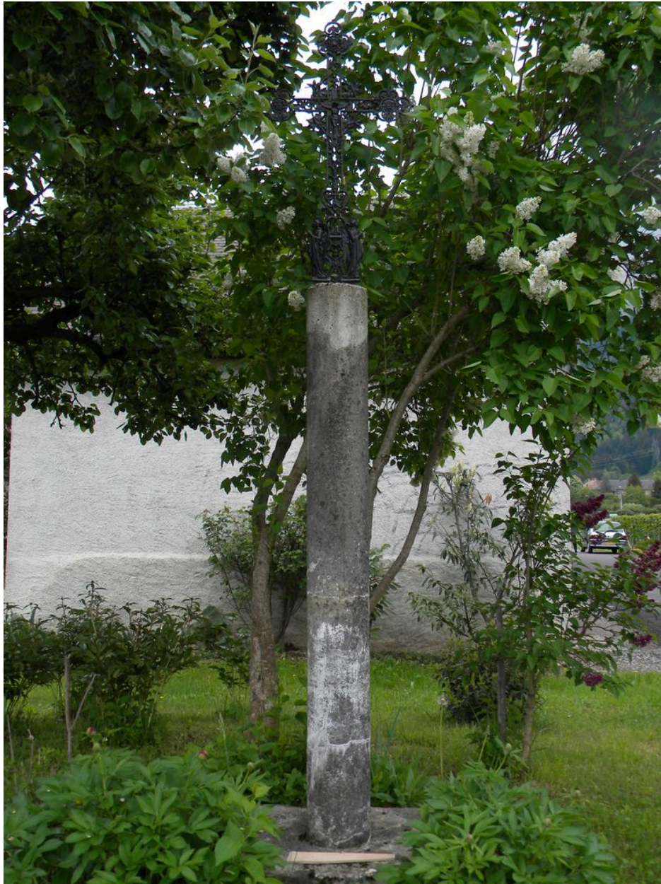
Vue d'ensemble de la croix.