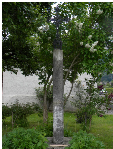
Vue d'ensemble de la croix. IVR82_20107402663NUCA