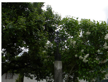
Vue de la croix en fonte sur son socle monolithe. IVR82_20107402662NUCA