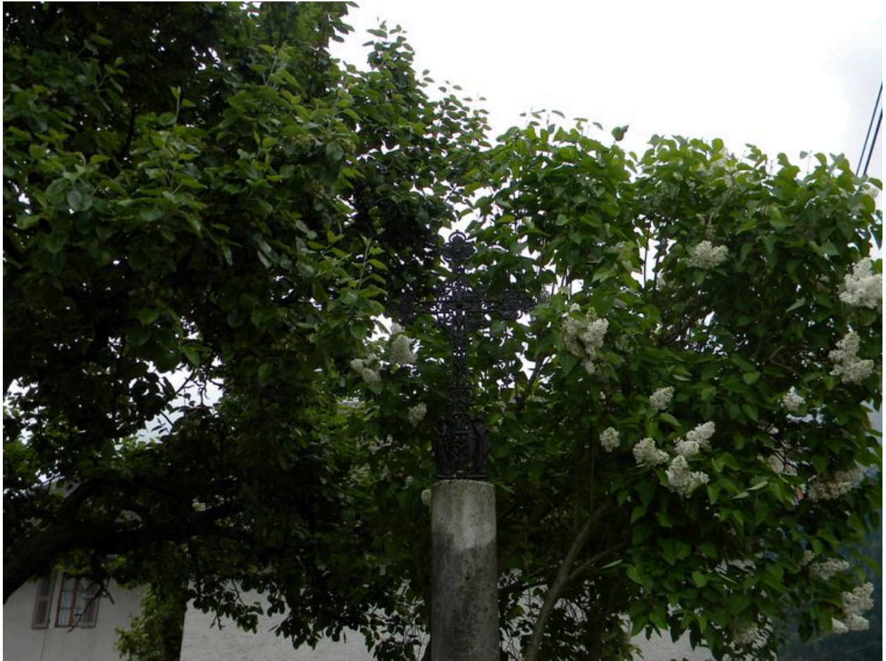
Vue de la croix en fonte sur son socle monolithe.