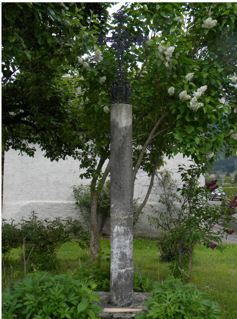
Vue d'ensemble de la croix.