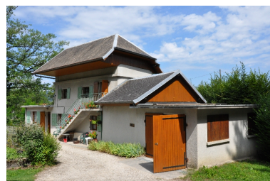
Vue du bâtiment d'habitation à l'ouest du moulin IVR82_20117302162NUCA