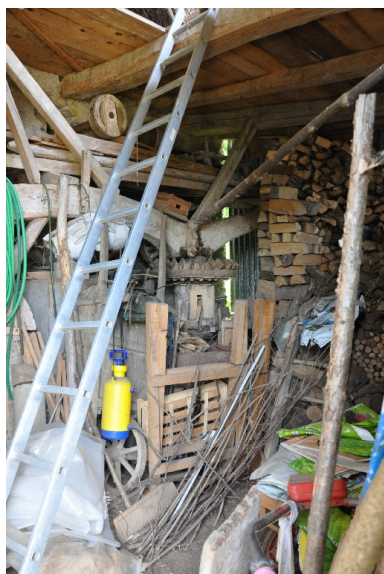
Vue intérieure du moulin IVR82_20117302160NUCA