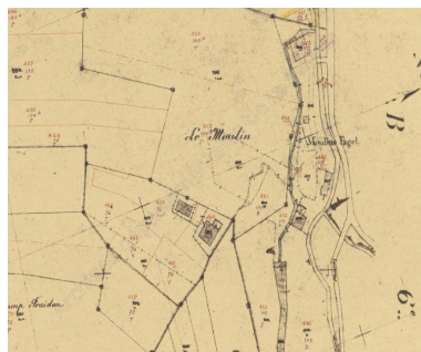
Cadastre rénové, 1957. Cadastre de 1957 AD Savoie. 3P 7241