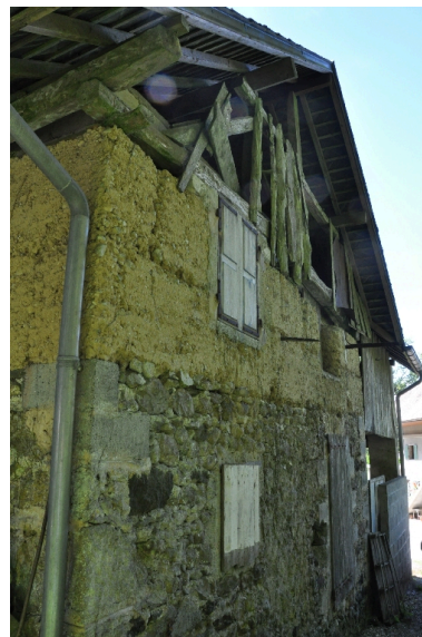
Vue de la façade nord-est avec une élévation en pierre maçonnée et en pisé IVR82_20117302159NUCA