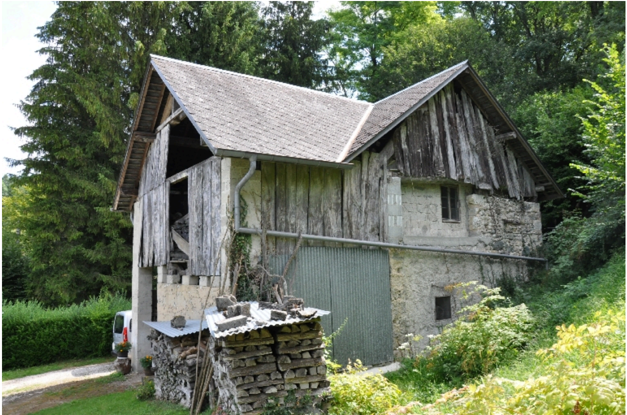
Vue générale du moulin Paget