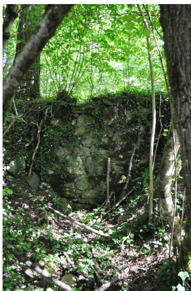
Vue du barrage IVR82_20117302161NUCA