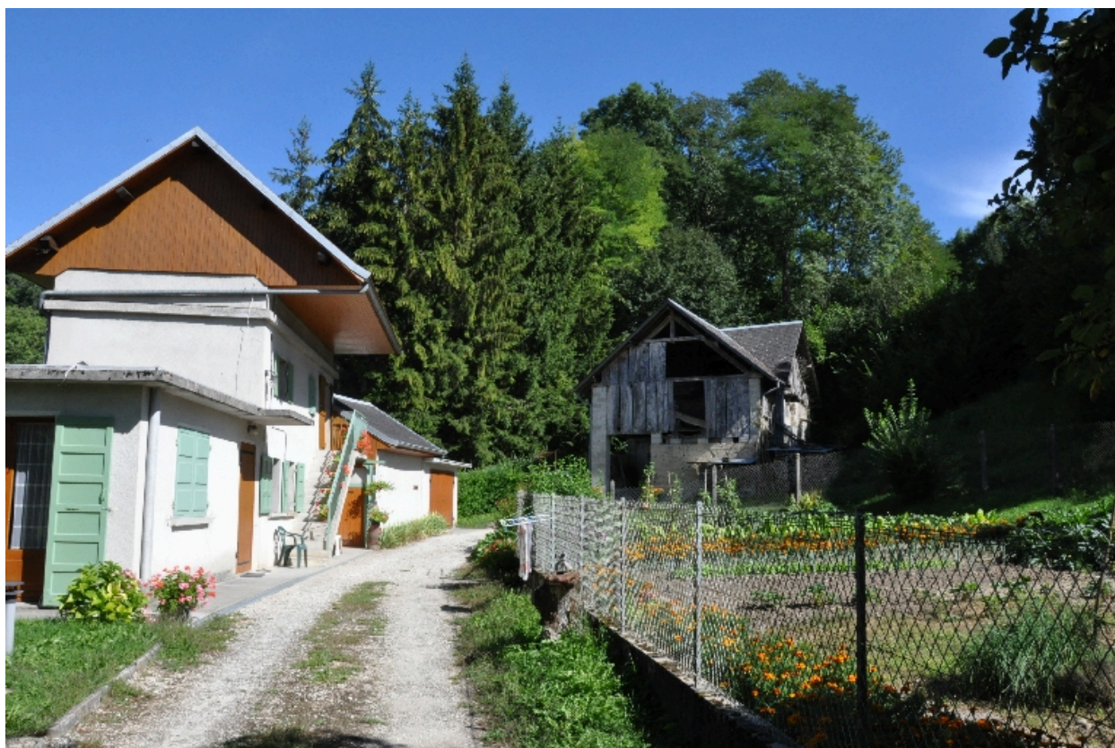
Vue d'ensemble du moulin et du bâtiment d'habitation