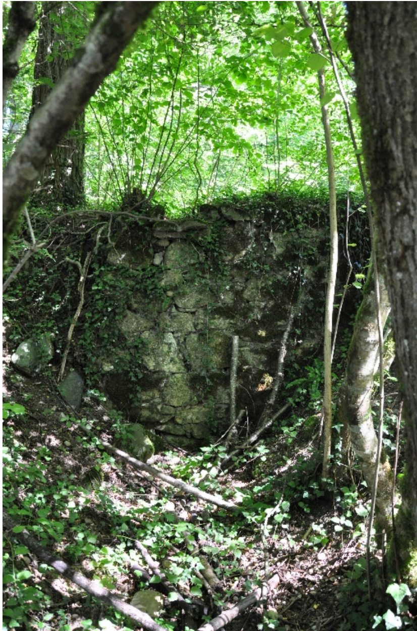
Vue du barrage