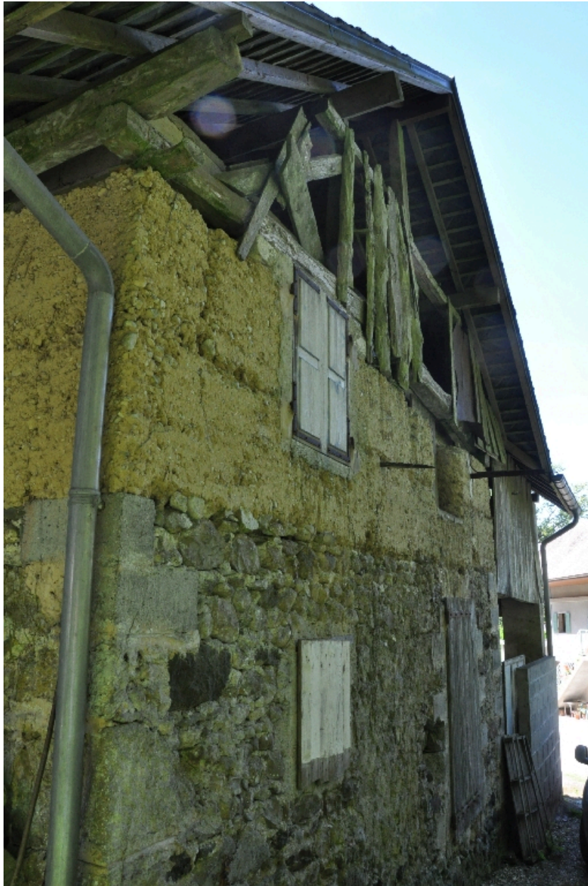
Vue de la façade nord-est avec une élévation en pierre maçonnée et en pisé