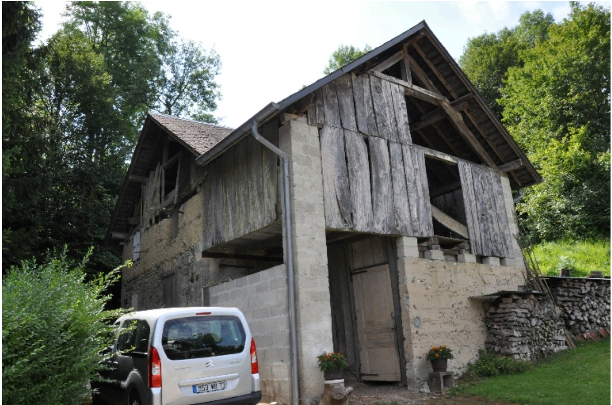
Vue de la façade nord-est