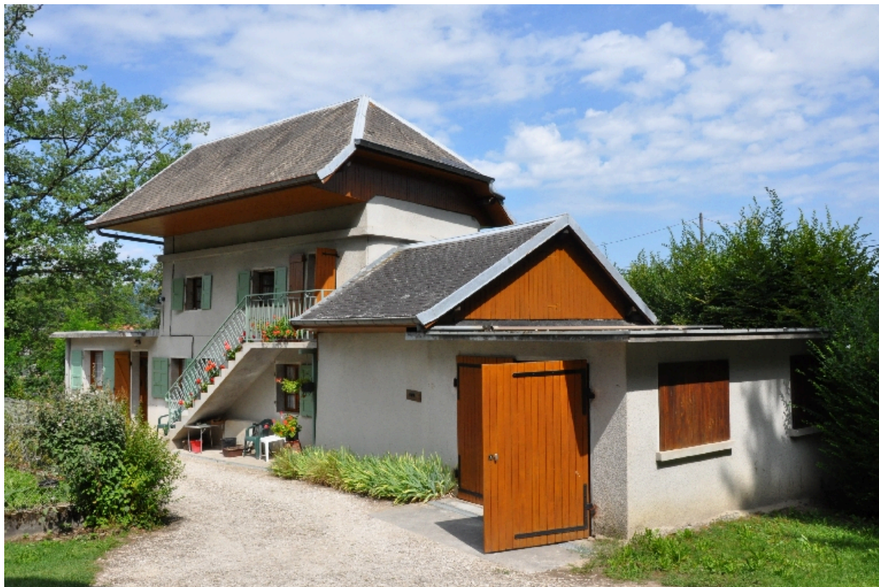
Vue du bâtiment d'habitation à l'ouest du moulin