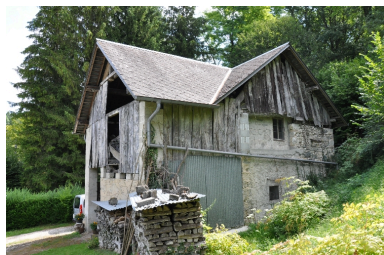
Vue générale du moulin Paget

Premier cadastre français, 1908. Cadastre de 1908 AD Savoie. 3P 7240