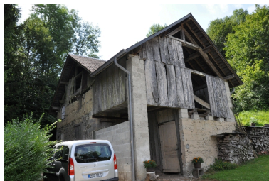
Vue de la façade nord-est IVR82_20117302156NUCA