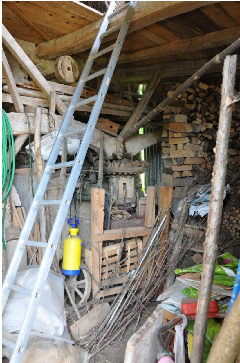
Vue intérieure du moulin