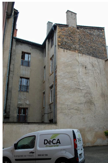
Elévations sur cour IVR84_20166901893NUCA