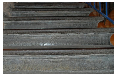
Détail d'une marche d'escalier avec marque de tâcheron IVR84_20166901896NUCA