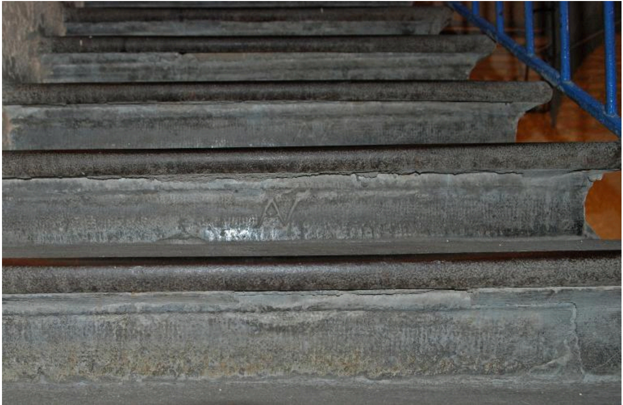
Détail d'une marche d'escalier avec marque de tâcheron