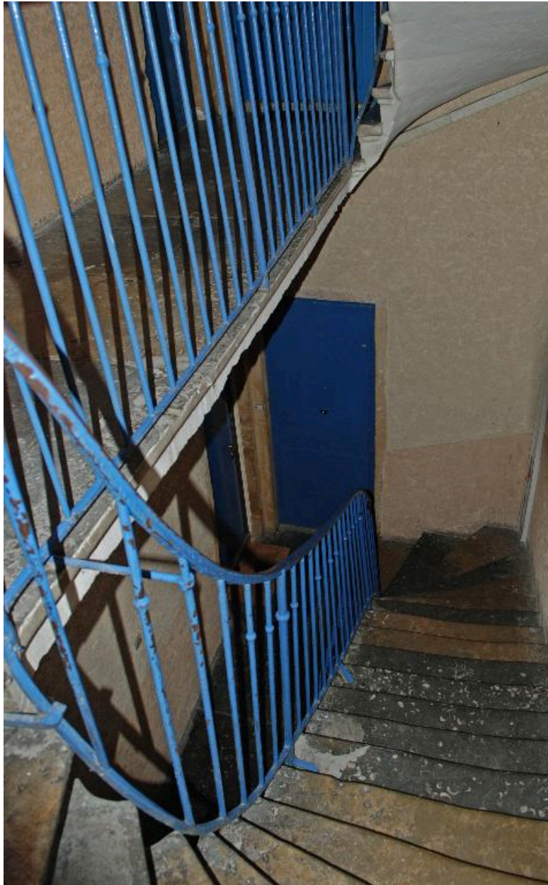
Vue intérieure : la cage d'escalier