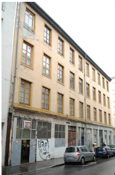
Elévation sur la rue Cluzan IVR84_20166901892NUCA