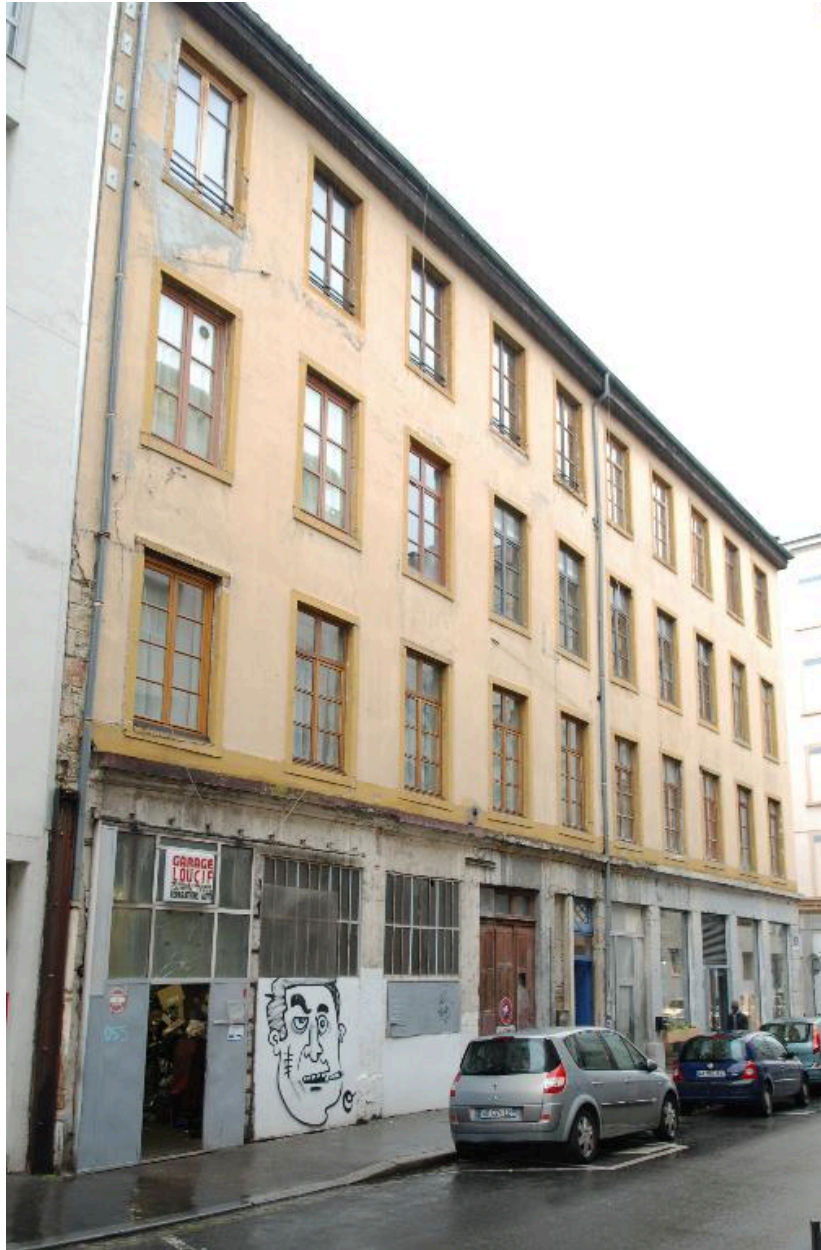
Elévation sur la rue Cluzan