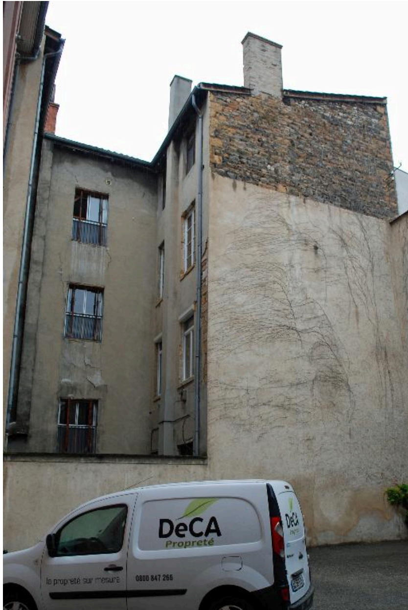
Elévations sur cour