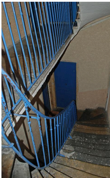
Vue intérieure : la cage d'escalier IVR84_20166901895NUCA