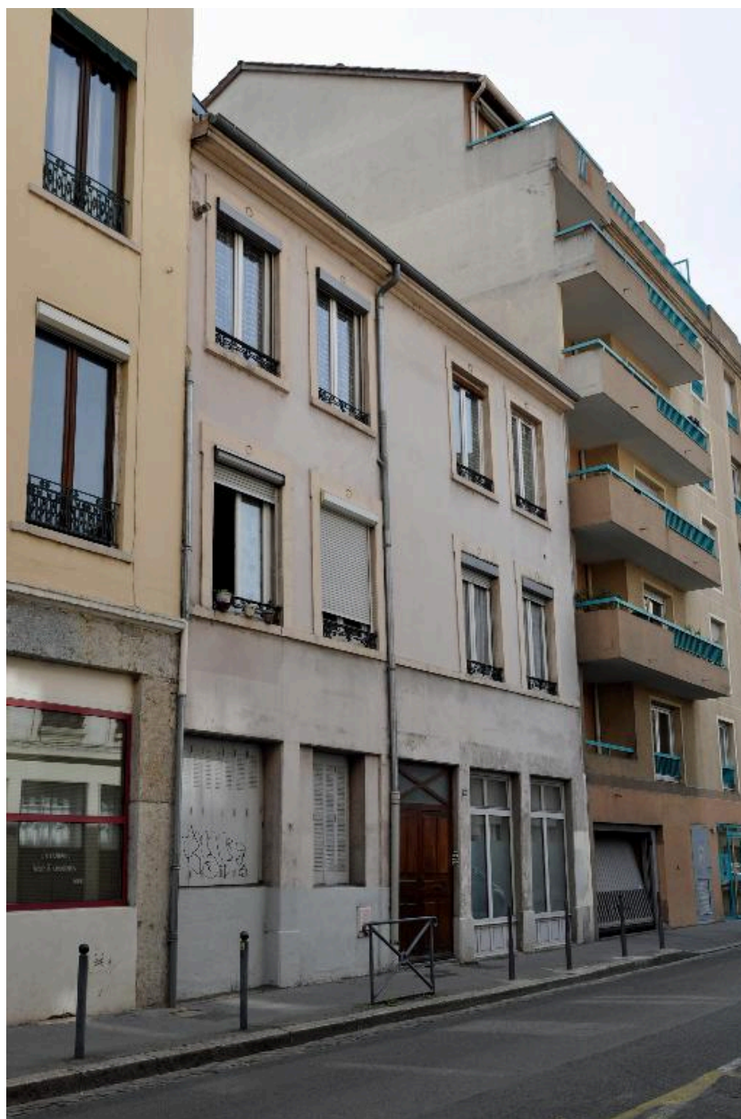
Vue générale, élévation sur rue