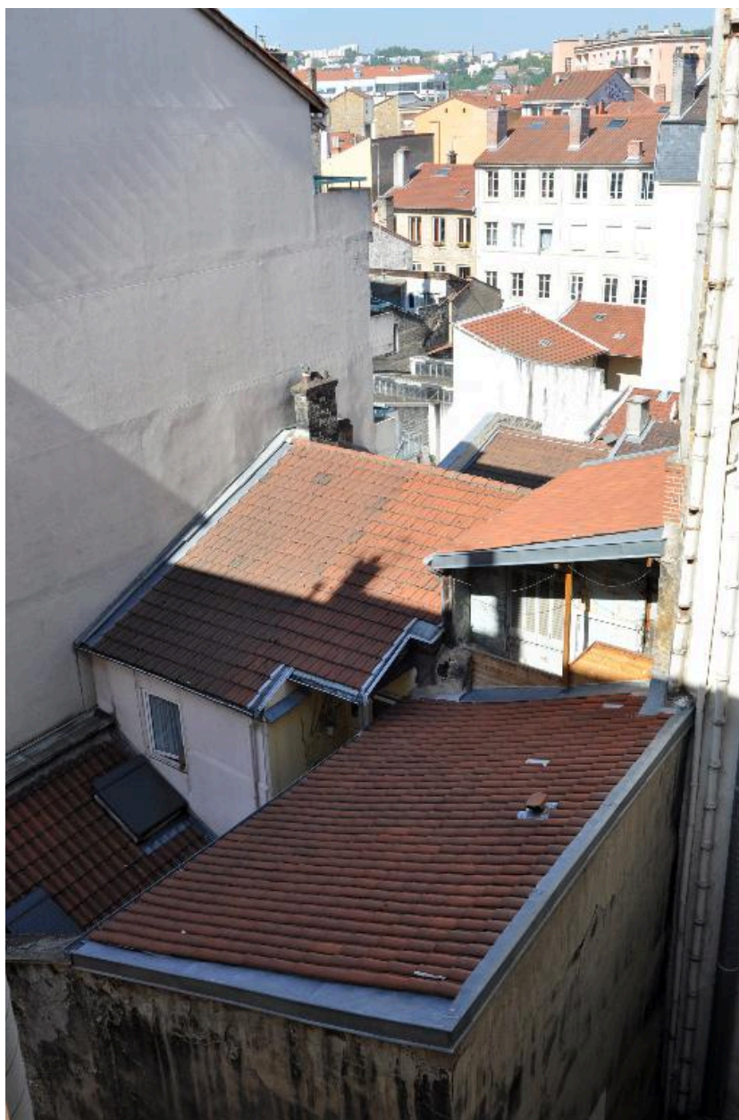
Vue de toiture, bâtiments sur cour