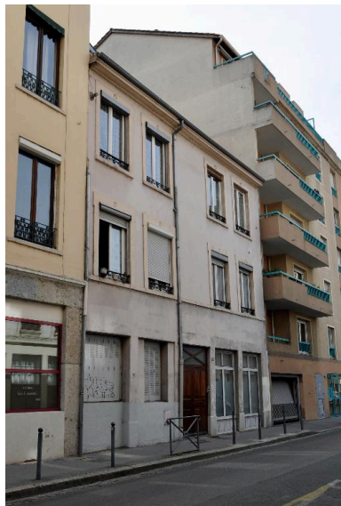
Vue générale, élévation sur rue IVR84_20176901421NUCA