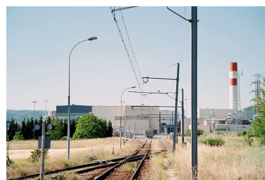
façades nord et embranchement ferroviaire