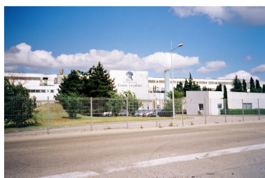
façade est IVR82_20042600112NUCA