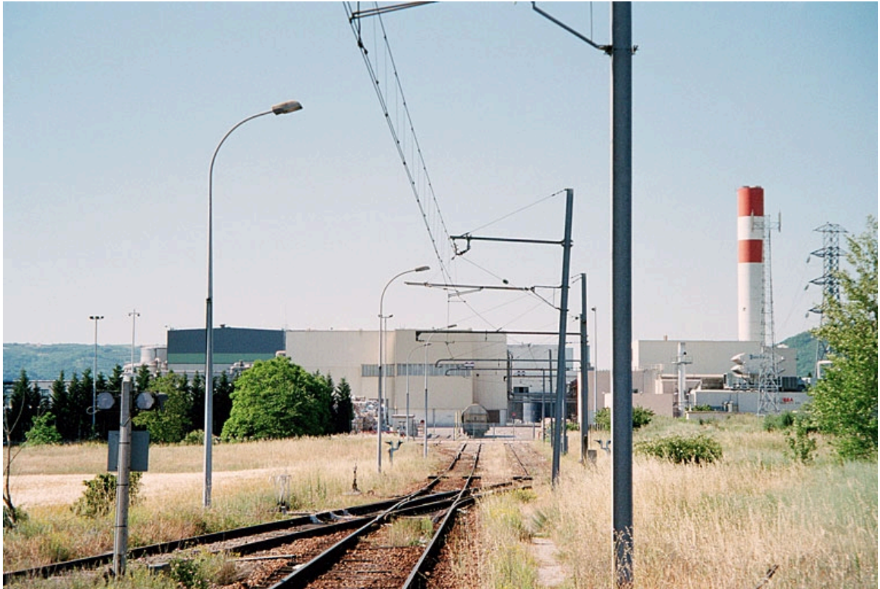
façades nord et embranchement ferroviaire