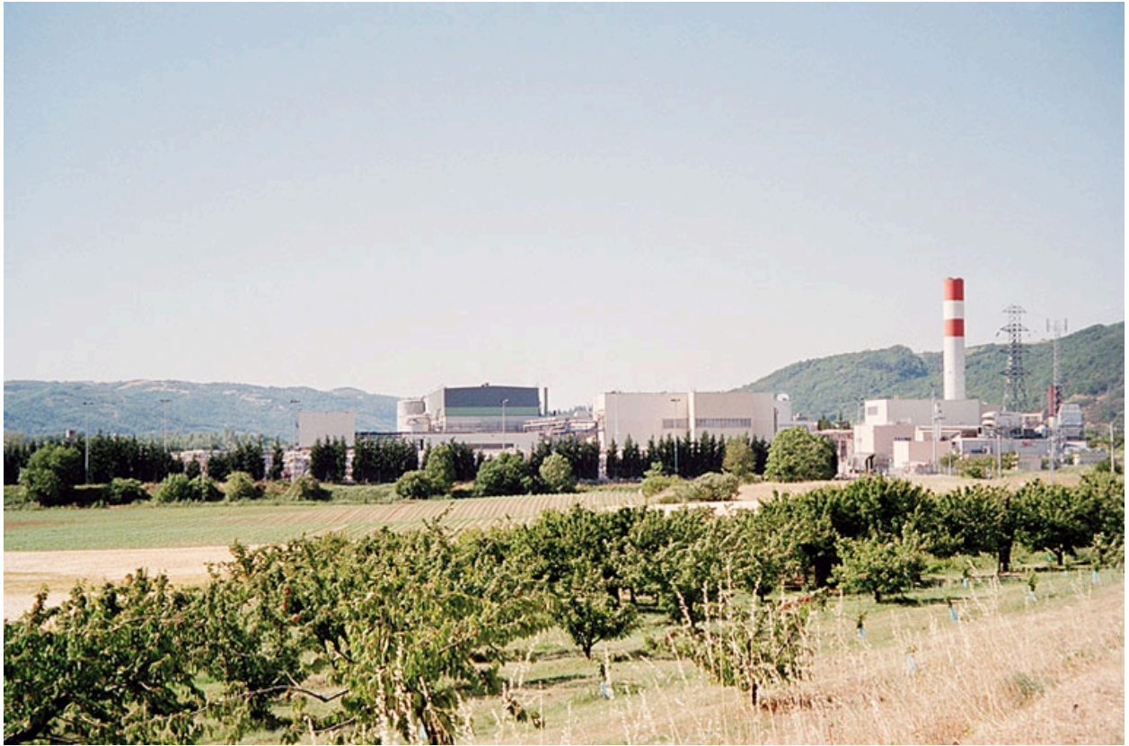
Vue générale nord-ouest