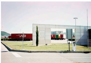
Enseigne, parking des camions IVR82_20042600101ZE