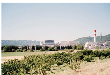
Vue générale nord-ouest IVR82_20042600098ZE