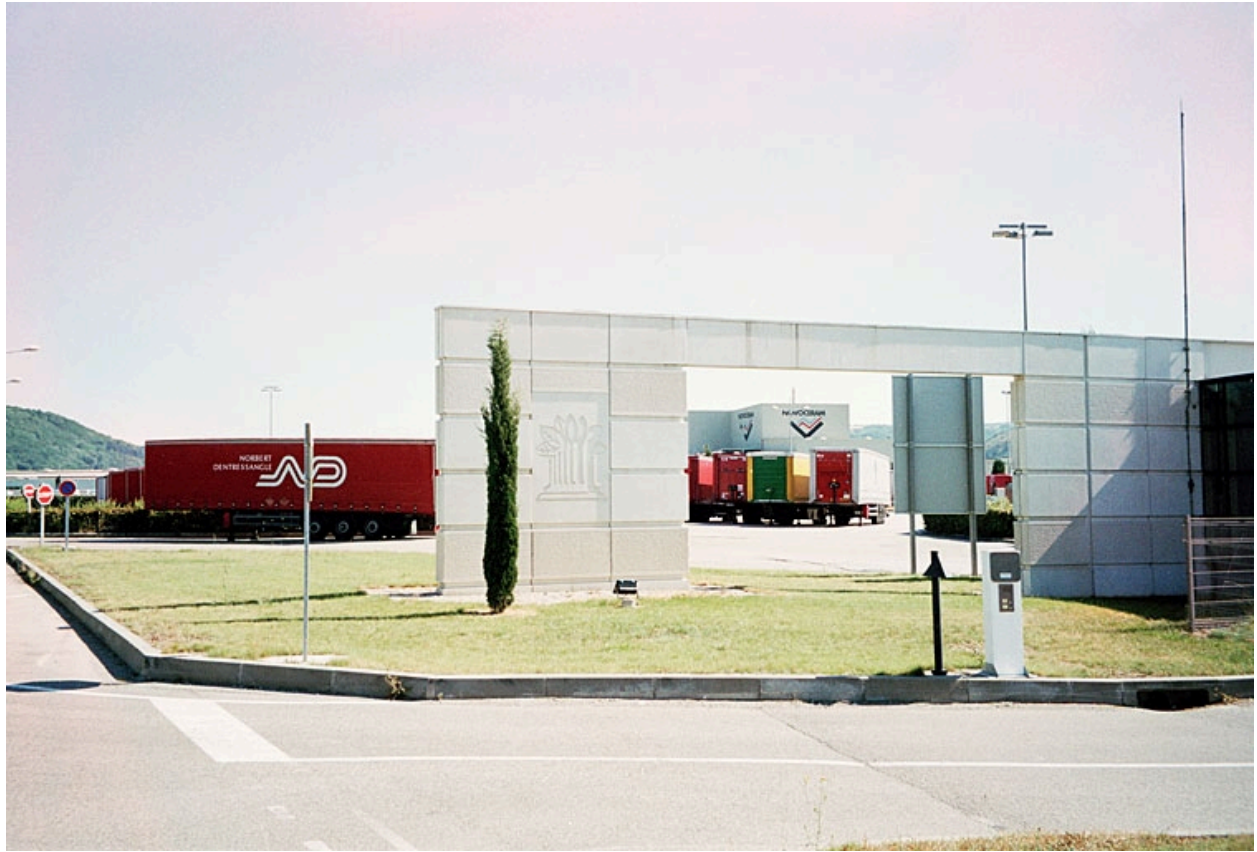
Enseigne, parking des camions