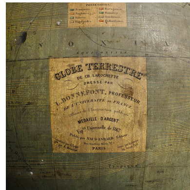
Inscription portée sur le globe terrestre IVR84_20256902003NUCA