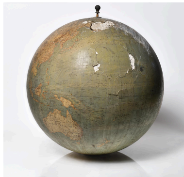
Globe terrestre, vue 2 IVR84_20256902001NUCAQ