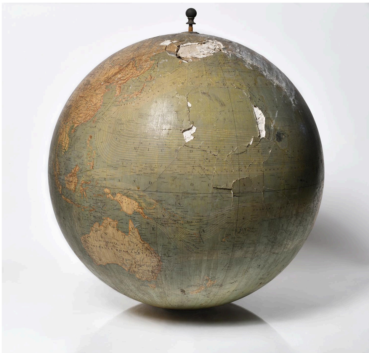
Globe terrestre, vue 2