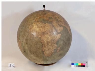
Globe, IVR84_20256901244NUCA