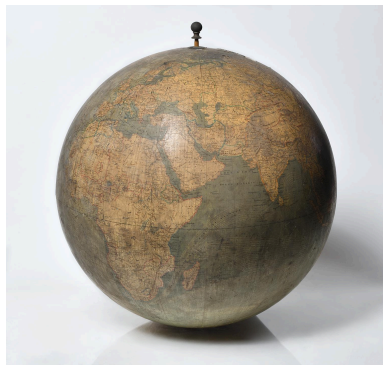
Globe terrestre