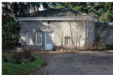
Vue du pavillon de jardin IVR82_20076900003NUCA