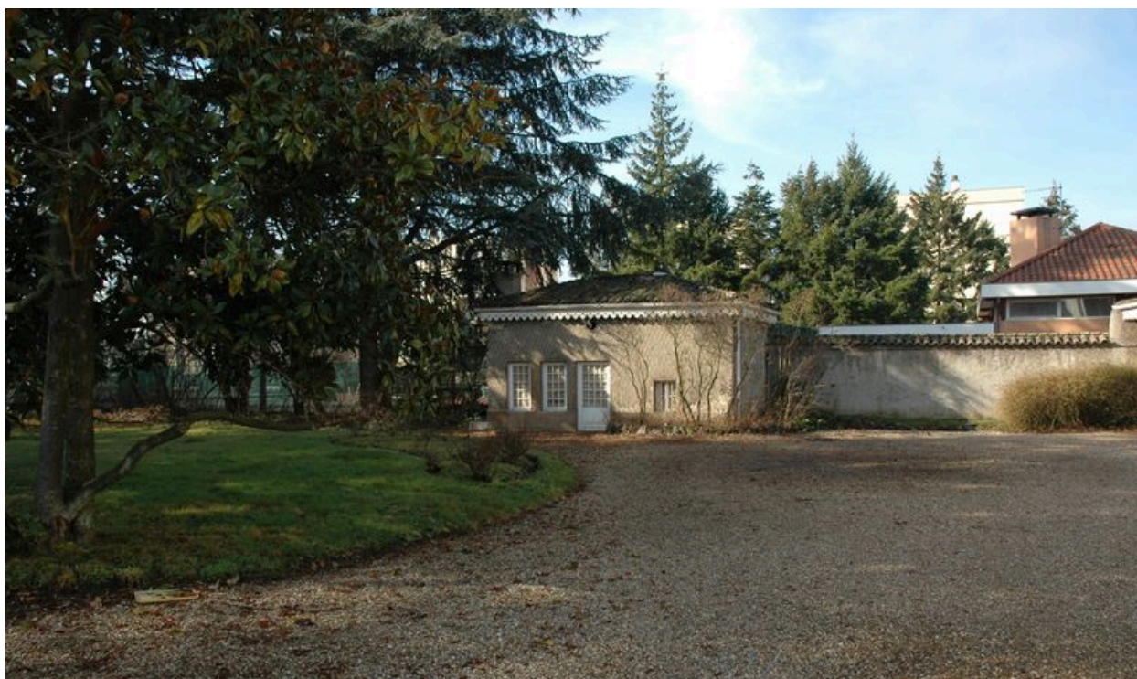
Vue du pavillon de jardin