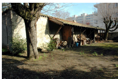
Resserre IVR82_20076900009NUCA