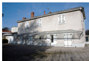
Vue de l'élévation antérieure, côté jardin, depuis le sud est IVR82_20076900006NUCA