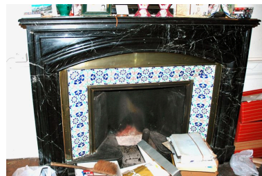
Manteau de cheminée, pièce servant de bureau, rez-de-jardin