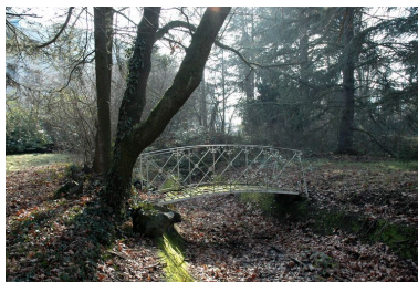
Vue du pont de jardin