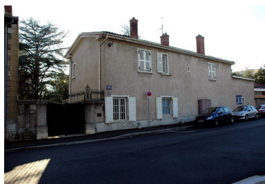
Vue de l'élévation postérieure, côté rue IVR82_20066900784NUCA