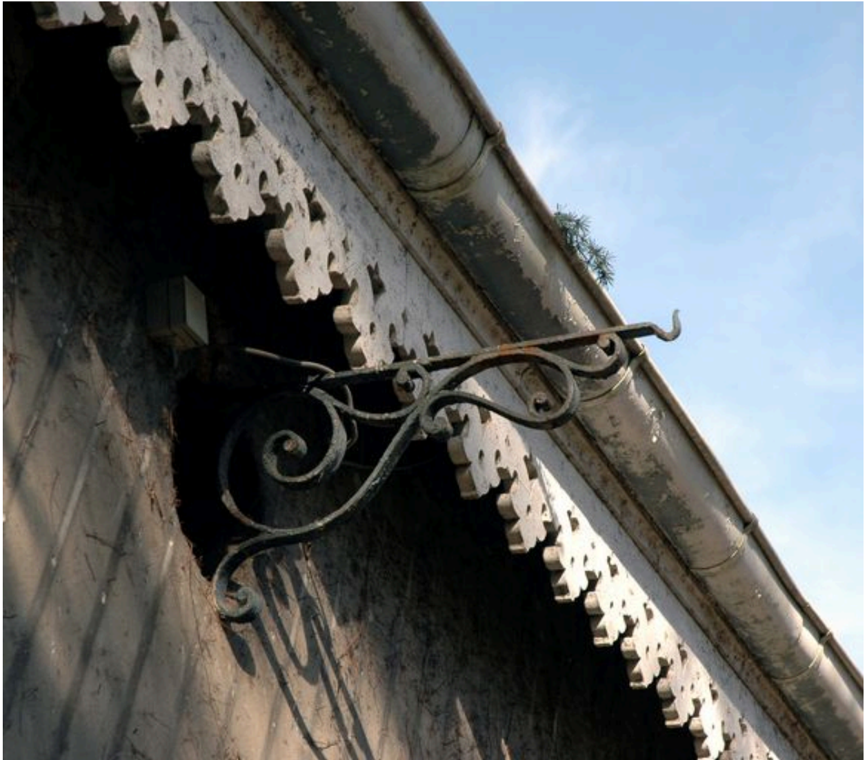
Pavillon de jardin, détail de console en fer forgé