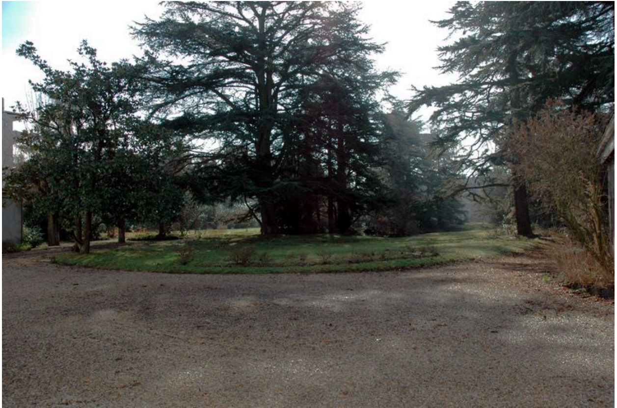
Vue du jardin depuis le nord