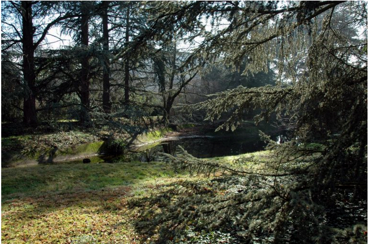
Vue du jardin et d'une partie de la pièce d'eau depuis le nord ouest