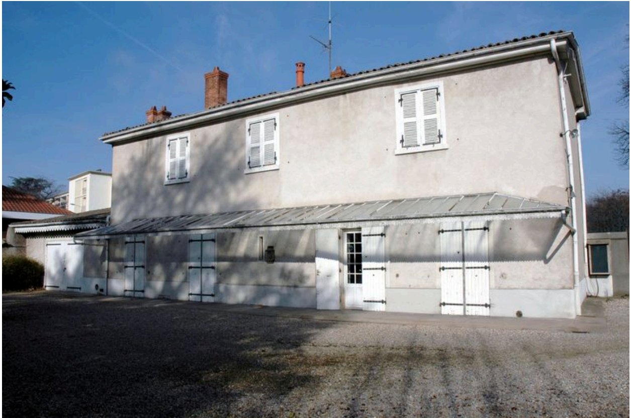
Vue de l'élévation antérieure, côté jardin, depuis le sud est