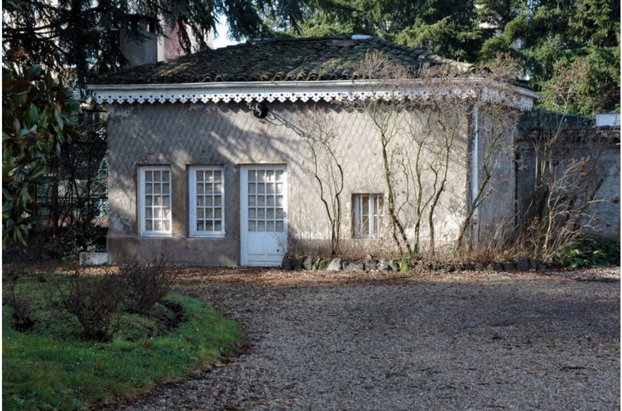
Vue du pavillon de jardin