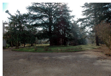
Vue du jardin depuis le nord