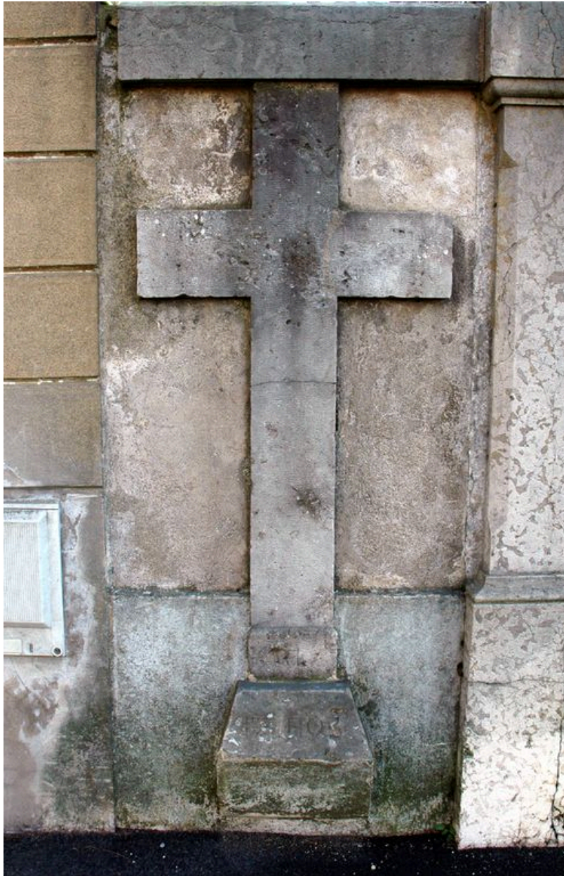
Croix encastrée dans le mur du portail