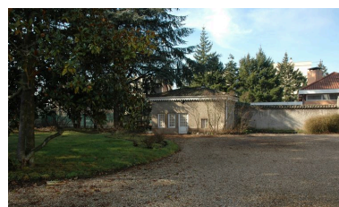
Vue du pavillon de jardin IVR82_20076900002NUCA