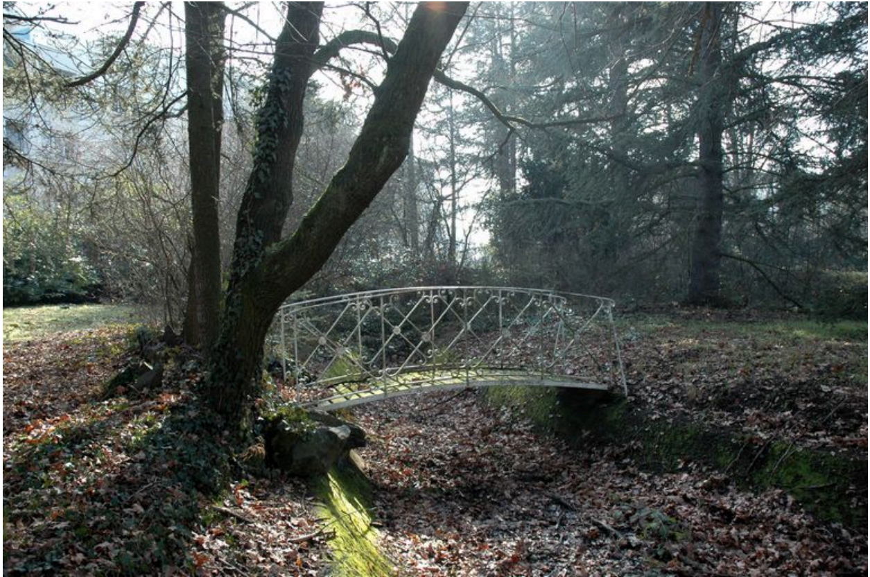
Vue du pont de jardin