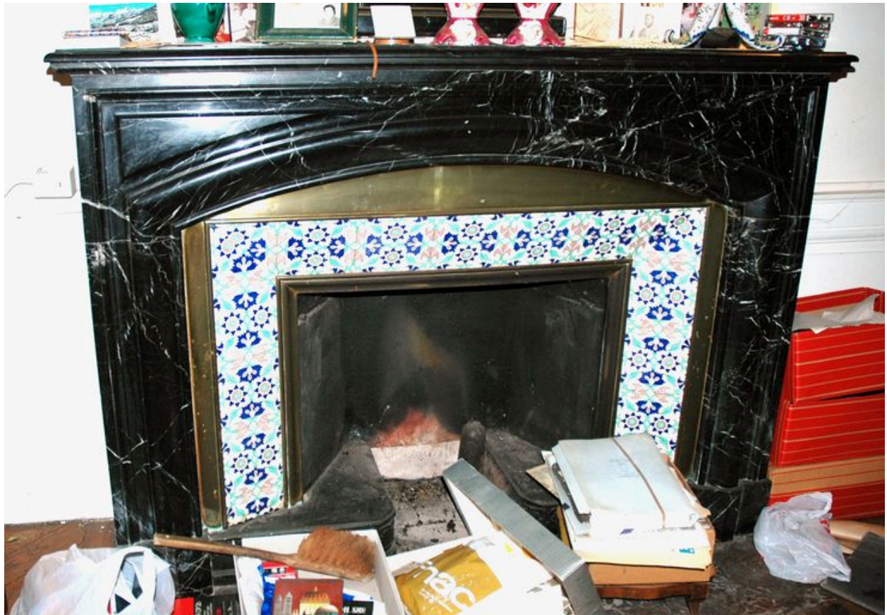
Manteau de cheminée, pièce servant de bureau, rez-de-jardin