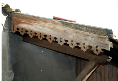
Resserre : détail du lambrequin IVR82_20076900010NUCA