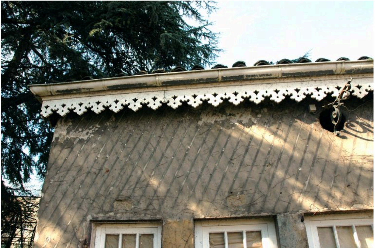
Pavillon de jardin, détail du lambrequin