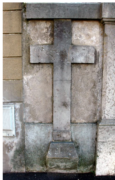
Croix encastrée dans le mur du portail