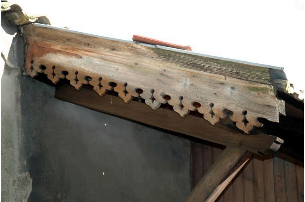
Resserre : détail du lambrequin