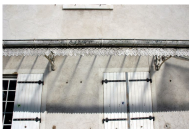
Elévation antérieure : détail de la marquise