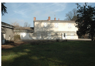
Vue de l'élévation antérieure, côté jardin IVR82_20076900001NUCA