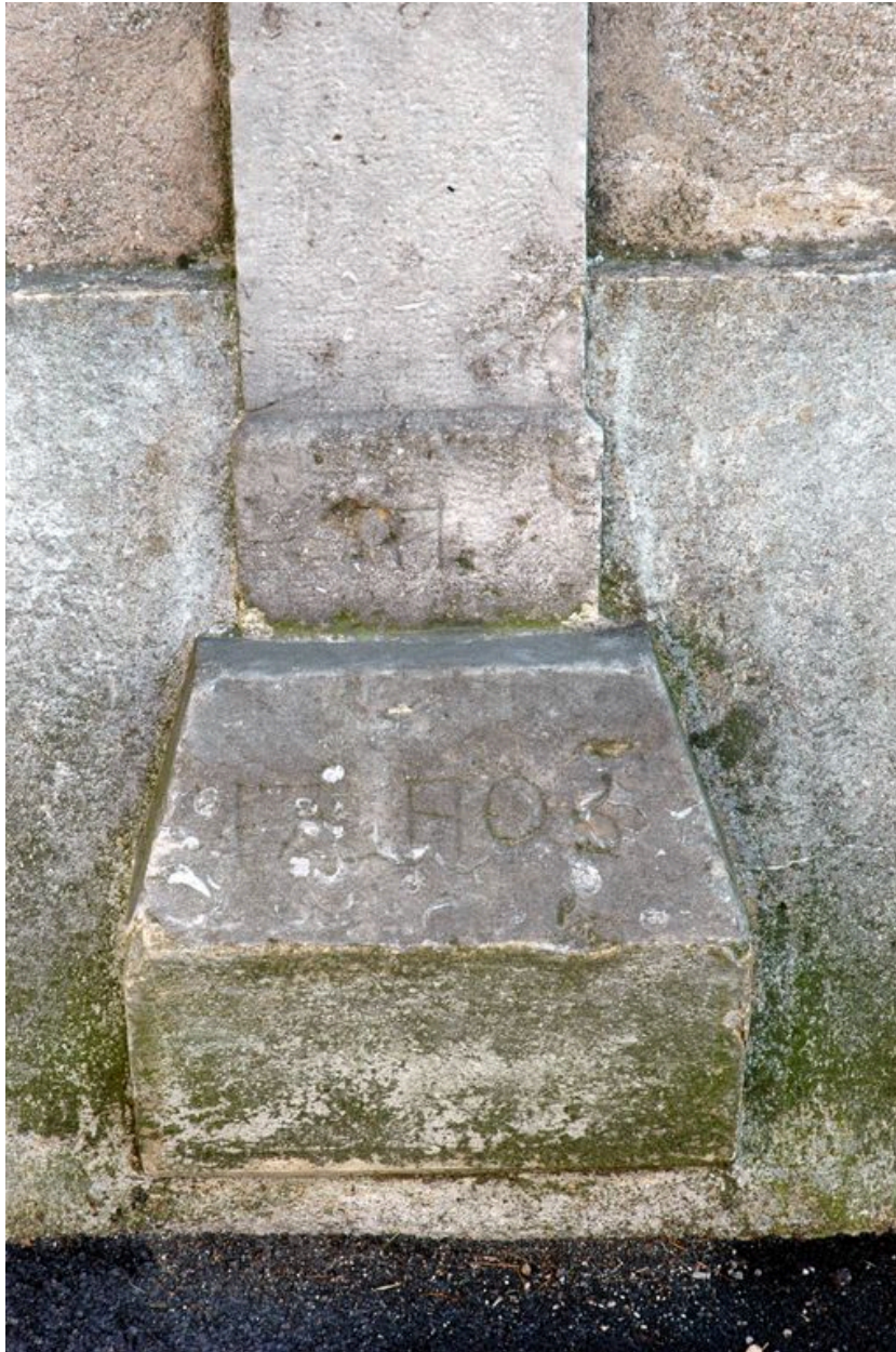
Détail de la base de la croix