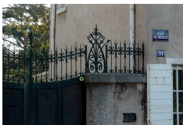
Détail du portail