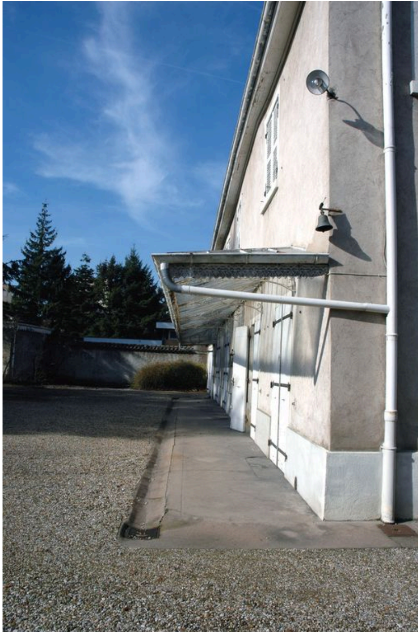
Elévation antérieure, côté jardin : vue de la marquise