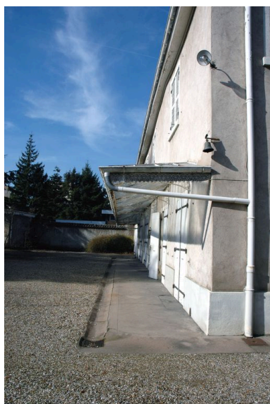
Elévation antérieure, côté jardin : vue de la marquise