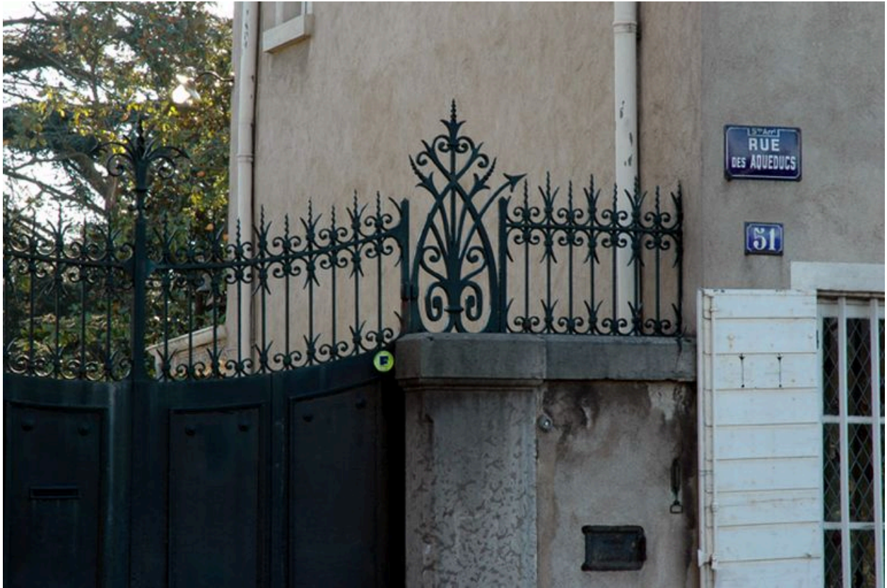
Détail du portail