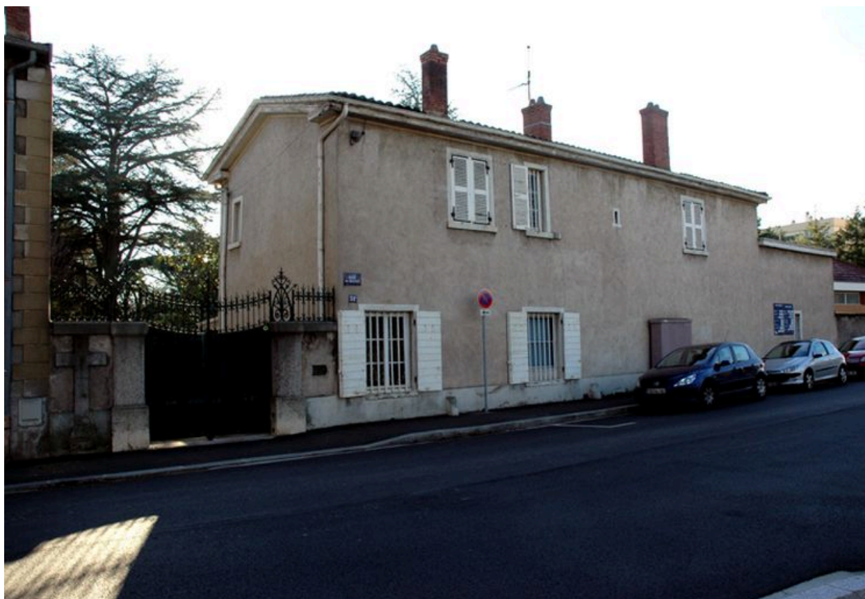
Vue de l'élévation postérieure, côté rue