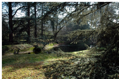
Vue du jardin et d'une partie de la pièce d'eau depuis le nord ouest