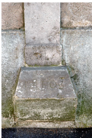
Détail de la base de la croix IVR82_20066900783NUCA