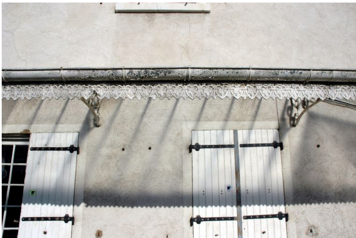
Elévation antérieure : détail de la marquise