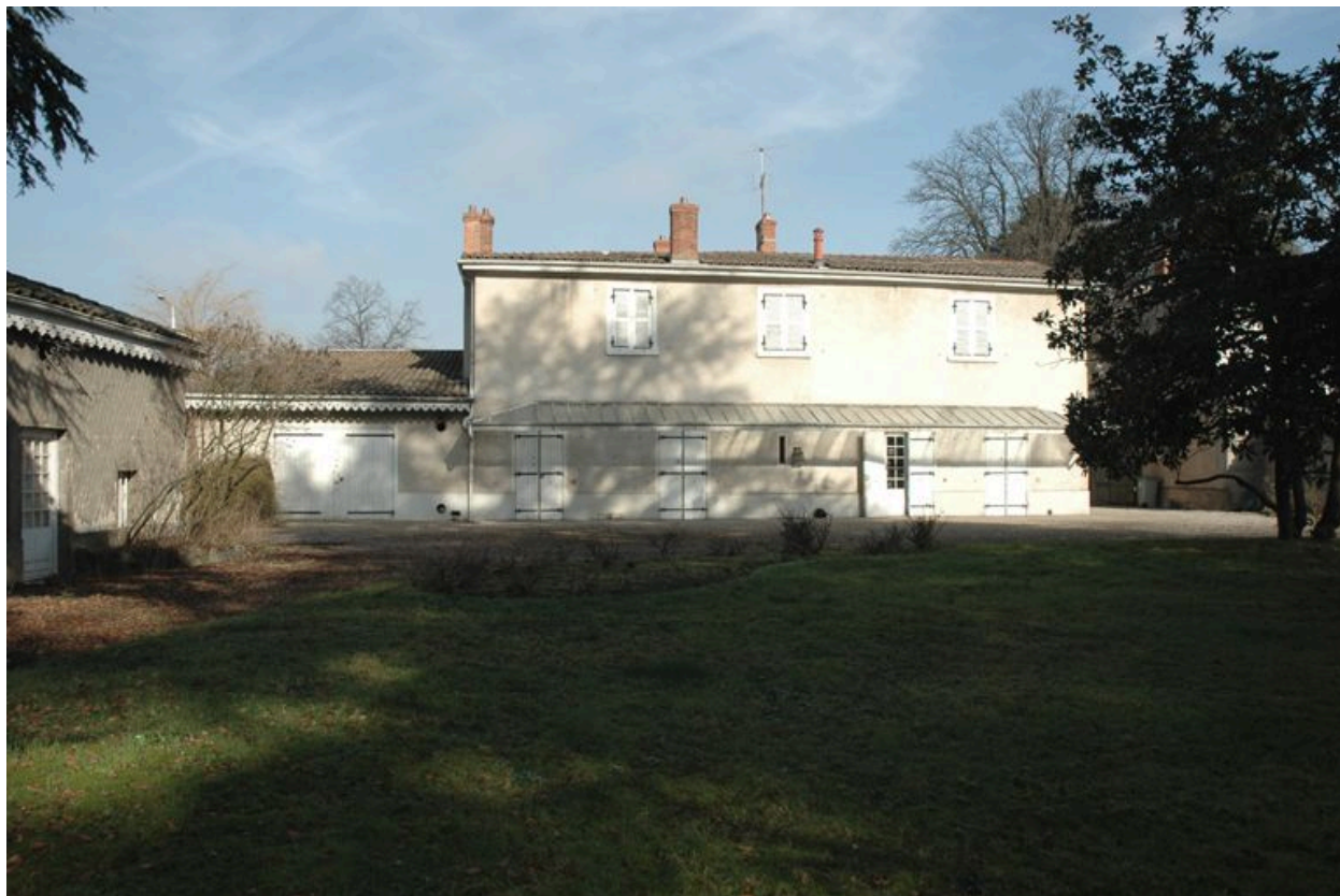
Vue de l'élévation antérieure, côté jardin