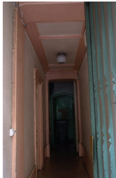
L'allée IVR82_20046905258NUCA