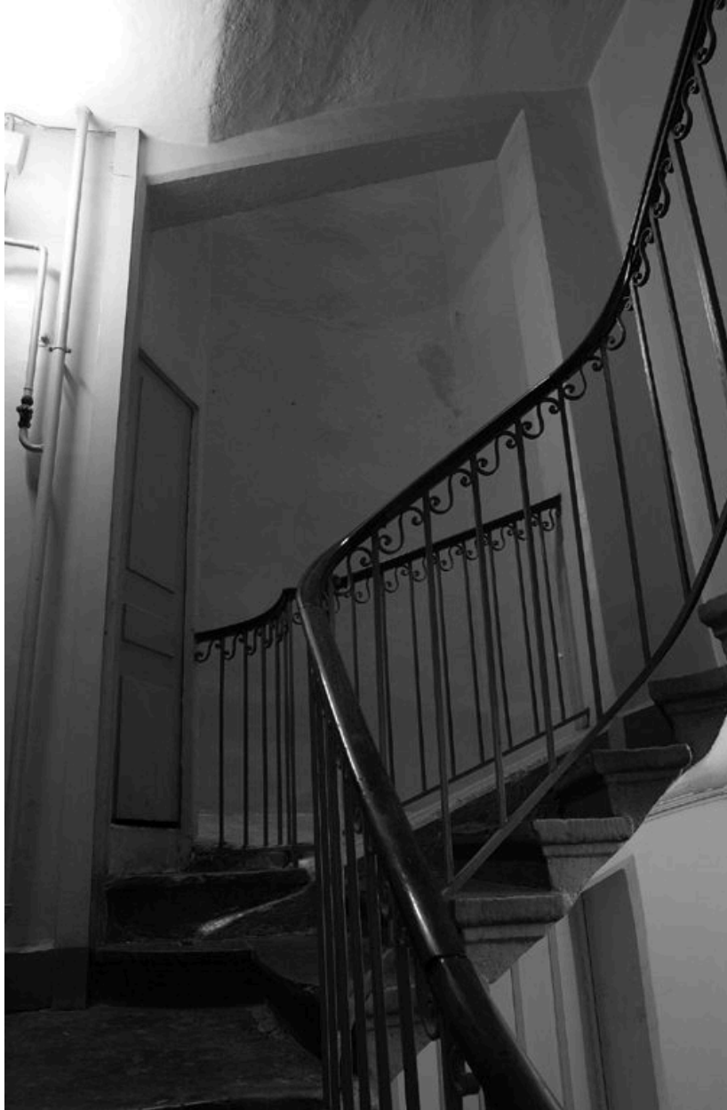
L'escalier et la cour en arrière-plan