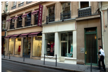
Le rez-de-chaussée