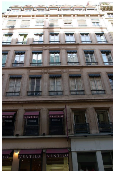
Vue générale IVR82_20046905257NUCA