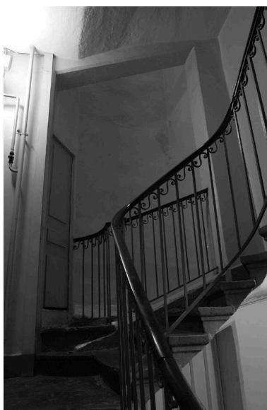
L'escalier et la cour en arrière-plan IVR82_20046905256NUC