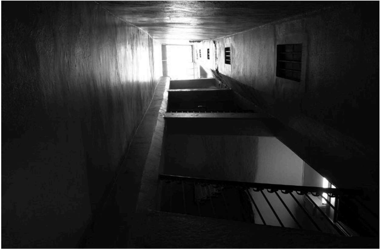
La cour en contre-plongée