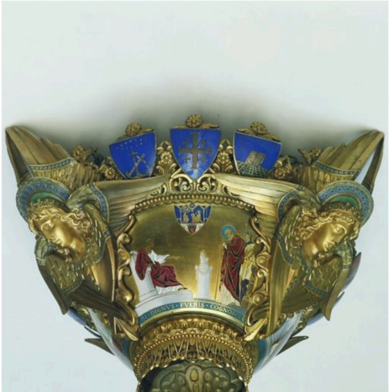
Cuve, scène symbolisant la Foi