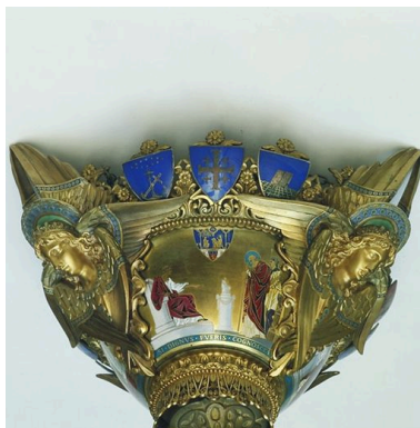
Cuve, scène symbolisant la Foi IVR82_20016901477XA