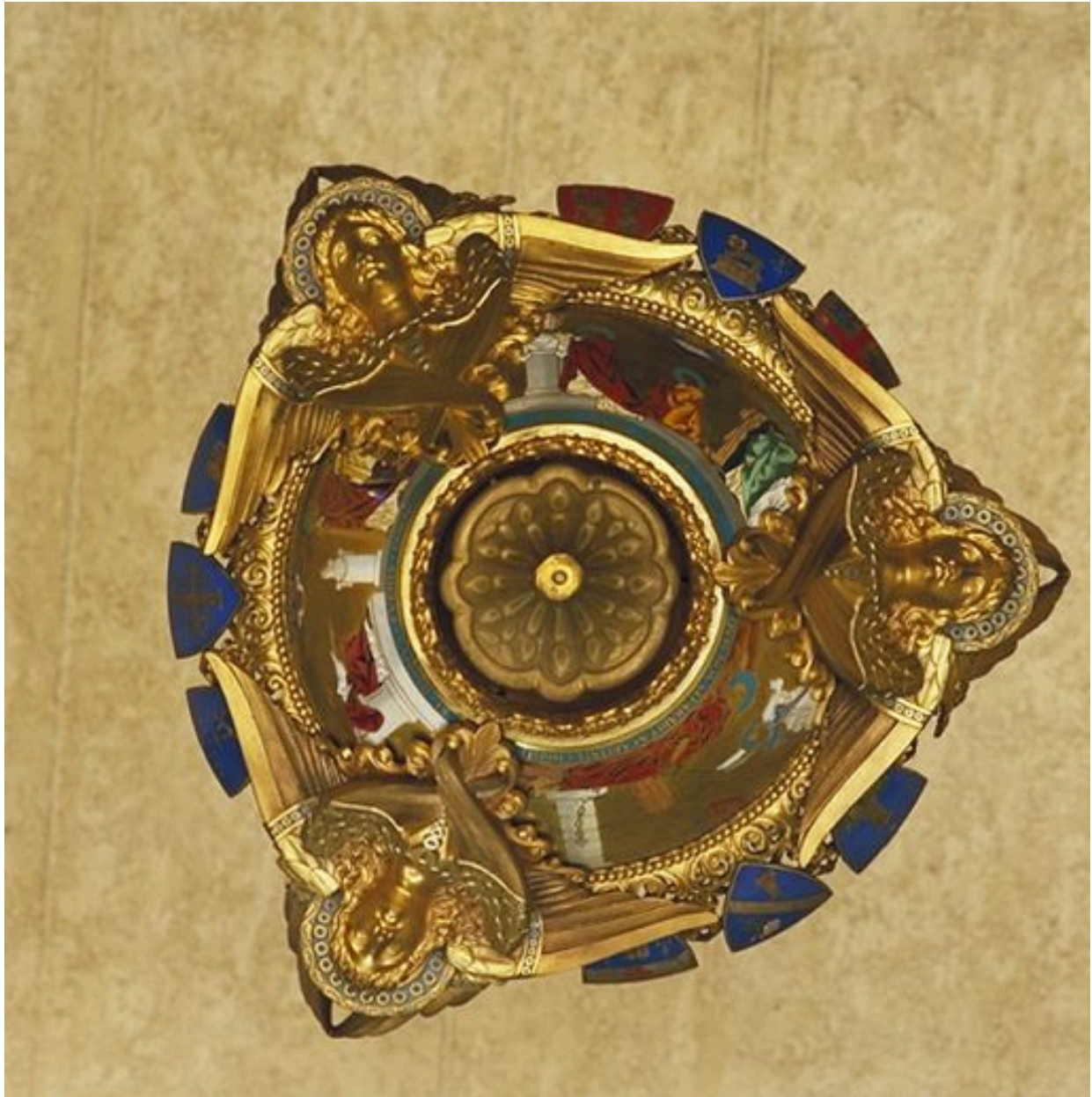
Cuve vue par-dessous