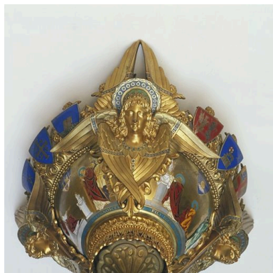
Cuve, détail d'un séraphin