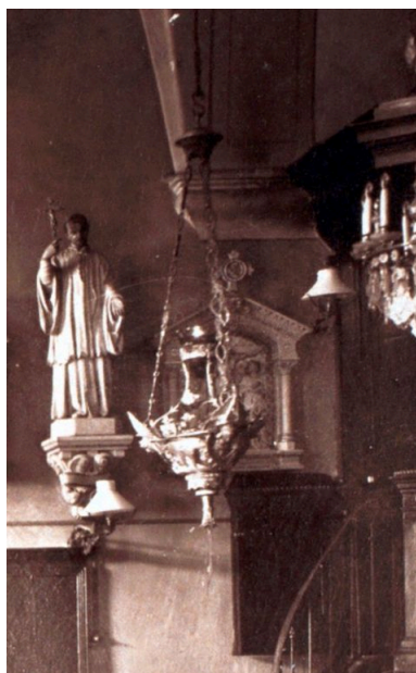
Antiquaille. La chapelle, ca 1910-1920. Détail de la lampe