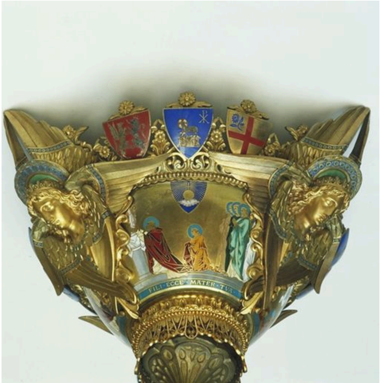
Cuve, scène symbolisant l'Espérance