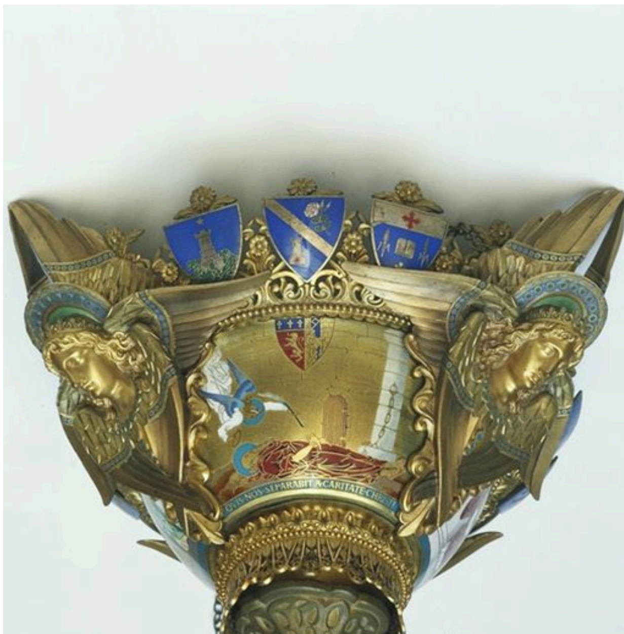
Cuve, scène symbolisant la Charité