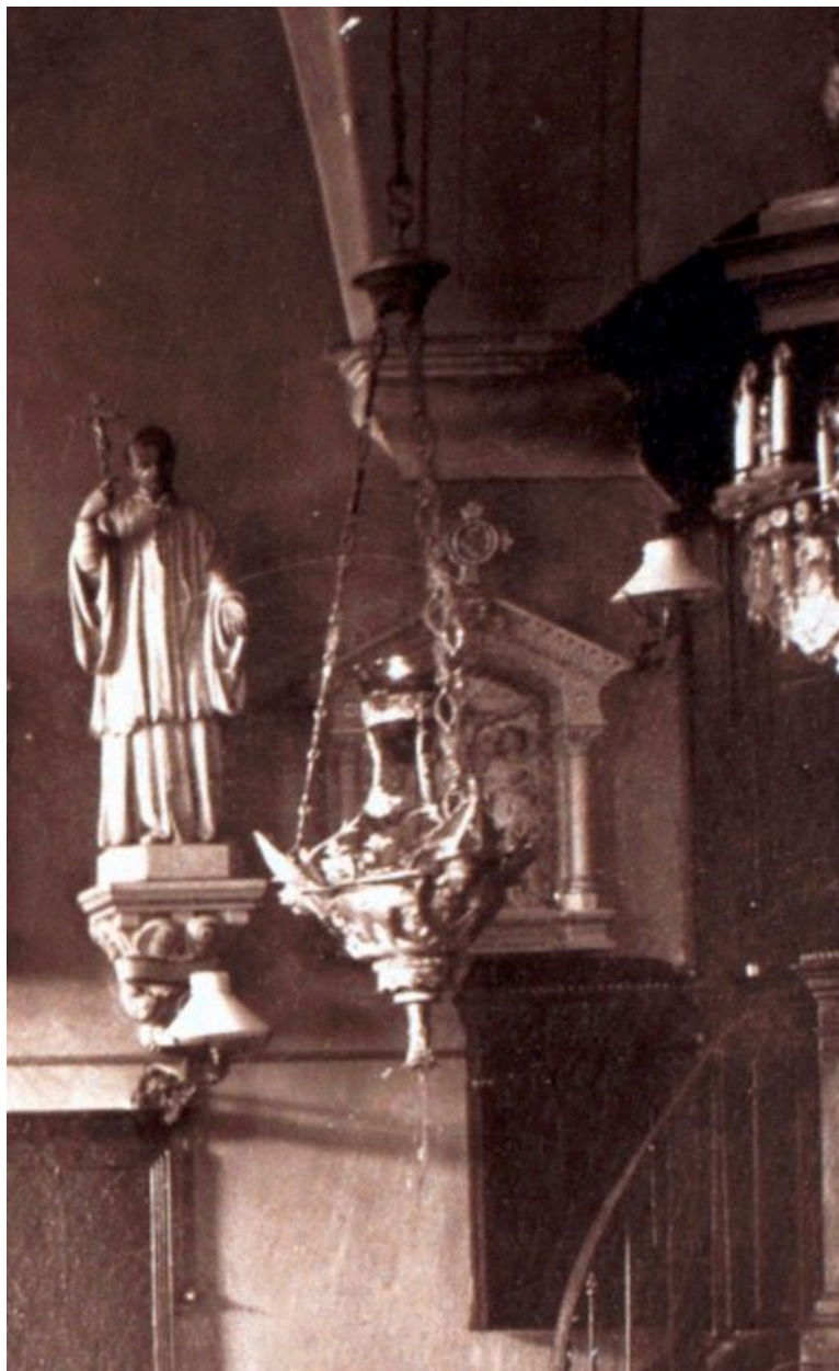
Antiquaille. La chapelle, ca 1910-1920. Détail de la lampe