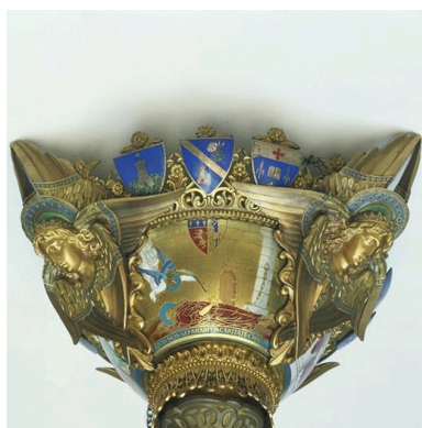
Cuve, scène symbolisant la Charité IVR82_20016901473XA