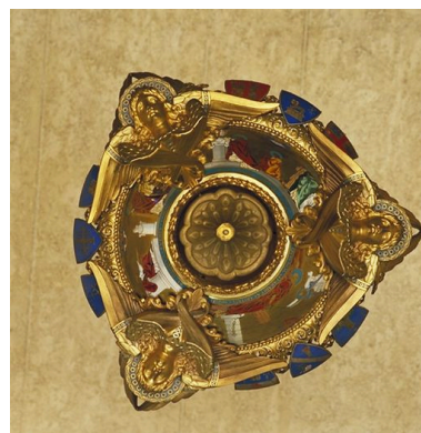
Cuve vue par-dessous IVR82_20016901469XA