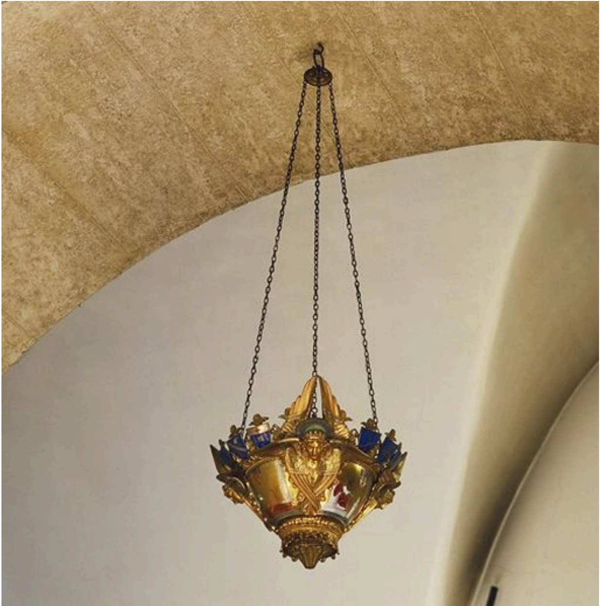
Vue générale de la lampe dans son état actuel