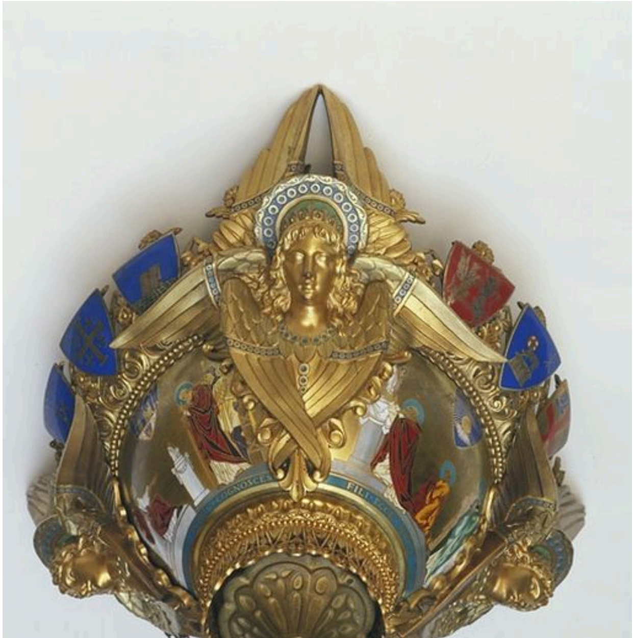
Cuve, détail d'un séraphin