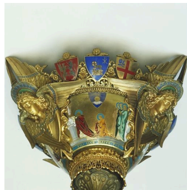
Cuve, scène symbolisant l'Espérance