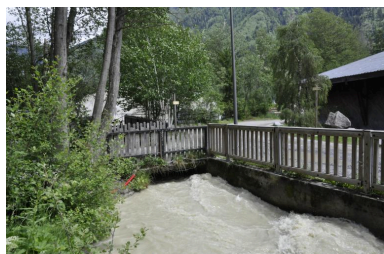
Vue de la face aval de la passerelle IVR84_20207401312NUCA