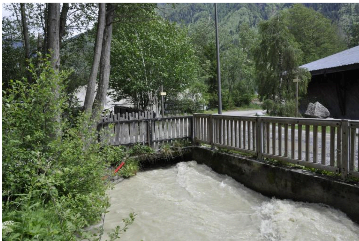
Vue de la face aval de la passerelle