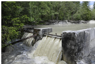
Les trop-pleins aménagés en sortie de bassin