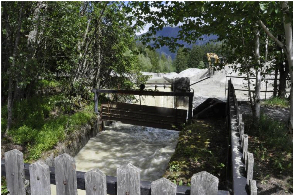
Amorce du canal de fuite du bassin de la gravière