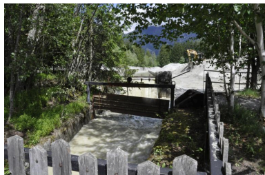
Amorce du canal de fuite du bassin de la gravière IVR84_20207401309NUCA