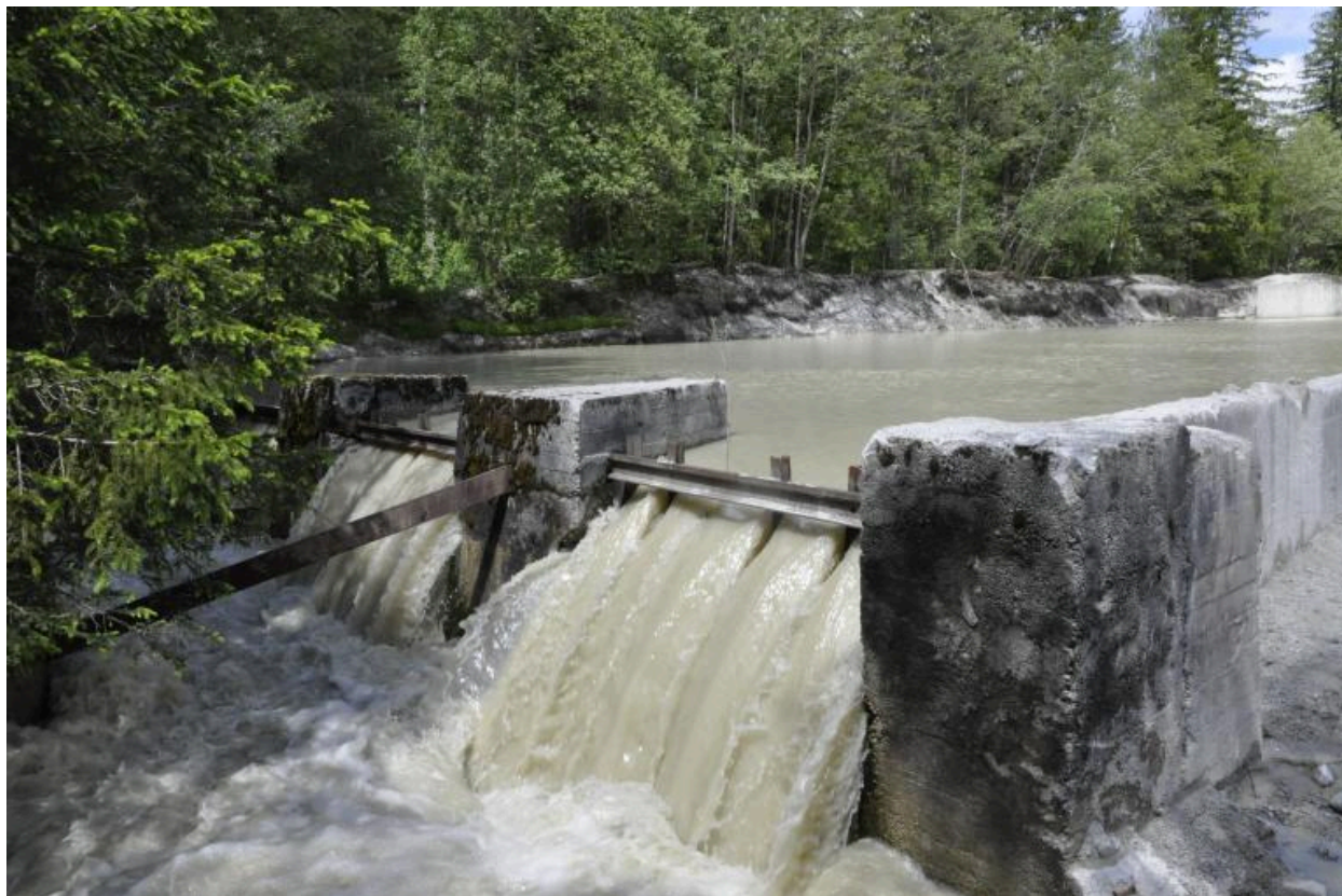
Les trop-pleins aménagés en sortie de bassin