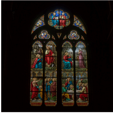
Baie 7 : scènes de la vie du Christ IVR82_20074200760NUCA