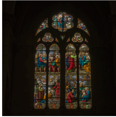
Baie 8 : scènes de la vie de la Vierge IVR82_20074200759NUCA