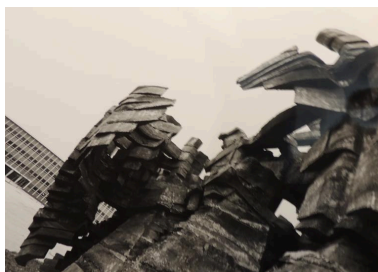
Œuvre in situ (1975) (AN 20020101/89). IVR84_20206900417NUCB