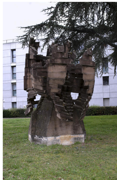
Vue de dos IVR84_20216900559NUCA