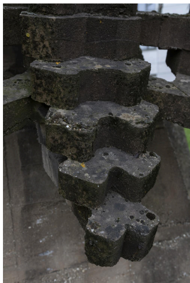
Détail. IVR84_20216900560NUCA