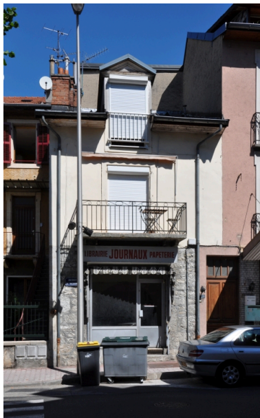
Vue générale IVR82_20117300490NUCA