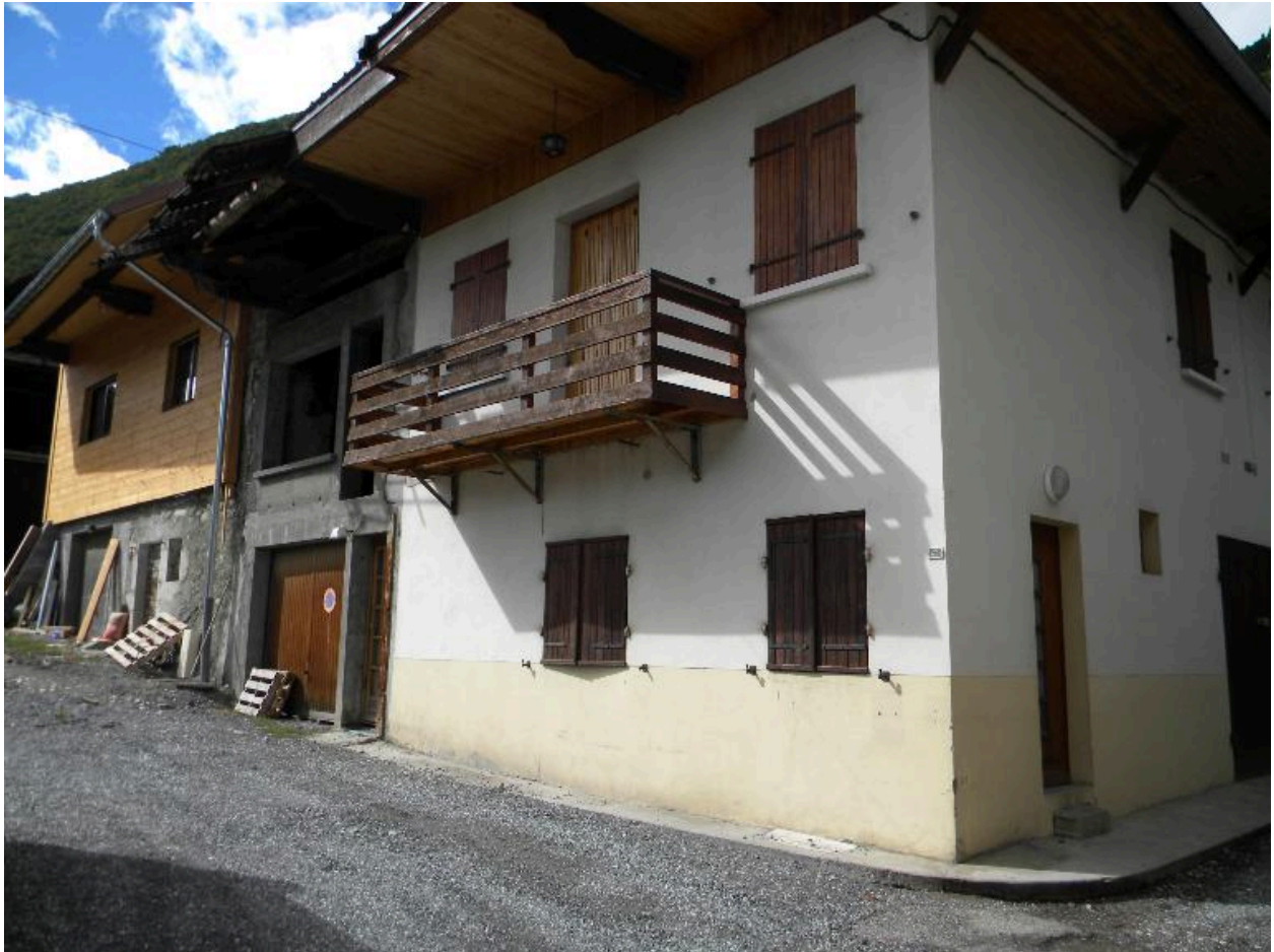
Vue de trois-quarts d'anciennes fermes mitoyennes (2008 C3 1365,1666)