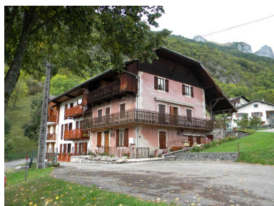
Vue d'une ancienne aux chainages peints (2008 C3 303) IVR82_20137400981NUCA