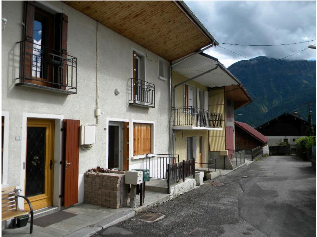
Alignement d'anciennes fermes mitoyennes (2008 C3 394, 401)