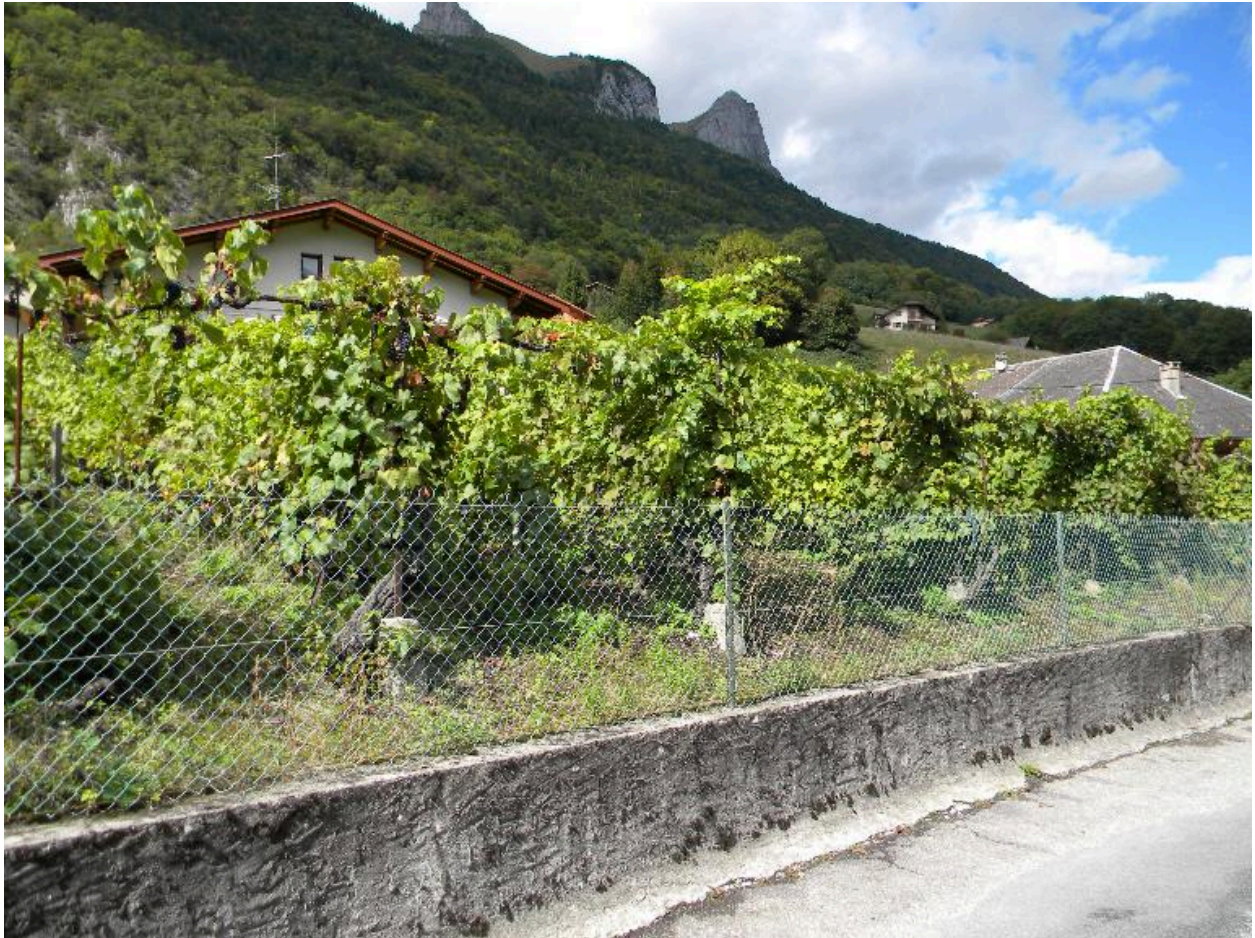
Parcelle de vigne préservée au coeur du hameau (2008 C3 357)