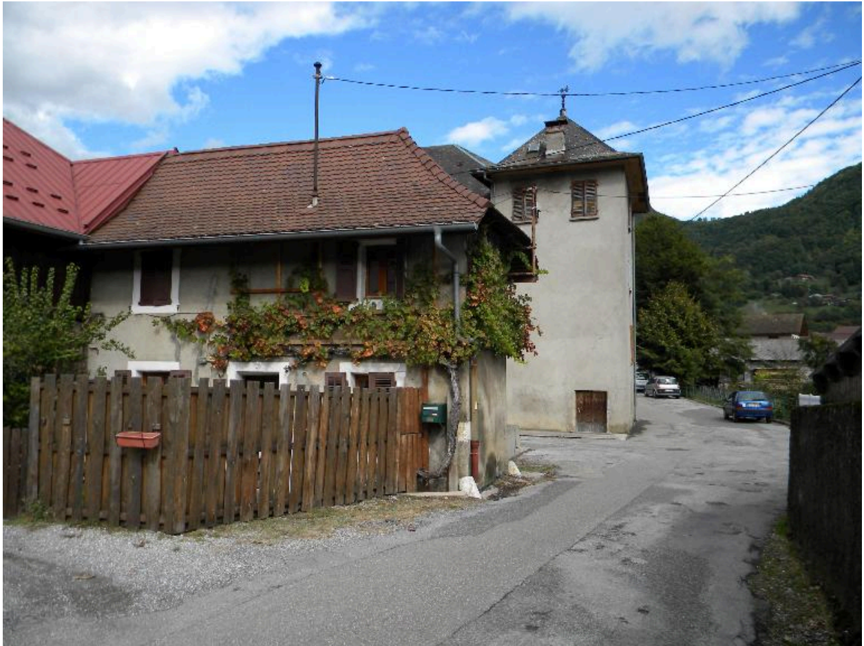
Vue d'une maison de village aux encadrements peints (2008 C3 402)