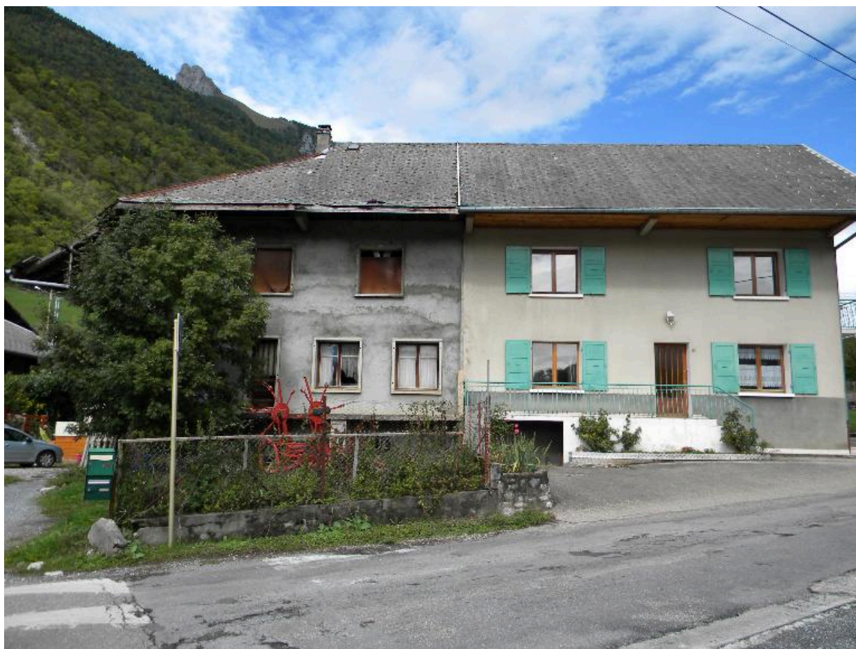
Façade principale d'une ferme mitoyenne (2008 C3 319, 321)