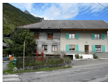
Façade principale d'une ferme mitoyenne (2008 C3 319, 321)