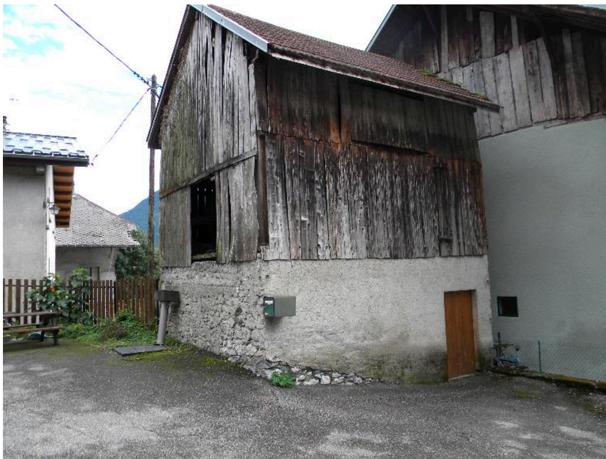
Vue d'une petite grange au milieu de fermes transformées (2008 C3 2356)