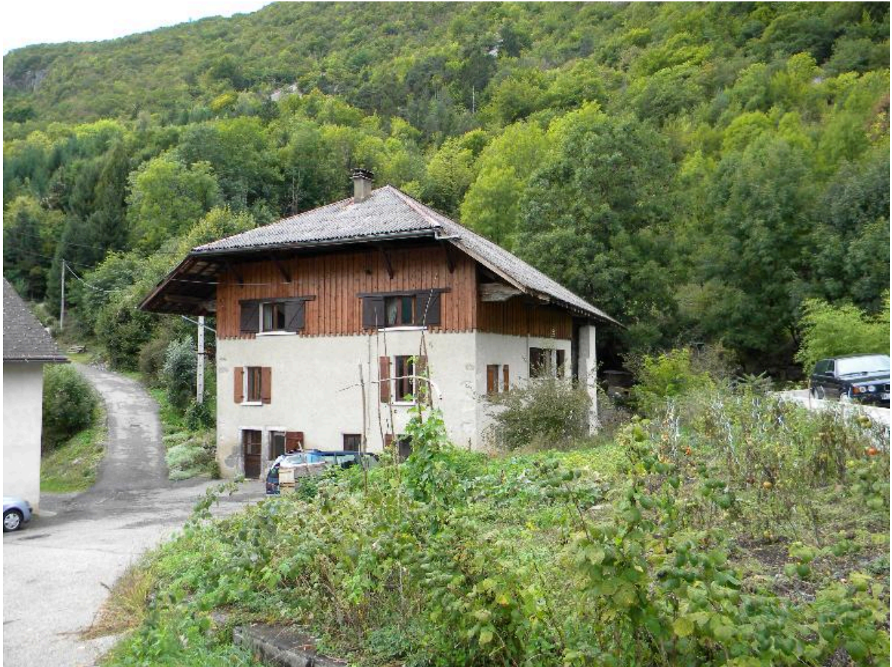
Vue de trois-quarts d'une ancienne ferme (2008 C3 300)