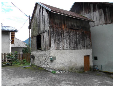
Vue d'une petite grange au milieu de fermes transformées (2008 C3 2356) IVR82_20137400982NUCA