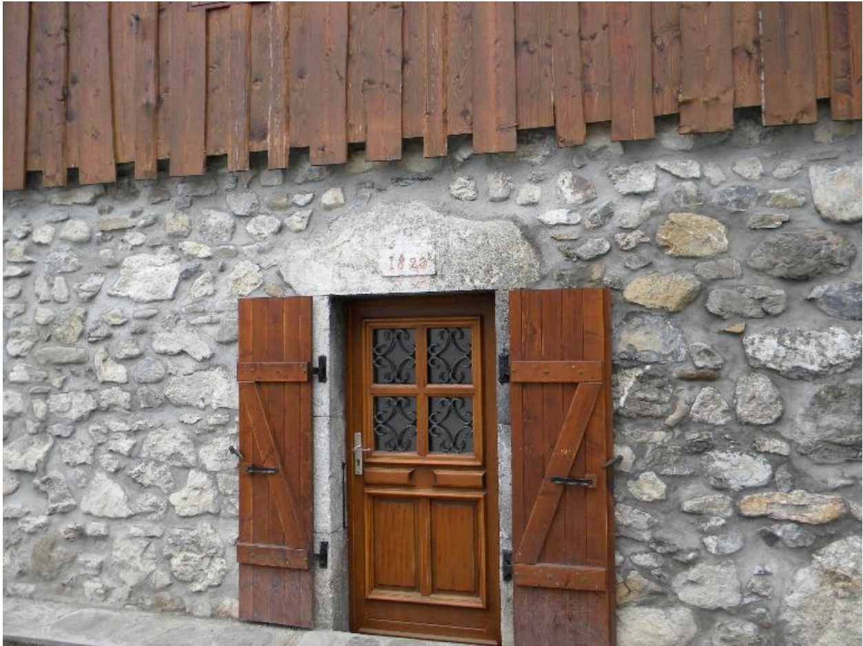
Vue d'un linteau de porte d'une ancienne ferme portant la date de 1823 (2008 C3 324)