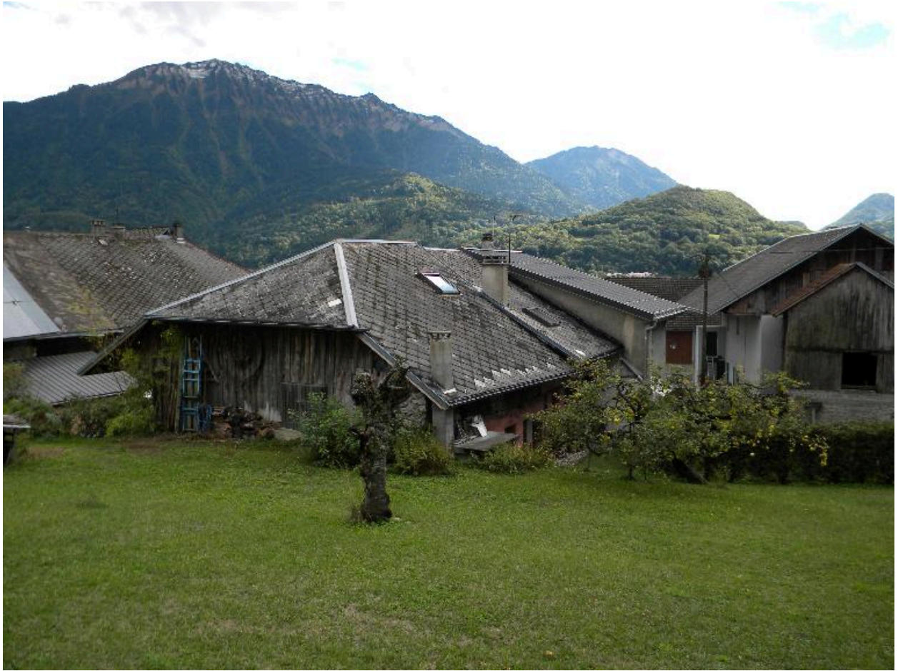
Vue d'une partie du village du Noyeray avec le massif des Bauges en arrière-plan.