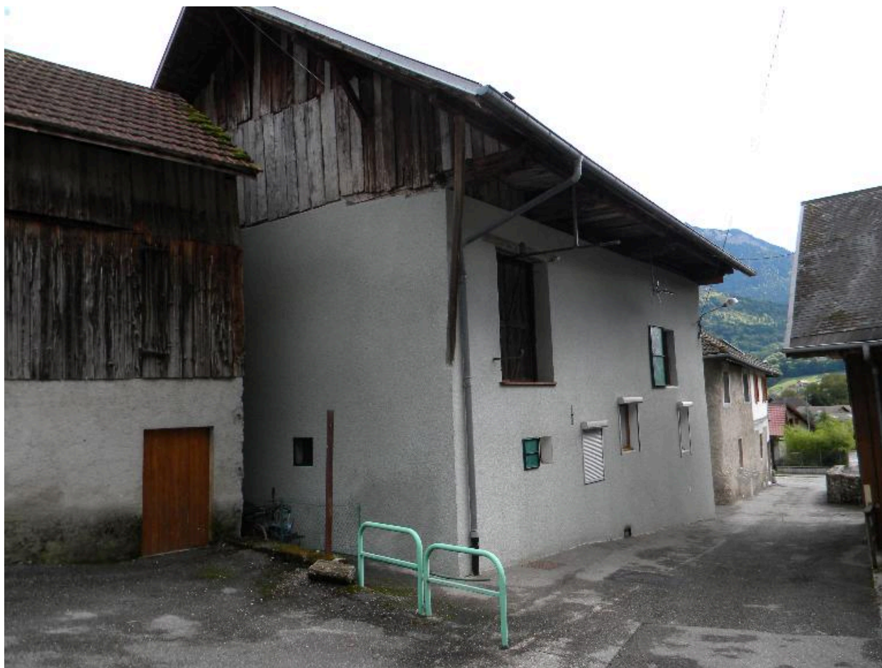
Vue d'une ancienne grange avec la place de l'ancien four à pain devant (2008 C3 2356)