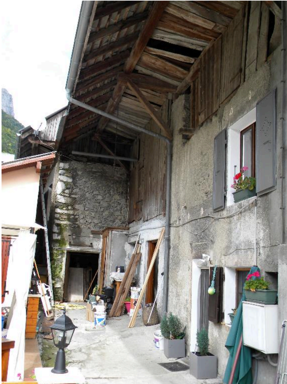
Façade principale d'une ancienne ferme (2008 C3 310).