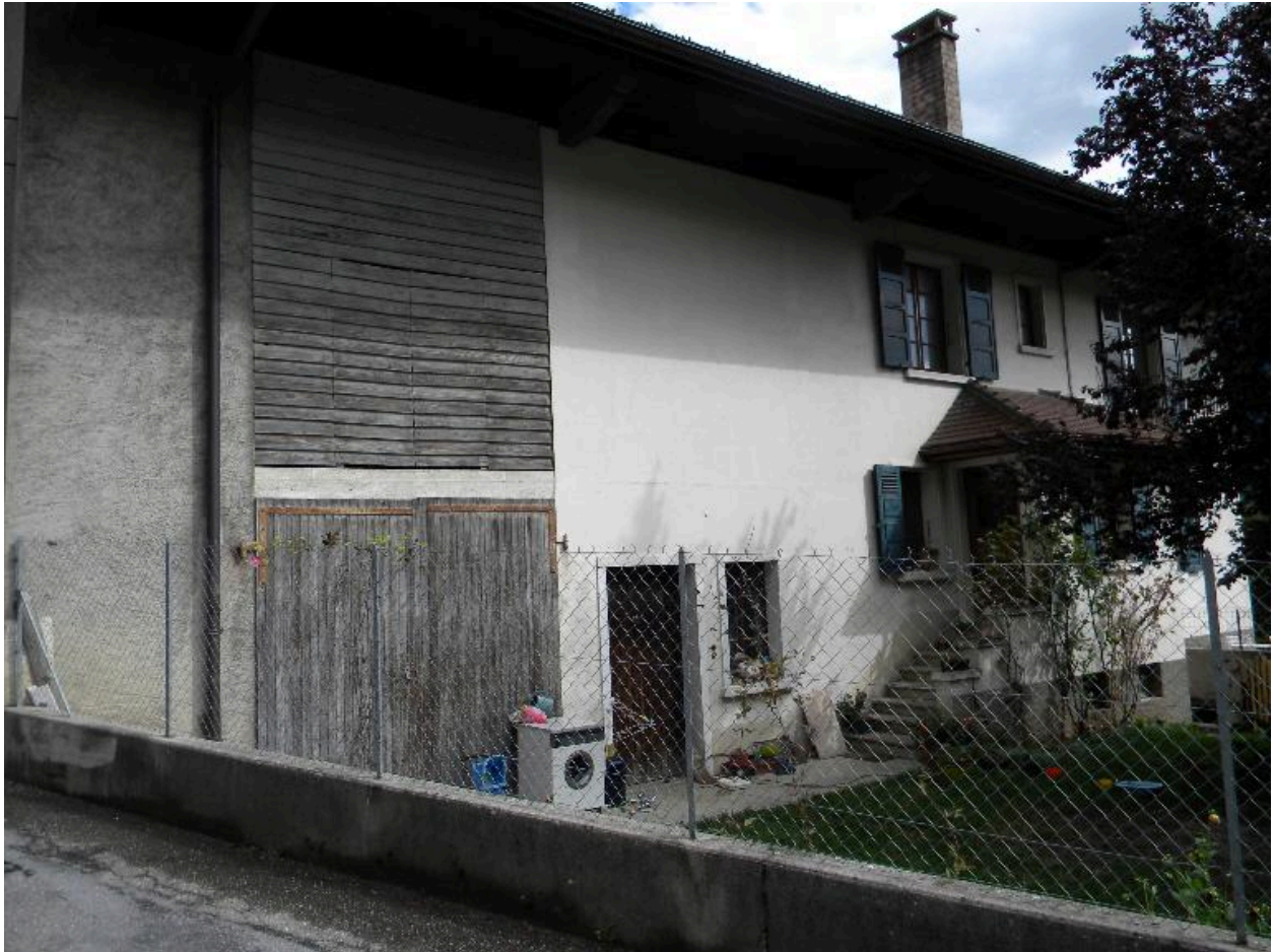
Façade principale d'une ancienne ferme (2008 C3 2648)