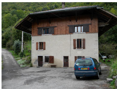
Vue du mur pignon d'une ancienne ferme (2008 C3 300)