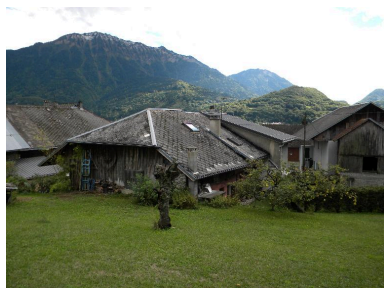
Vue d'une partie du village du Noyeray avec le massif des Bauges en arrière-plan.