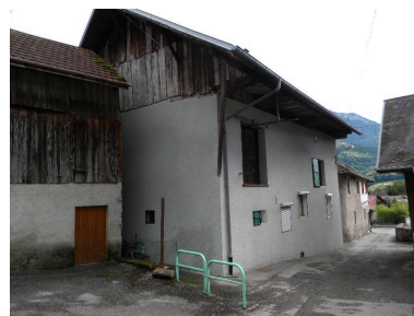
Vue d'une ancienne grange avec la place de l'ancien four à pain devant (2008 C3 2356) IVR82_20137400983NUCA