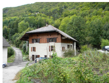
Vue de trois-quarts d'une ancienne ferme (2008 C3 300) IVR82_20137400980NUCA