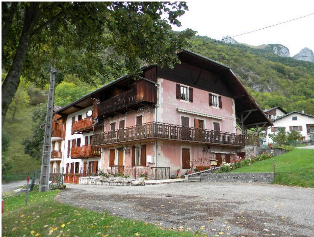
Vue d'une ancienne aux chainages peints (2008 C3 303)