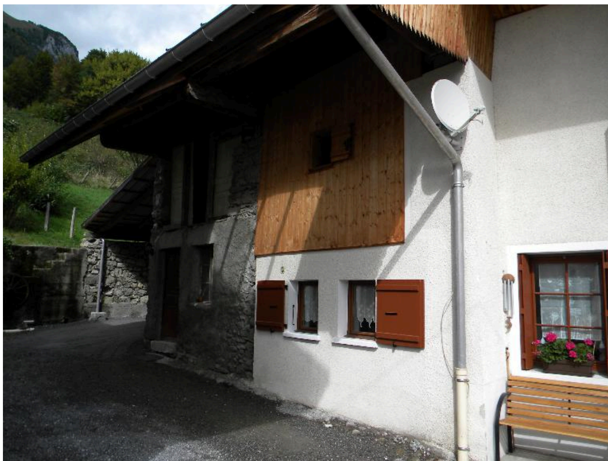
Ancienne étable au bout d'un alignement de fermes mitoyennes (2008 C3 1363)