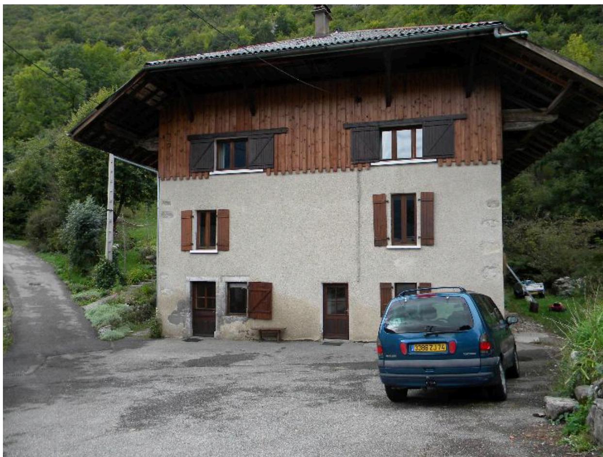
Vue du mur pignon d'une ancienne ferme (2008 C3 300)