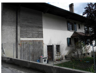
Façade principale d'une ancienne ferme (2008 C3 2648)