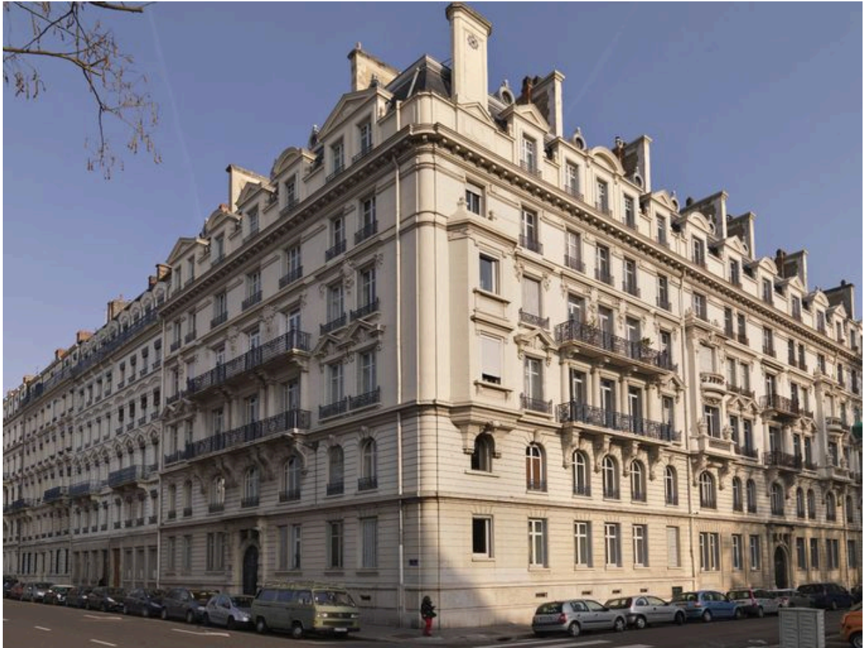
Vue générale de l'élévation sur le quai Claude Bernard.