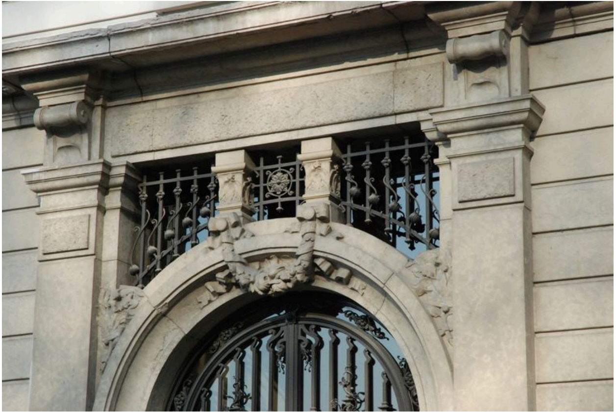
Détail de l'entrée située 2 place Ollier.