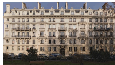
Vue générale de l'élévation sur la place Ollier.