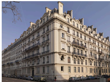
Vue générale de l'élevation sur le quai Claude Bernard.