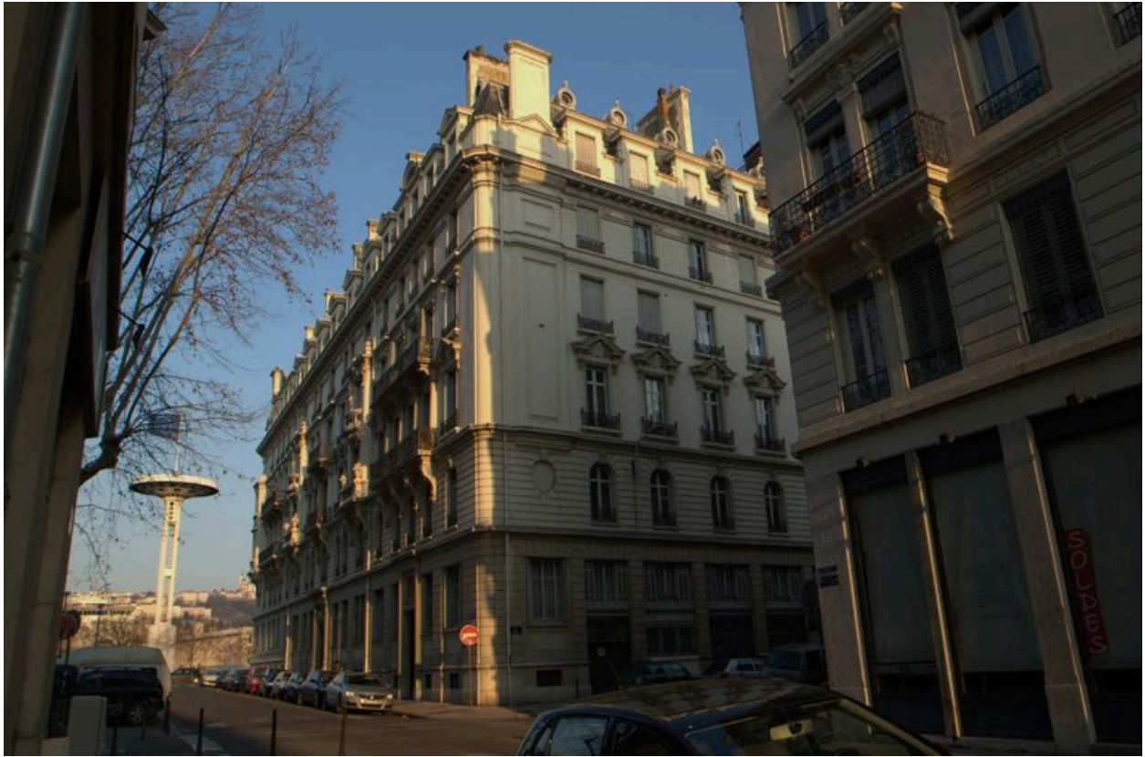
Vue de l'élévation située rue Cavenne.