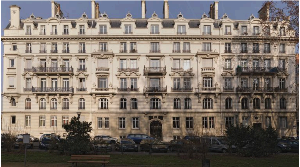
Vue générale de l'élévation sur la place Ollier.