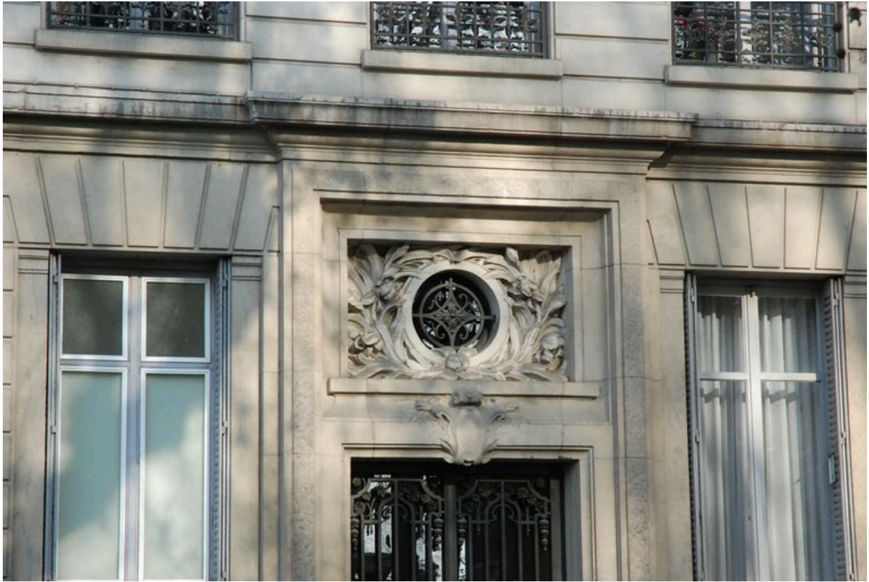
Détail de l'imposte de l'entrée située 3 place Ollier.