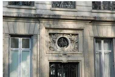
Détail de l'imposte de l'entrée située 3 place Ollier.