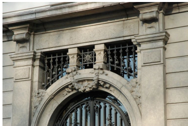
Détail de l'entrée située 2 place Ollier. IVR82_20126900826NUCA

Vue du quai Claude-Bernard après 1904 : l'ensemble Rostagnat ferme l'îlot (carte postale, AC Lyon 4 Fi 173) IVR82_20126900821NUCB