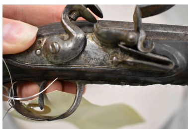
Vue de détail