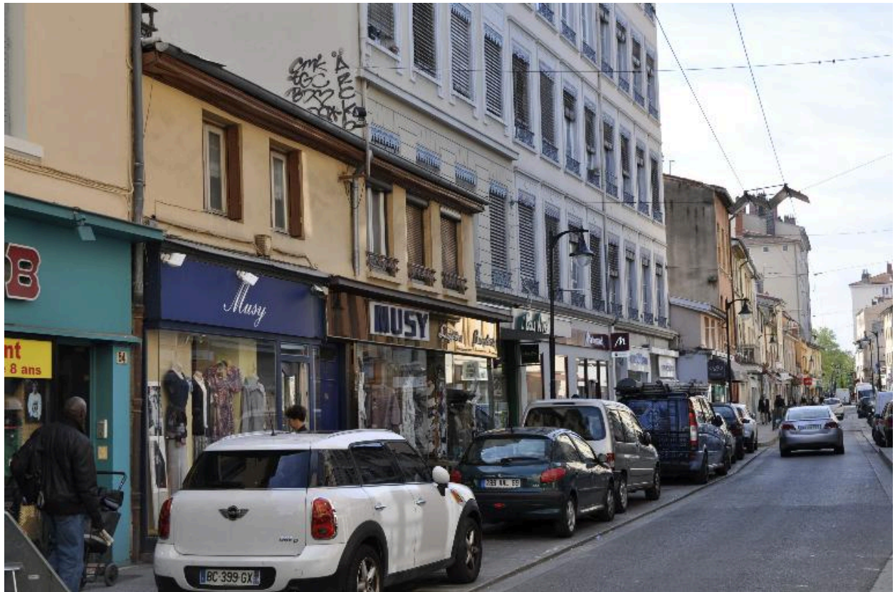
Vue d'ensemble nord ouest