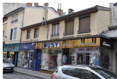
Vue d'ensemble sud ouest IVR82_20146900550NUCA