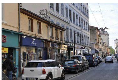
Vue d'ensemble nord ouest IVR82_20146900526NUCA