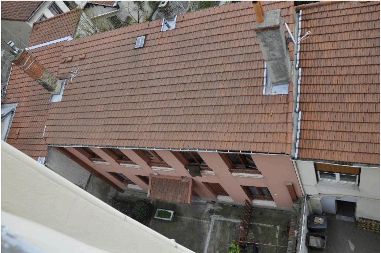
Vue du bâtiment sur cour