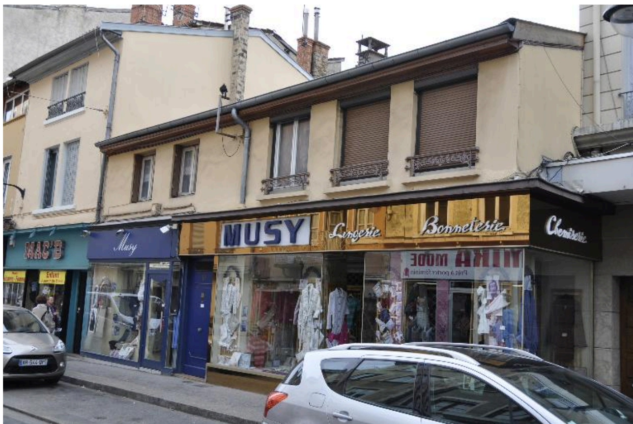
Vue d'ensemble sud ouest