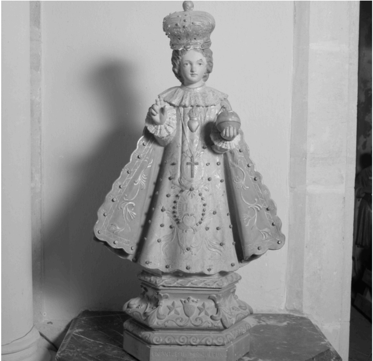
Statue : Enfant Jésus miraculeux de Prague.