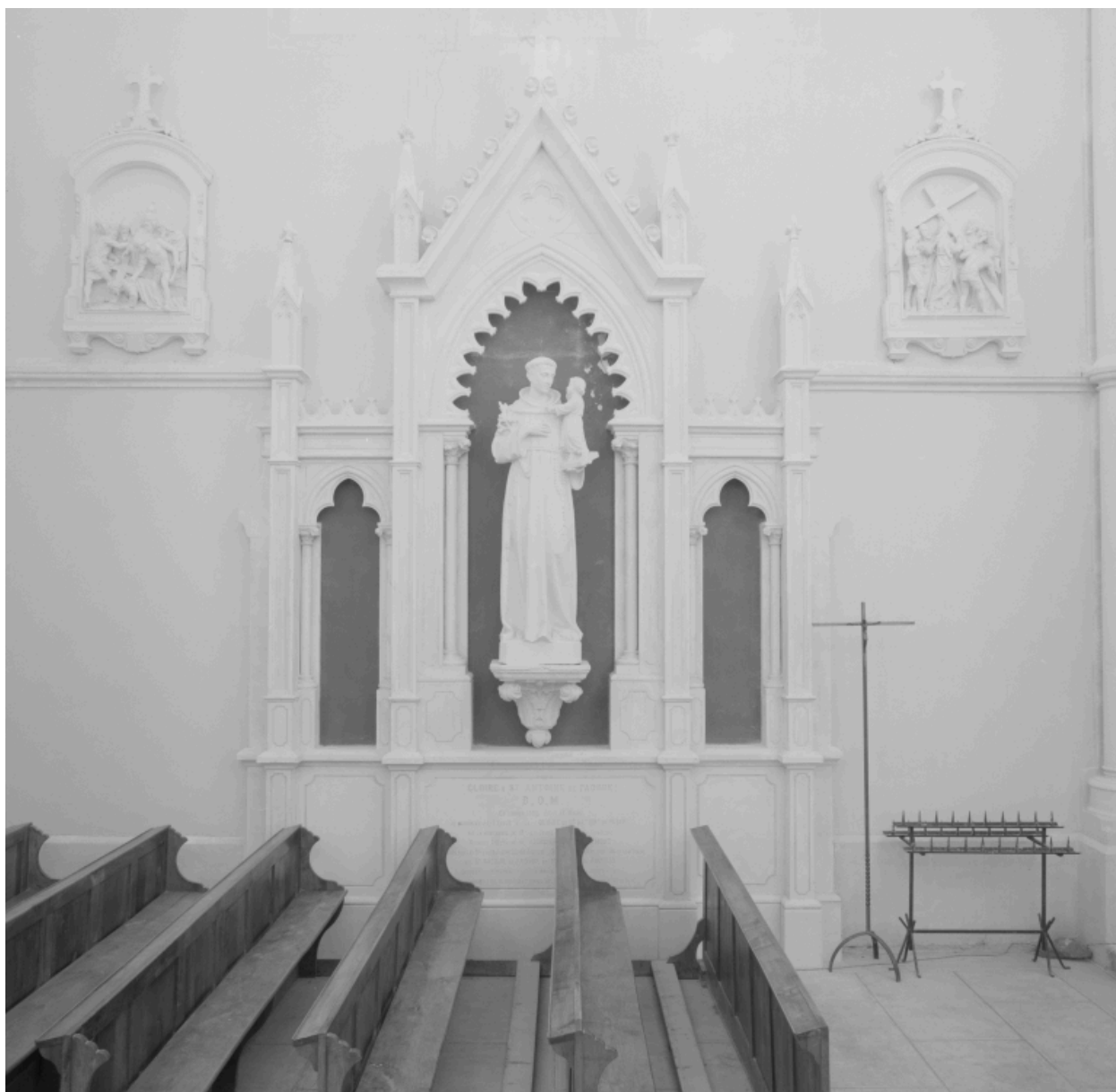
Narthex, bras gauche : retable et statue de saint Antoine de Padoue.