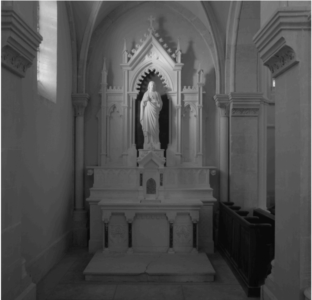
Chapelle du Sacré-Coeur : autel-retable et statue du Sacré-Coeur.