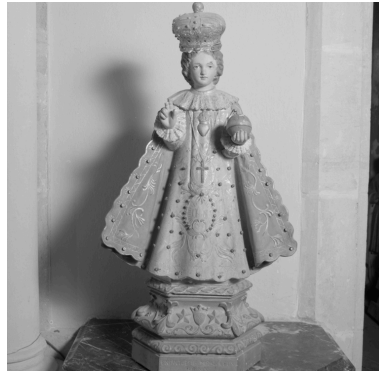
Statue : Enfant Jésus miraculeux de Prague. IVR82_19992600524X