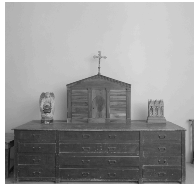
Meuble de sacristie, ange quêteur, croix d'autel n° 2 et châsse.