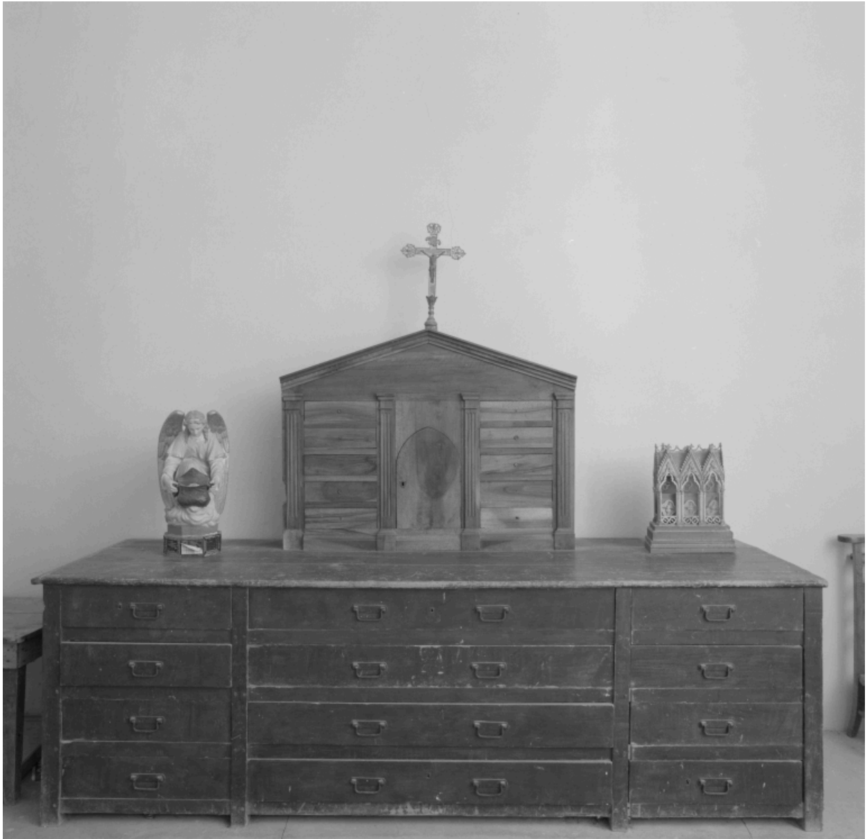
Meuble de sacristie, ange quêteur, croix d'autel n° 2 et châsse.