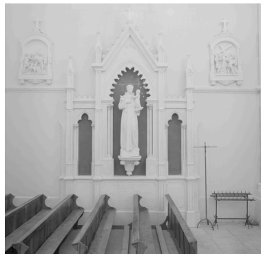
Narthex, bras gauche : retable et statue de saint Antoine de Padoue. IVR82_19992600477X