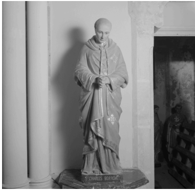
Statue, d'un ensemble de 3 : saint Charles Borromée. IVR82_19992600475X