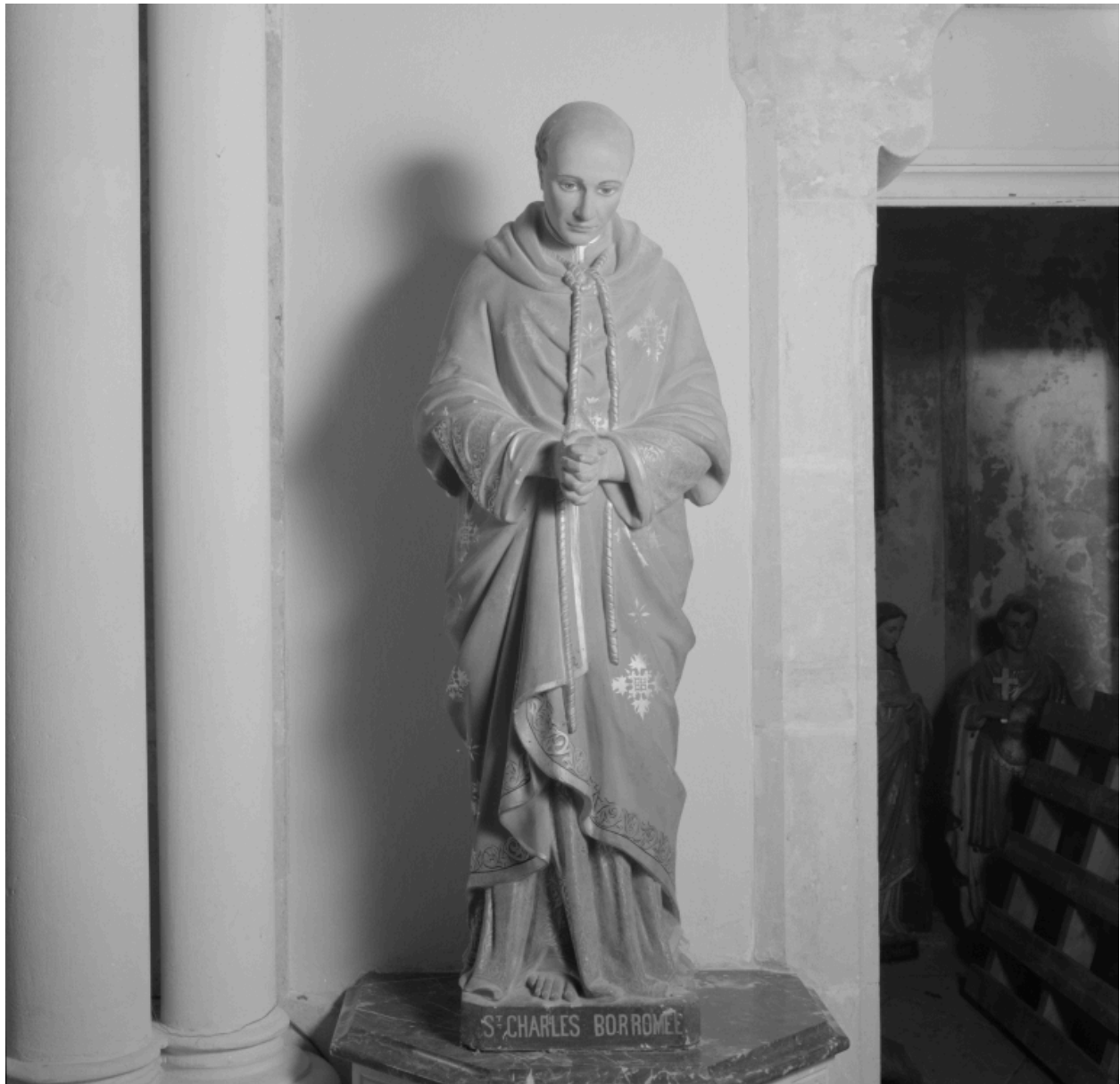
Statue, d'un ensemble de 3 : saint Charles Borromée.